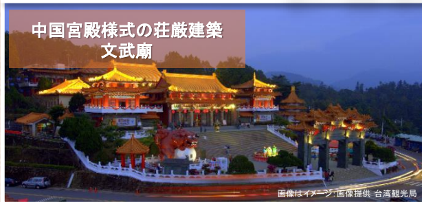
画像はイメージ