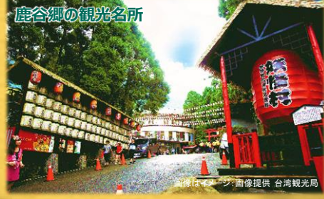
鹿谷郷の観光名所

忠鹿谷小半天地区の農家の多くは、以前、孟宗竹を栽培していましたが、その後、お茶の木を導入しました。あちこちで茶園と竹林の濃淡のある緑が交錯し、竹の里の風情が魅力的。