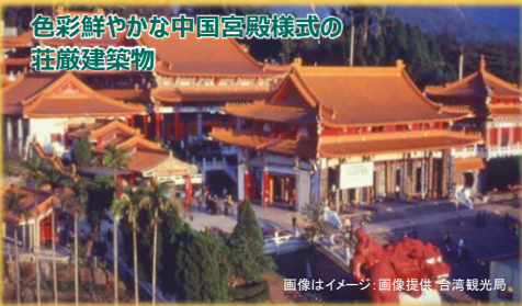
色彩鮮やかな中国宮殿様式の 荘厳建築物