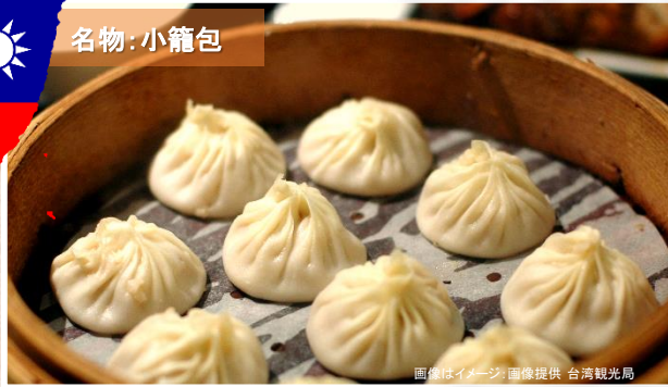
画像はイメージ