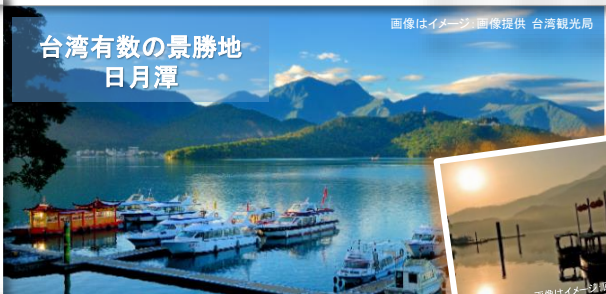
画像はイメージ