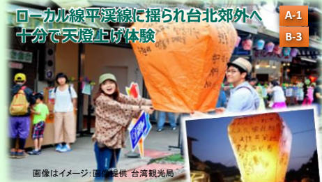
ローカル線平溪線に揺られ台北郊外へ 十分に天燈上げ体験