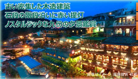
古い密集した木造建築 石段の階段沿いに赤い提灯 ノスタルジックな九份の夕景鑑賞

旅情溢れるローカル列車「平溪線」沿線にある十分はどこか懐かしい雰囲気漂う街。名物は天燈上げ体験で、大きなランタン（天燈）に、願いを書いて空に飛ばします。