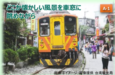
どこか懐かしい風景を車窓に 眺めながら

台湾北部の瑞芳鎮の山あいの町。台湾の郷愁を誘うエリアで、山の斜面に急な石段が続く、しっとりとした風情に包まれます。町中に赤いちょうちんがぶら下がり、所狭しと飲食店やお土産屋さんが軒を連ねています。