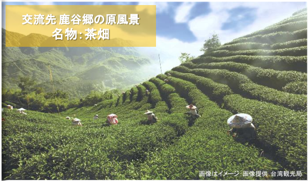
画像はイメージ