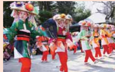
南 須 釜 の 念 仏 踊 り