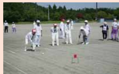
ゲ ー ト ボ ー ル 大 会