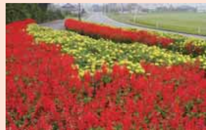
花 い っ ぱ い 運 動