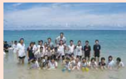
中 学 生 国 内 研 修 事 業