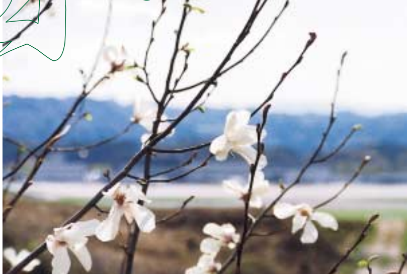
岩法寺山に咲くこぶし

そよぐ風が新たな希望と期待 をはこぶ春。人々の心は生気 みなぎり、草木の芽が「張る」 などにも由来する清々しい季 節だ。雲雀がさえずり、こぶ しの花開き、辺りはやわらか な薄黄緑色になる。あたたか く素朴な自然が豊かな人情味 あふれる玉川の人と風土を培 ってきたのだろうか。