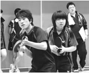
第30回玉川村民卓球大会より (12月8日)