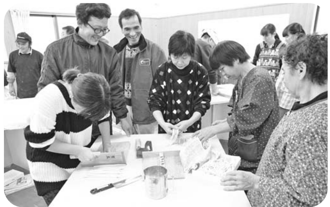
「うどん打ち」講習会を楽しむ参加者

収穫祭は、同組合の活動を地域の人や子ども達に知ってもらうとともに交流の場を図ろうと、毎年開催されているもので、地域住民など約70人が参加。今年は参加者による「うどん打ち」講習会も行われ、権現山など地区内の自然・名所旧跡等を散策した後、自分たちで打ったうどんを美味しく食べ交流を深めました。