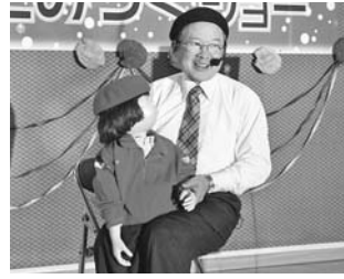
第10回南須釜区民芸能祭りより (11月24日)