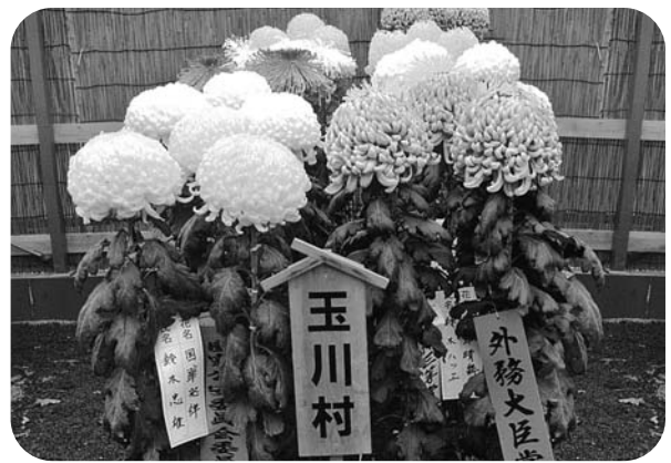
各賞を受賞した玉川村菊花愛好会の菊花