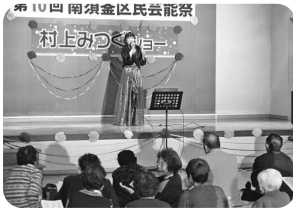
熱唱熱演のオンステージ!

出演者の皆さんは、日頃の練習の成果を十分に発揮し、会場に詰めかけた多くの区民から、ステージ上で繰り広げられる多種多様な芸能の祭典に温かい拍手が送られていました。