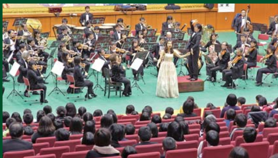
日フィルによるオーケストラ公演が行われた 小学校芸術鑑賞教室

優れた舞台芸術を堪能 小学校芸術鑑賞教室 11月28日、たまかわ文化体育館で小学生芸術鑑賞教室が開かれました。 今年は日本フィルハーモニー交響楽団による一流のオーケストラ公演を、村内の小学校児童をはじめ、保護者関係も鑑賞しました。 鑑賞教室では、様々な楽器の紹介やオーケストラと児童らによる合奏などが行われ、鑑賞した児童らは、迫力ある生のオーケストラ演奏に圧倒されながらも、音楽芸術への関心を深めていました。