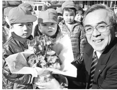
いずみ幼稚園・すがま幼稚園・泉保育所勤労感謝訪問より(11月22日)