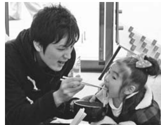
山小屋集落営農組合「収穫祭」より(11月24日)