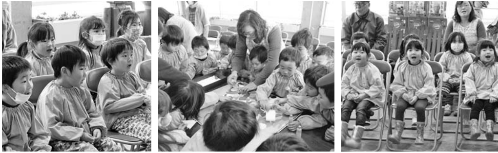
福島空港公園事業「おひな様を飾ろう」より(2月17日)