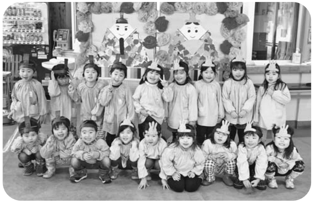
完成したお雛様・お内裏様の前で