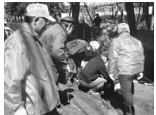
震災直後、現場指揮する筆者