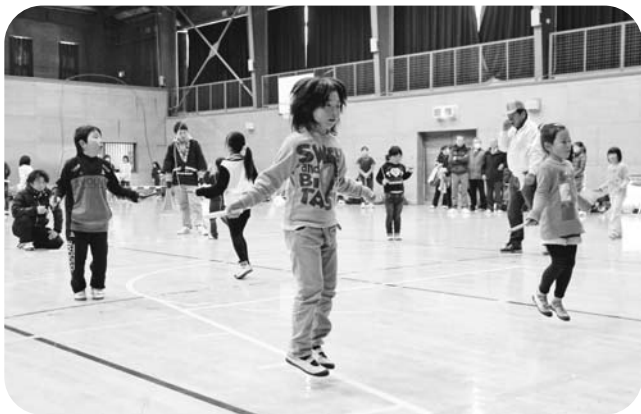
軽快なリズムで縄跳びをする参加者