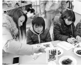
スタンドグラスワークショップより(2月16日)