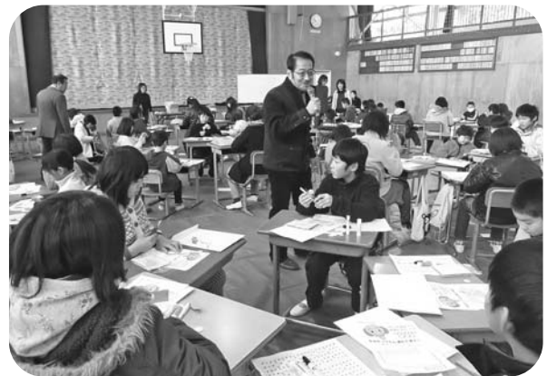
楽しく絵本作りに取り組む児童ら

ワークショップは、川辺小全校児童と全教職員が自由な表現（創作オノマトペ）で、一人ひとりが自分の絵本を作成。それらを繋げて一冊の絵本（エンドレス絵本）を作るという内容でした。オノマトペとは、擬音語や擬態語を包括した言葉で、参加した児童らは、「発想し、形にする」絵本作りに苦戦しながらも楽しく取り組んでいました。