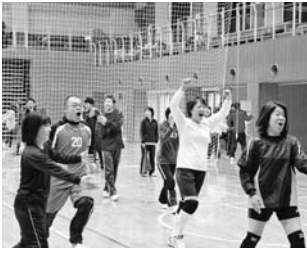
混合家庭バレーボール大会より(2月2日)