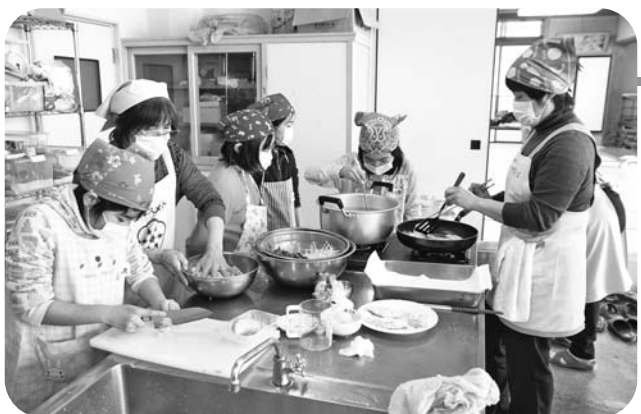
一生懸命料理する参加者