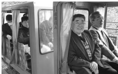
台北市でトロッコ乗車