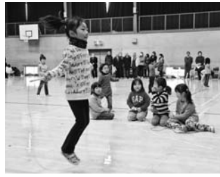
第28回縄跳び大会より(2月23日)