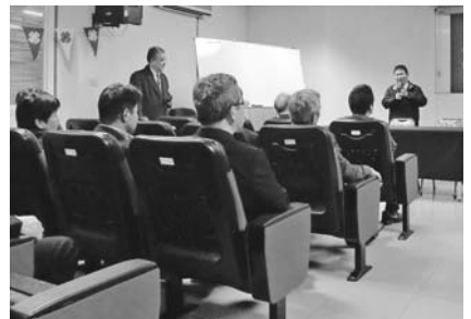
農会でお茶の説明を受ける訪問団