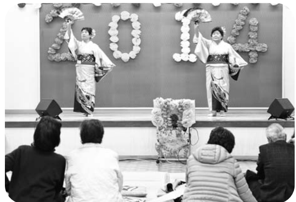
華麗な舞踊を披露する出演者