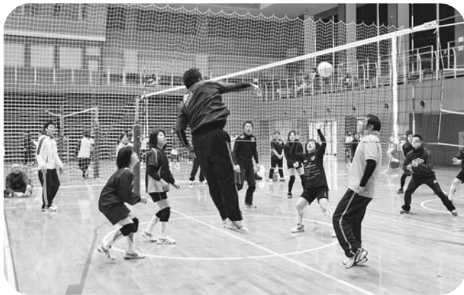
一球入魂 熱戦を繰り広げた参加者