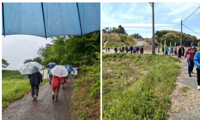
晴れの日も、雨の日も元気にウォーキング!

お友達同士で歩けばあっという間の各コース約2kmの道のりですが、初めて通った道やいつも通る道でも発見があったり、昔よく通った道を懐かしんだり、思い思いにウォーキングを楽しんでいたようでした。