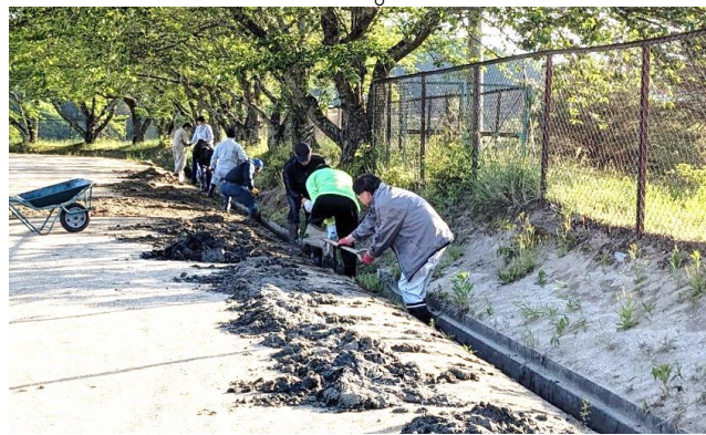
約一年ぶりの土砂上げ。

みんなできれいに! 5月11日(土)、村民グラウンドとその周辺の清掃が行われ、早朝にも関わらず約70人の方々が参加してくださいました。普段、村民グラウンドを利用している団体やスポーツ少年団、地域の皆様、元気クラブ会員、そして玉川村役場の職員など、様々な方々にご協力いただきました。男性陣には側溝の土砂上げ、女性陣には管理棟・Aコートトイレの清掃、そしてグラウンドではソフトスポ少とランニングサークルの子供たちを中心に石拾い、バスケットポ少のメンバーが周辺のゴミ拾いにご協力してくれました。皆様の協力のおかげで、清潔で安全なグラウンドを維持することができました!