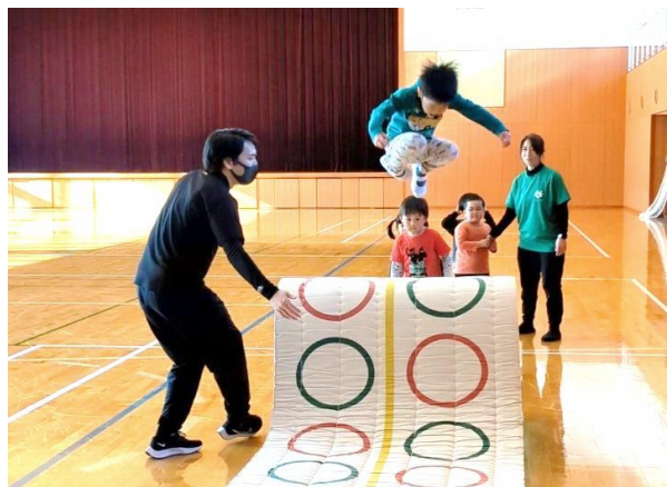
大きくジャンプだ!

日時：水曜 月2回 (幼)年中・年長 15:30～ (児)小学1～2年生 16:30～