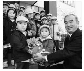
第9回南須釜区芸能祭りより (11月25日)