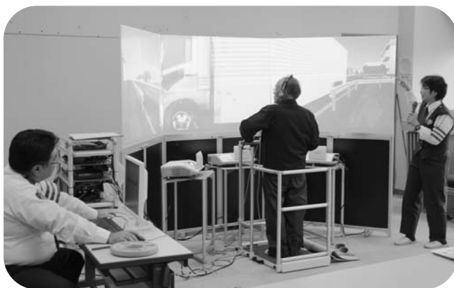
道路横断を疑似体験する参加者

こぶし・なつ椿学級(高齢者学級)では12月5日、たまかわ文化体育館クラブハウスで、福島県警が今年度導入した「歩行環境シミュレータ」を活用し、交通安全講習会を行いました。同機材は、コンピュータグラフィックス(CG)を使って仮想の道路環境をスクリーンに再現し、道路横断を疑似体験できるものです。夕方や夜、雨の日などの環境変えたリアルな道路横断を体験した参加者らは、事故防止への意識を高めていました。