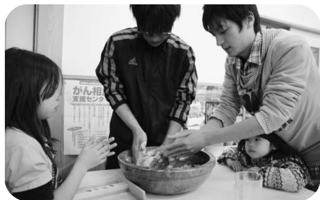
そば打ち体験を楽しむ参加者

また、石孫山や山小屋聖人様など地区内の自然・名所旧跡等を散策した後、自分たちで打ったそばを美味しく食べ交流を深めました。