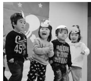
泉保育所お遊戯会より(12月10日)