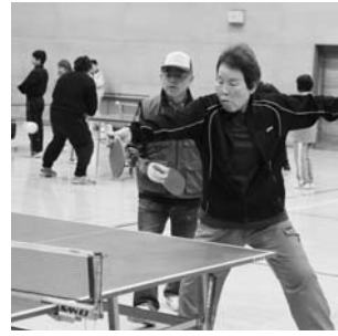
村民卓球大会より(12月9日)