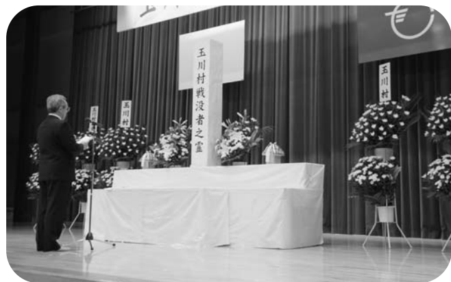
戦没者の御霊に式辞を述べる石森村長