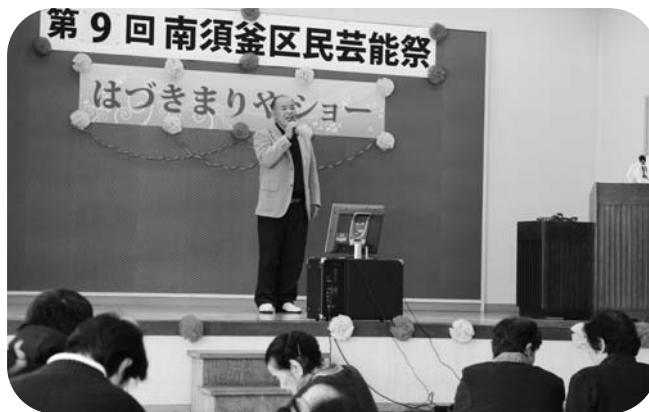
熱唱!熱演!のオンステージ

ステージ上ではカラオケや詩吟など26の演目が披露され、会場に詰めかけた約150人から、温かい拍手が送られていました。