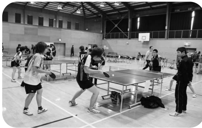
はつらつとプレーする選手