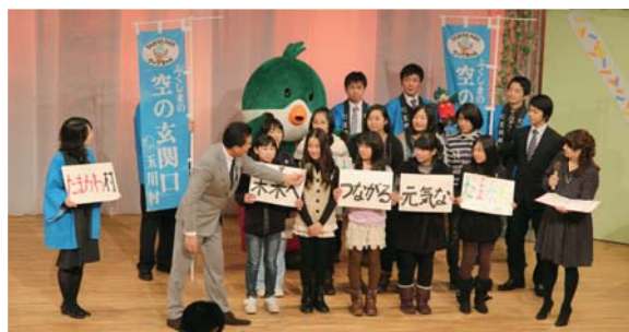
審査会では、出演した川辺小の児童らが 作品をアピールしました