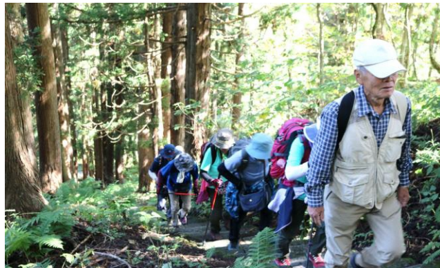
今回の難所、202段の石段