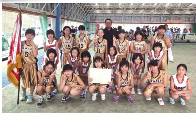
ミニバスケットボール優勝の川辺チーム