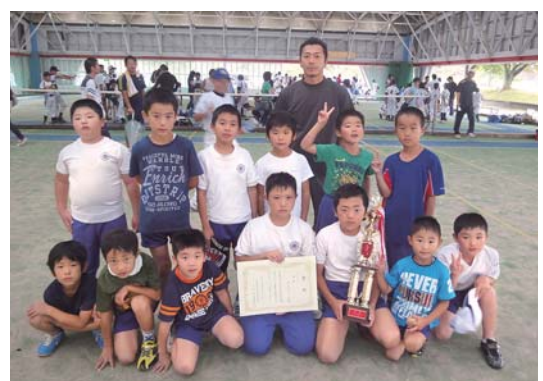
ティーボール優勝の中Aチーム