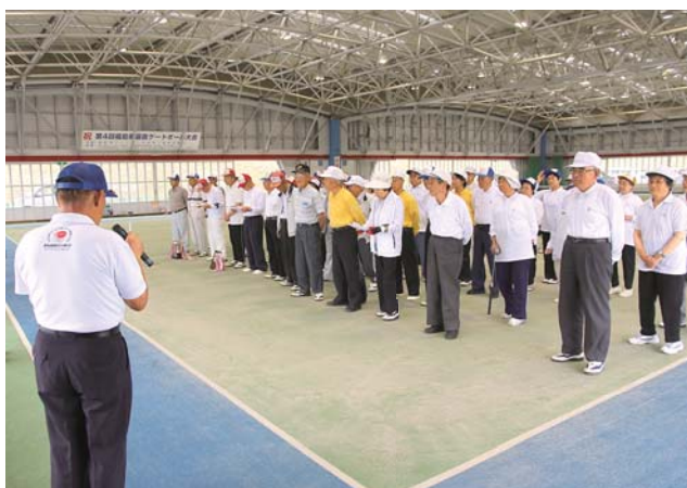
12チームが結集した大会開会式