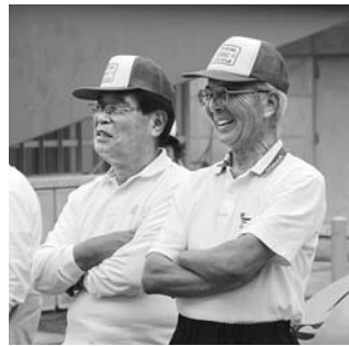
村長杯ゲートボール大会より(7月25日)