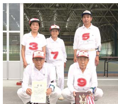
準優勝の小高Aチーム