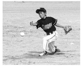
少年球技大会より(7月27日)