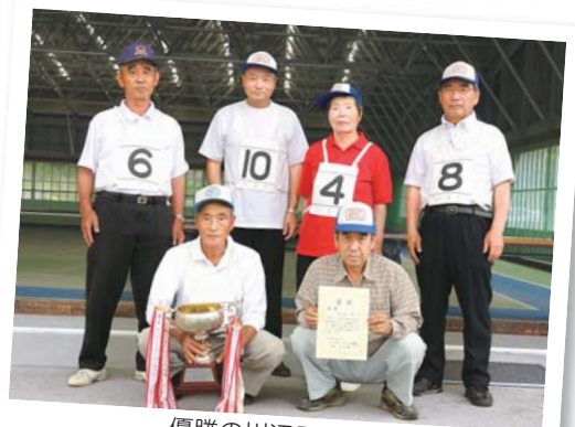
優勝の川辺Bチーム