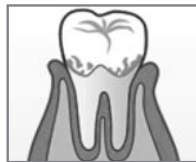
歯肉が腫れる (歯肉炎)