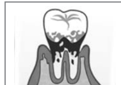
歯の奥深くに炎症 (重度歯周病)