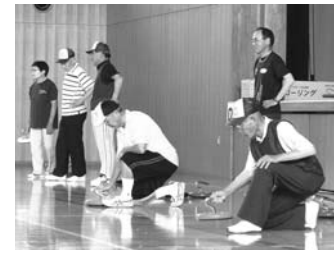
元気スポーツクラブカローリング大会より(7月6日)