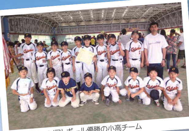
ソフトボール優勝の小高チーム

第42回玉川村少年球技大会が7月27日、村民グラウンド・たまかわ文化体育館で行われました。当日は、曇り空で昼ごろから雷を伴った激しい雨となりましたが、子どもたちは雨にも負けない、熱い戦を繰り広げました。結果は次のとおりです。