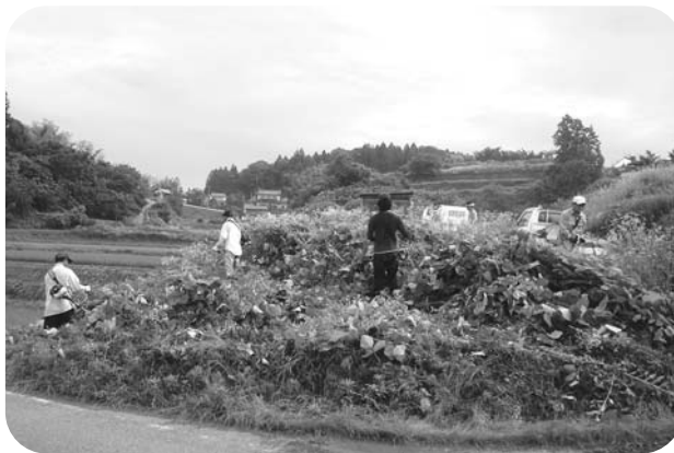
北須釜地内での作業のようす