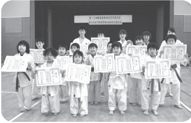
上位入賞を果たした玉川支部の選手のみなさん