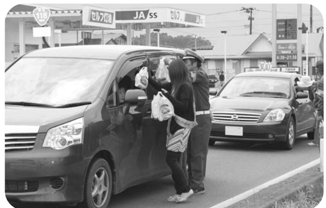
ドライバーに安全運転を呼びかける参加者