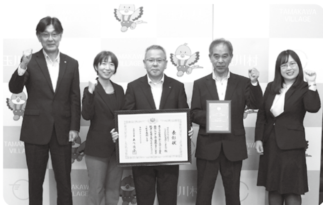
表彰を受けた元気スポーツクラブの方々

10月28日、特定非営利活動法人たまかわ元気スポーツクラブが役場を訪れ、10月16日に東京都霞が関にて、文部科学大臣より「生涯スポーツ優良団体」表彰を受けたことを報告しました。この賞は、地域または職域におけるスポーツの健全な普及および発展に貢献し、地域におけるスポーツの振興に顕著な成果をあげたスポーツ関係者及びスポーツ団体に贈られます。