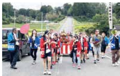
秋祭り子供神輿巡行(岩法寺)