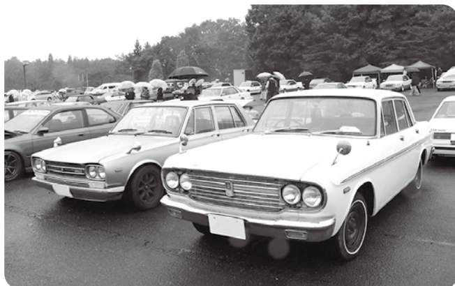
オールドカーがずらりと並ぶ会場

愛好家が丹念に整備した自慢の旧車が並び、来場者は写真撮影やオーナーとの交流を楽しみながら、貴重な旧車の魅力に触れていました。