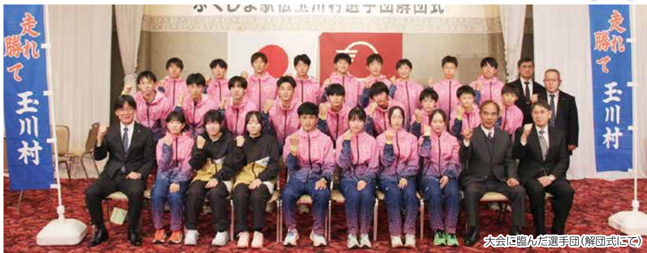
大会に臨んだ選手団(解団式にて)

第37回ふくしま駅伝(市町村対抗福島県縦断駅伝競走大会)が11月16日に開催され、白河市のしらかわカタルスポーツパーク陸上競技場をスタートし、福島市の県庁までの16区間、96.3kmをタスキでつなぎました。