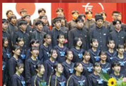
玉川中学生による合唱