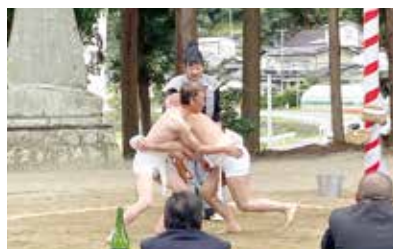
須釜神社奉納相撲(北須釜)