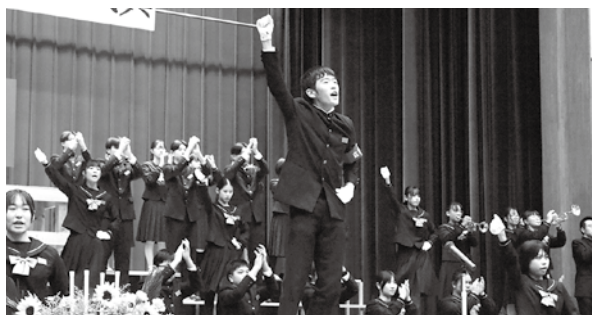
「70周年記念式典玉川中学生による応援演舞」より（11月7日）