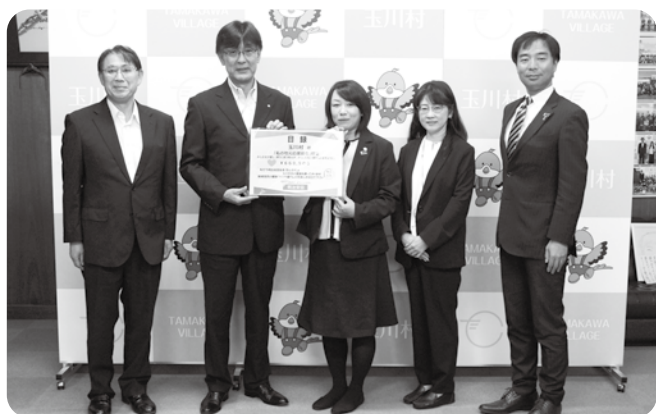
寄付金の目録を渡す明治安田生命の方々