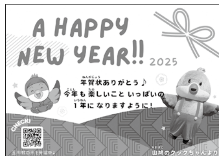
今年のクックちゃんの返信年賀状

〒963-6316 玉川村大字竜崎滝山12-26 乙な駅たまかわ 玉川村観光物産協会宛