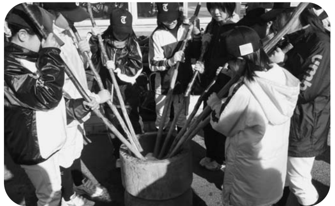
力を合わせ餅つきする団員

団員らは、まず大雷神社(小高)で今年の必勝を祈願したあと、団員、保護者、指導部関係者ら総勢80人で餅つきを行い、つきたての餅を食べながら、今年一年の活躍を誓いました。