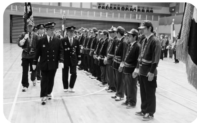
統監の通常点検を受ける団員