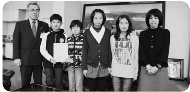
玉川第一小学校の皆さん