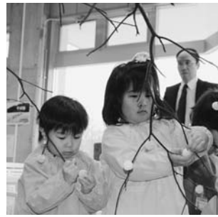
いずみ幼稚園小正月行事の団子さし作りより（1月12日）