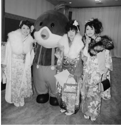
村のイメージキャラクター「山鳩クックちゃん」も20歳になりました