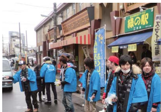
村の特産品を手に、安全性をPRする会員