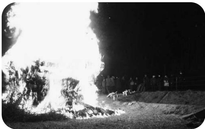
南須釜・南宿地内の「やっっちゃ小屋」