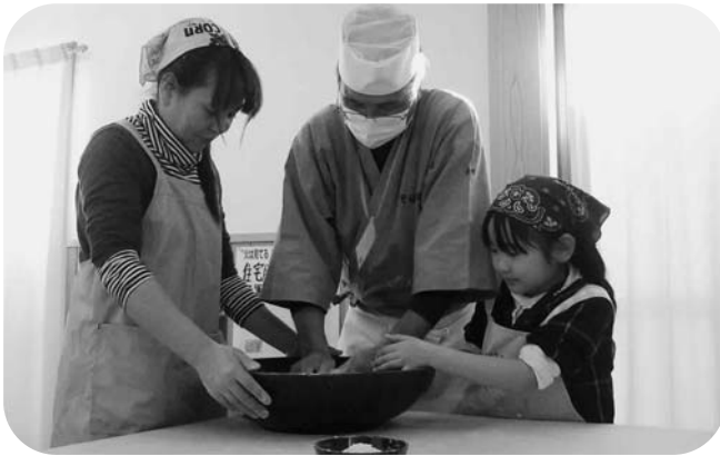
講師(中央)の手ほどきを受けながらそばを打つ参加者

参加者らは、熟練の講師からそば打ちのコツを伝授され、自分で打ったそばに舌鼓を打ちました。また、会場近くの山林で木々を集め、リースづくりも行い、里山の魅力を親子で体験し、心に残る一日となりました。