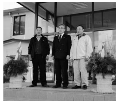
立派な門松をありがとうございます

12月19日、玉川村建設業組合様の善意により、庁舎玄関に手作りの門松が設置され、無事正月を迎えることができました。