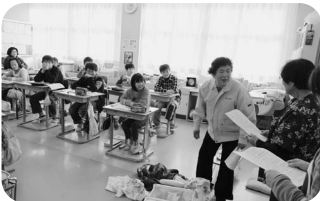
寸劇を通して楽しく学ぶ児童

この研修は、認知症について正しく理解し、認知症の人や家族を温かく見守る応援者(認知症サポーター)になつてもらおうと開催され、講話や寸劇を通して早期発見、予防、接し方など認知症に対する理解を深めました。受講した児童には、「認知症の人を応援します」という意志を表す自印の「オレンジリング」が手渡されました。