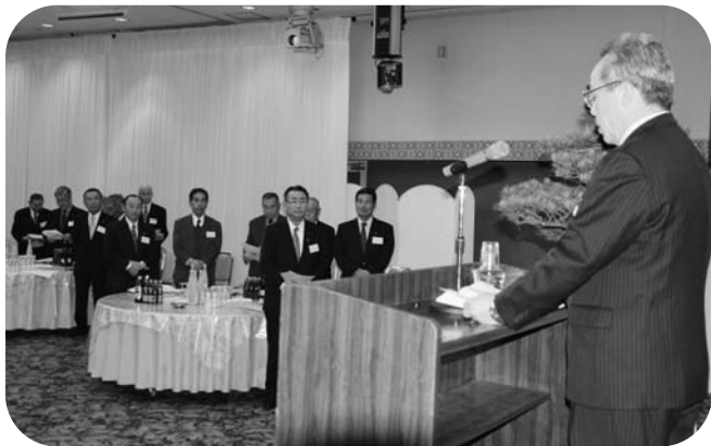
新年のあいさつをする石森村長