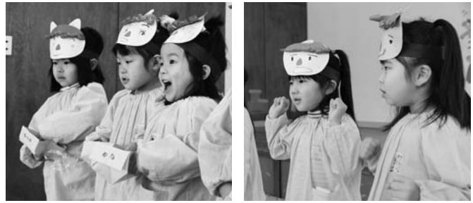
泉保育所豆まき会より(2月3日)