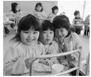
すがま幼稚園「ひなまつり会」より(3月2日)