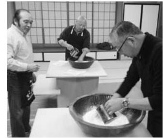
蕎麦&うどん打ち教室より(2月22日、3月7日)