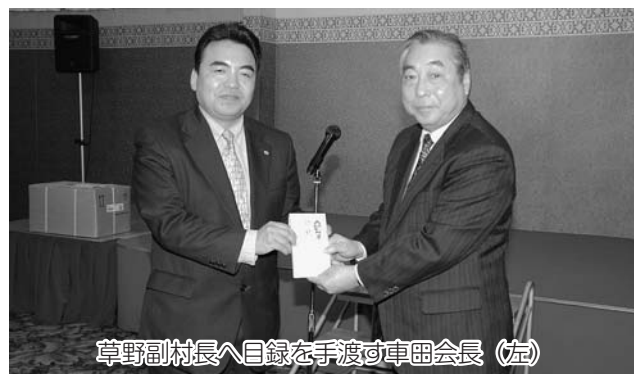
草野副村長へ目録を手渡す車田会長(左)