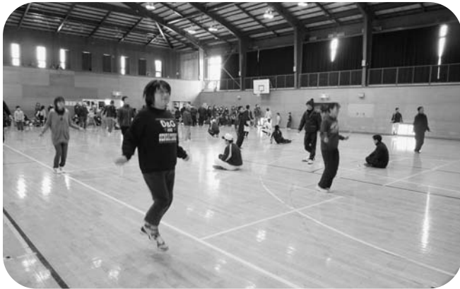
日頃の成果を発揮し、縄跳びする参加者