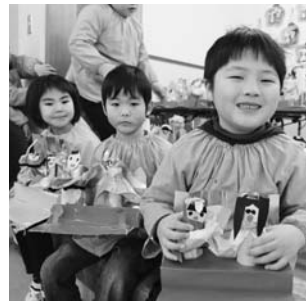
いずみ幼稚園「ひなまつり会」より（3月2日）