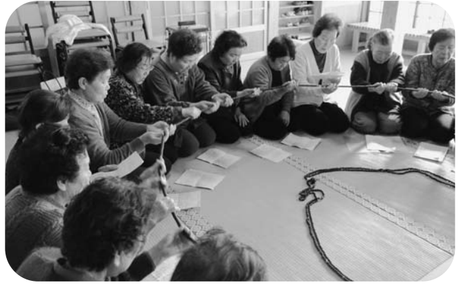
輪になり、念仏を唱えながら大きな数珠をまわします