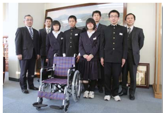
車イスを寄贈した須釜中学生徒会の皆さん