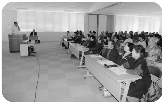
講師の話しに聴き入る受講者