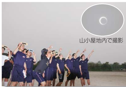
山小屋地内で撮影