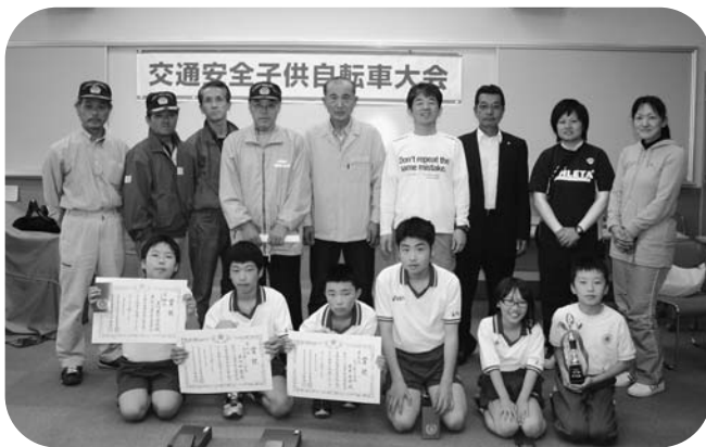
玉一小チームと関係者の皆さん

大会には、地区大会を勝ち上がった9小学校が出場し、学科、技能走行で安全運転を競いました。上位6チームが7月7日、二本松市で開かれる県大会に出場となり、活躍が期待されます。