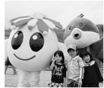
きぐるみキャラクターまつり (5月6日) より