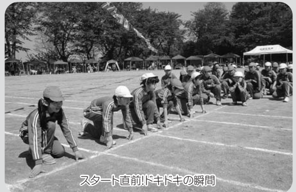
スタート直前!ドキドキの瞬間