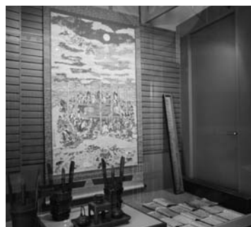
お釈迦様が描かれた涅槃図(中央の掛軸)