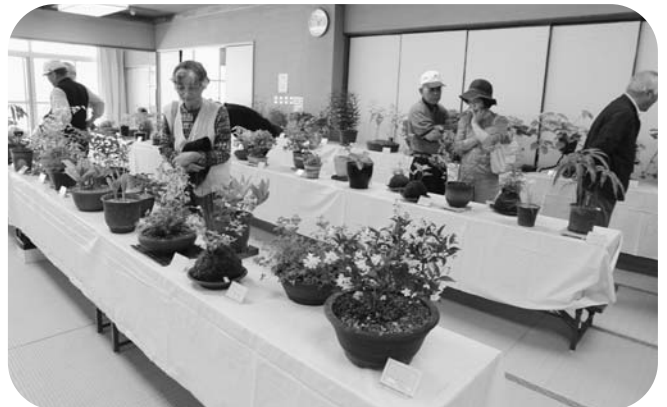
素晴らしい作品に見入る愛好家