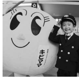
福島空港復活祭（5月3日）より