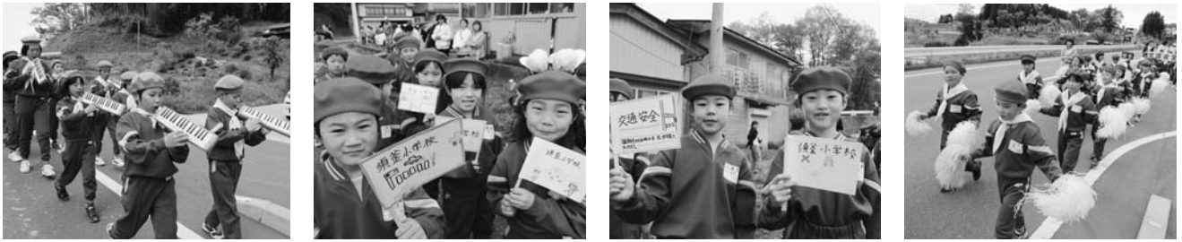
須釜小鼓笛パレード（5月11日）より