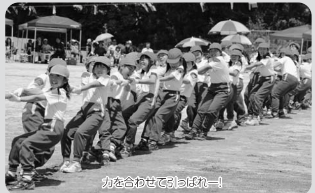
力を合わせて引っばれー!