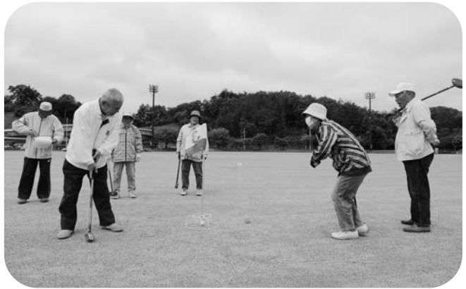
楽しくプレーする出場者

当日は、玉川村の山鳩クックちゃんをはじめ、ジュッピーちゃん（平田村）など8体のキャラクターが登場。大勢の子どもたちに囲まれ、握手をしたり記念写真に応じていました。