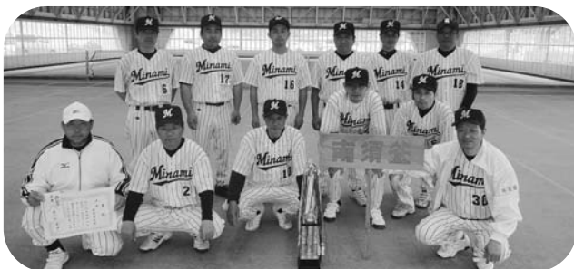
ソフトボール優勝の南須釜チーム