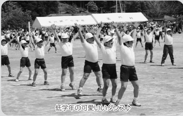
低学年の可愛いダンス♪