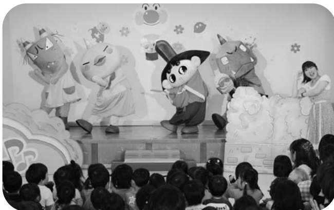
歌と踊りで元気をくれたおじゃる丸ショー

子どもたちは可愛いキャラクターたちを目の前に大喜び。おじゃる丸のショーでは一緒に歌ったり踊ったり楽しい時間を過ごしました。