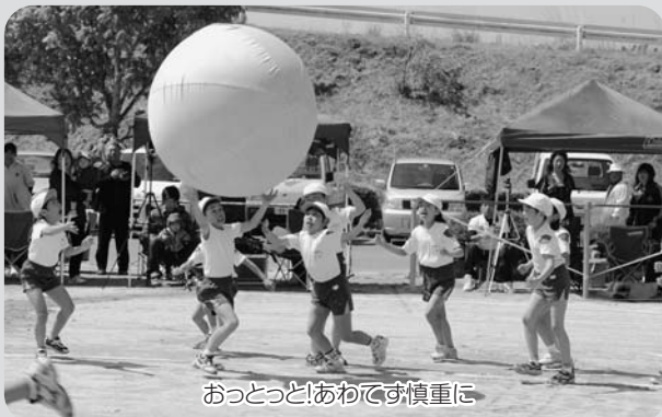
おとっと!あわてず慎重に