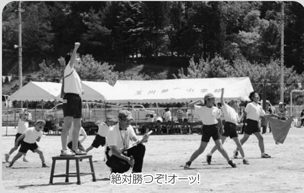
絶対勝つぞ!オーツ!