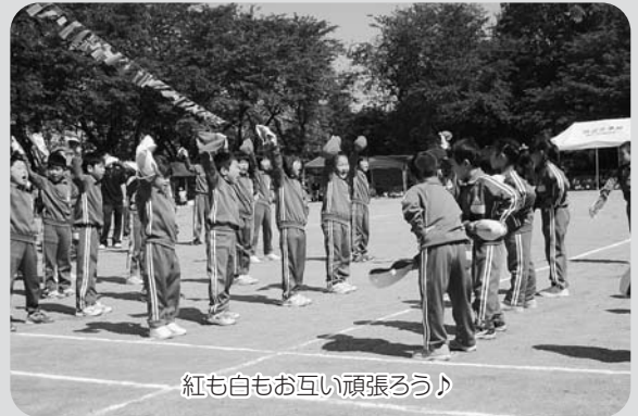
紅も白もお互い頑張ろう♪