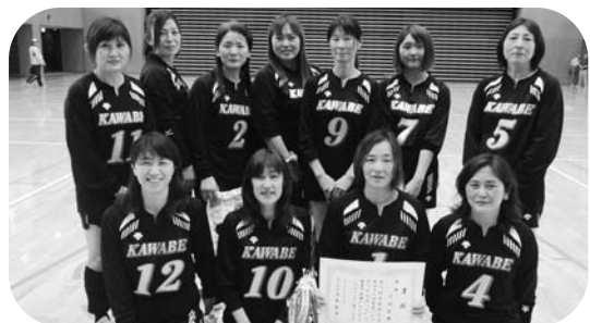
バレーボール優勝の川辺チーム