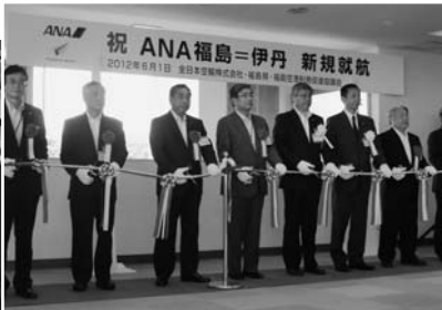
贈呈されたDHC8-402型の模型