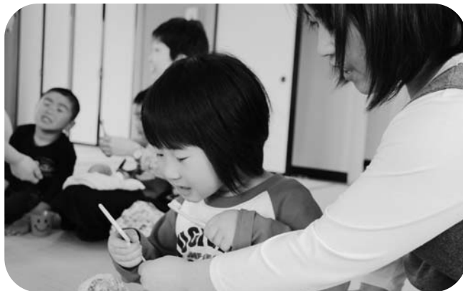
磨き残しがないよう注意して、歯みがきする親子