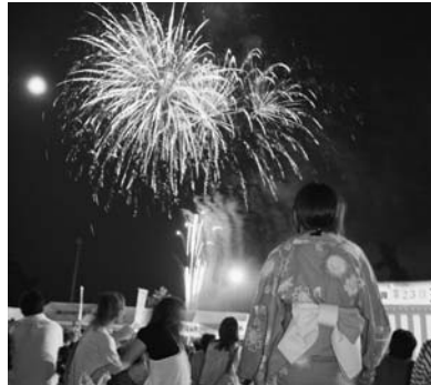
昨年の玉川夏祭りから