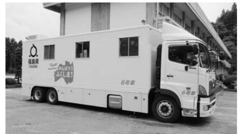
配置されるホールボディカウンター車

一般住民の方を対象とした内部被ばく検査については、公立岩瀬病院の構成市町村で購入された移動式ホールボディカウンターにより、希望者に対し検査を実施する予定です。 詳細が決まり次第、回覧板等でお知らせします。