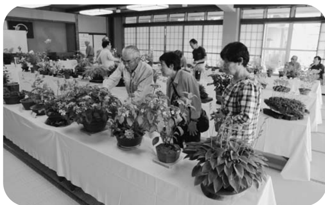
一つひとつをじっくりと鑑賞する愛好者