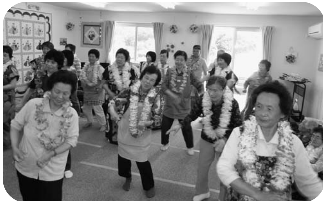
奉仕団とフラダンスを踊る仮設住宅の皆さん

この活動は、県の東日本大震災復興支援事業被災者支援活動の一環として実施されているものです。 奉仕団の皆さんは、避難者と一緒に花笠踊りやフラダンスを踊ったり、歌を歌うなど、楽しい時間を過ごし、仮設住宅の方たちから「楽しかったです」と笑顔で声をかけられました。