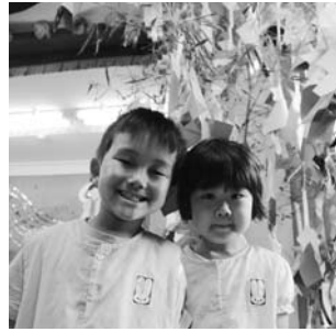
いずみ幼稚園の七夕会より（7月6日）