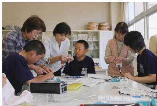
学校支援ボランティアから裁縫の指導を受ける泉中生徒