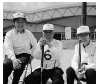
第27回石川郡ゲートボール大会より(6月29日)