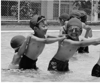
須釜小プール授業より（6月20日）