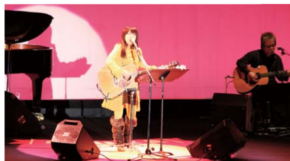
コンサートのようす