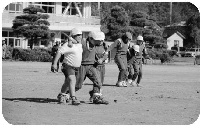
「いち・にいち・に」の掛け声で3人4脚

この三二運動会は、1年生から6年生までの学年の枠を超えた20チームの縦割り班で行われました。各チーム、上級生と下級生が互いに思いやり協力しながら、優勝目指して競技に取り組んでいました。