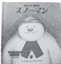
▲さわってあそぶスノーマン レイモンド・ブリッグス 著