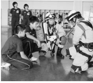
須釜中学校職場体験学習より