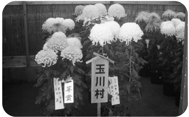
各賞を受賞した玉川村菊花愛好会の菊花