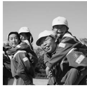
玉川第一小学校ミニ運動会より（11月8日）