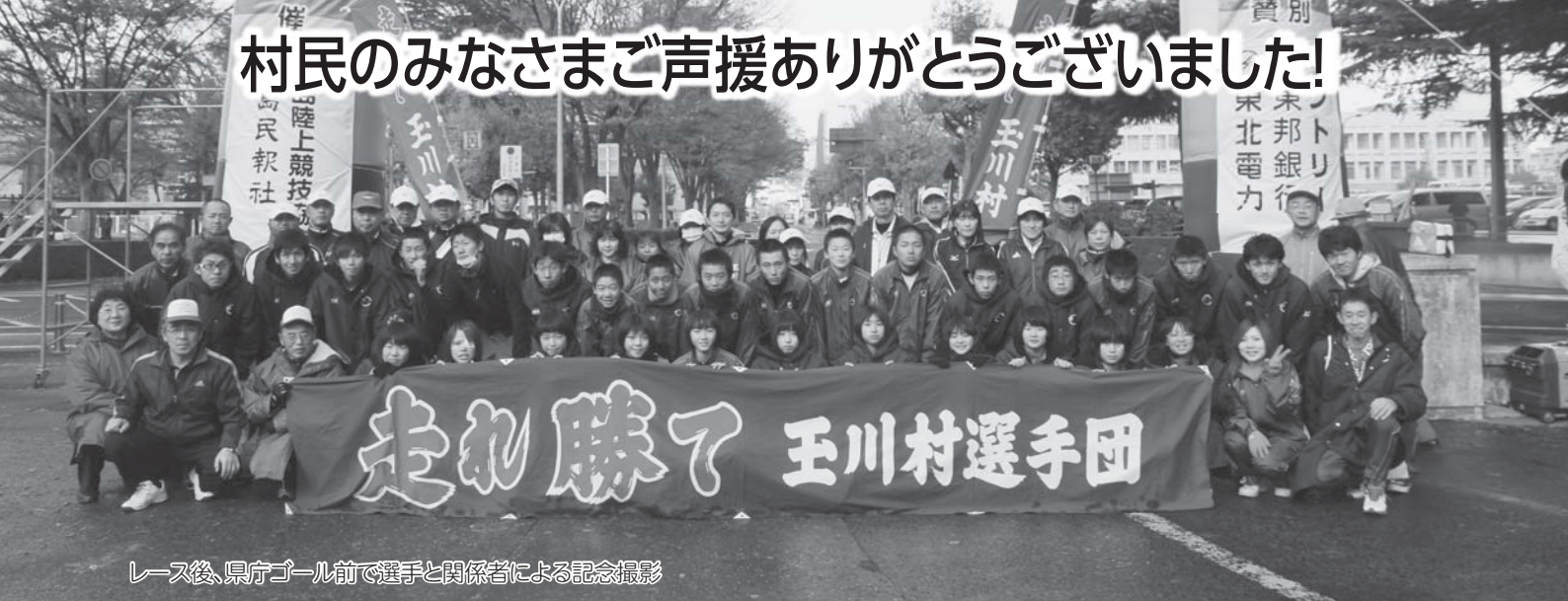
レース後、県庁ゴール前で選手と関係者による記念撮影