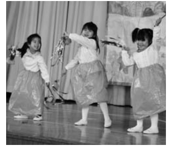
いずみ幼稚園生活発表会より (12月8日)