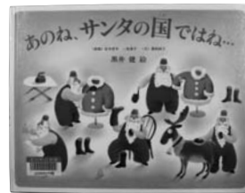
▲あのね、サンタの国ではね.. 黒井 健 絵