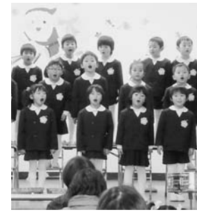
～すがま幼稚園生活発表会より～