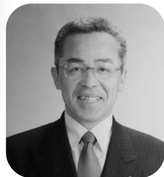
玉川村長 石森 春男