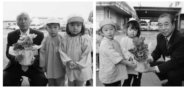
～泉保育所勤労感謝訪問より～