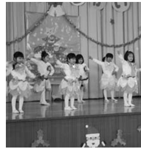
～いずみ幼稚園発表会より～