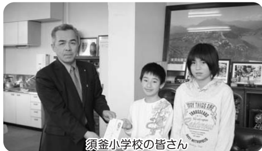
須釜小学校の皆さん