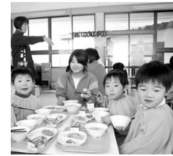
～須釜中学校とすがま幼稚園の交流事業より～