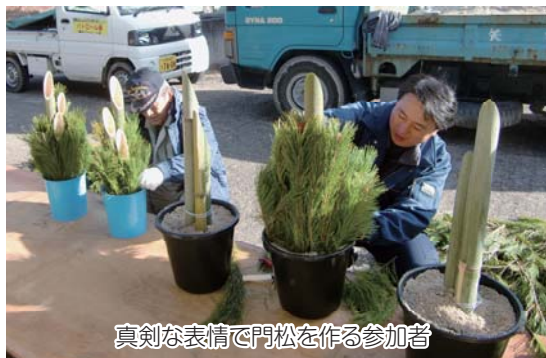
真剣な表情で門松を作る参加者