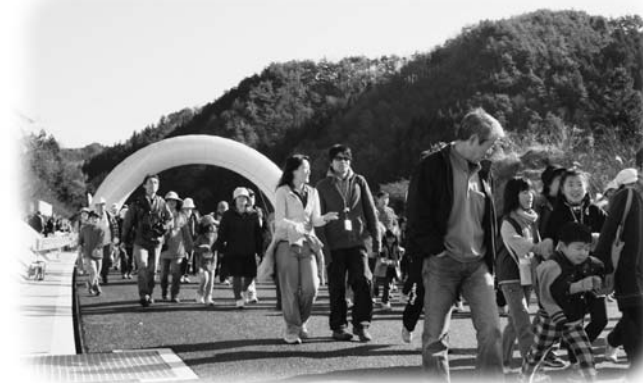
あぶくま高原道路の未開通区間を歩く参加者

今年度中に全線開通予定のあぶくま高原道路の未開通区間を歩く、全線開通イベント「あるけ歩け大会FINAL」が11月27日、平田村の平田西インターチェンジ予定地付近をスタート・ゴールに開かれました。当日は、あぶくま高原道路を歩くことができるラストチャンスとあって、県内各地より500人を超える人々が参加しました。