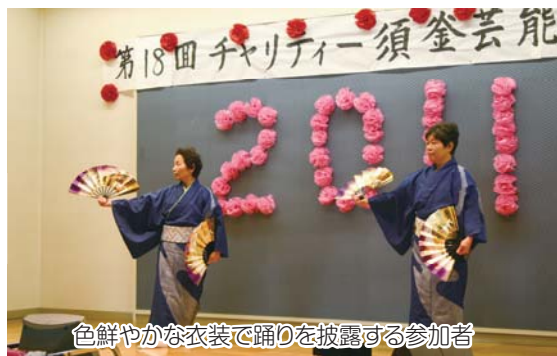
色鮮やかな衣装で踊りを披露する参加者