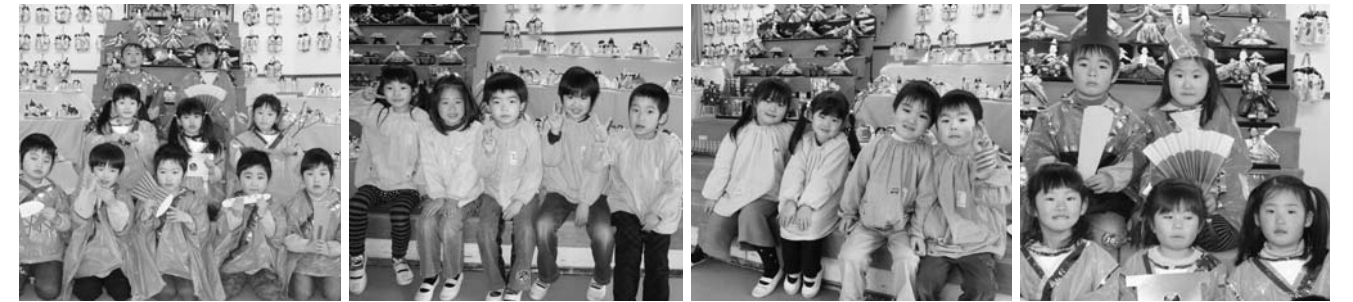
いずみ幼稚園「ひなまつり会」より(3月3日)