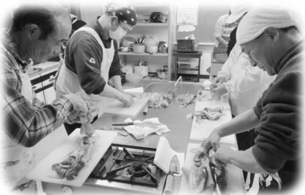
真剣な表情でいかをさばく参加者

男性を対象とした「魚さばき教室」が2月23日と3月8日の2回にわたり、玉川村保健センターで行われました。この教室は、楽しくさばいておいしく食べるをモットーに、1回目が塩辛とあじのたたき、2回目がイワシのつみれ汁と鯛の刺身を作りました。参加者の中には、初めて魚をさばく受講者もあり、慣れない作業に悪戦苦闘しながらも、真剣な表情で魚をさばいていました。