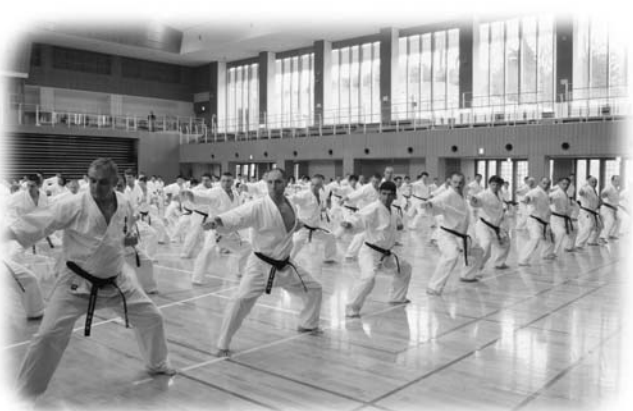
空手の型の指導を受ける参加者

世界の猛者が玉川村に集結 極真館国際指導者合宿 毎年恒例となっている極真空手道連盟極真館主催による国際指導者合宿が2月11日から13日まで、たまかわ文化体育館で行われました。合宿には、国内はもとよりブルガリア、ウクライナ、ロシアなど14ヶ国から179名の指導者らが参加し、空手道の型や組手、棒術などを習得していました。この合宿は、毎年日本とロシアで開催され、国内では福島県が会場となっており、海外の空手指導者たちは、日本に行ったら「フクシマ」に行けという言葉が合言葉となっています。