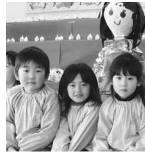
すがま幼稚園「ひなまつり会」より(3月3日)