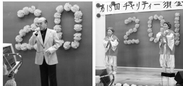
チャリティー須釜芸能の集い(2月20日)より