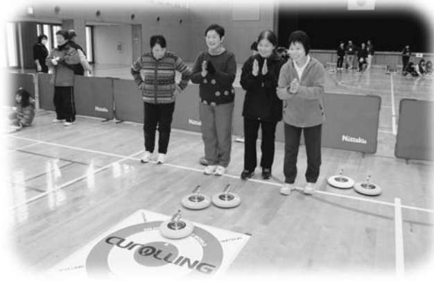
和気あいあいの中でカローリングを楽しむ参加者

たまかわ元気スポーツクラブ交流カローリング大会が2月5日、たまかわ文化体育館で開催されました。カローリングとは、氷上のスポーツ「カーリング」からヒントを得て誕生した、全ての世代で手軽に楽しむことができる屋内専用のスポーツで、当日は50人を超す参加者が出場し、笑いや歓声が絶えず、スポーツの楽しさを実感した1日となりました。