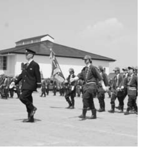
～玉川村消防団春季検閲式より～