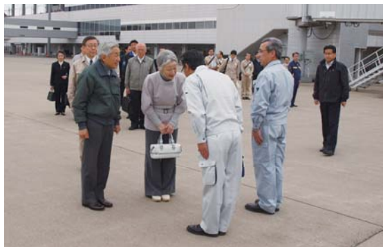
両陛下をお出迎えする石森村長(右)と須賀川市長