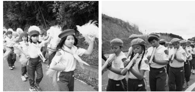
～須釜小交通安全鼓笛パレードより(5月13日)～