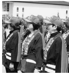
～玉川村消防団春季検閲式より～