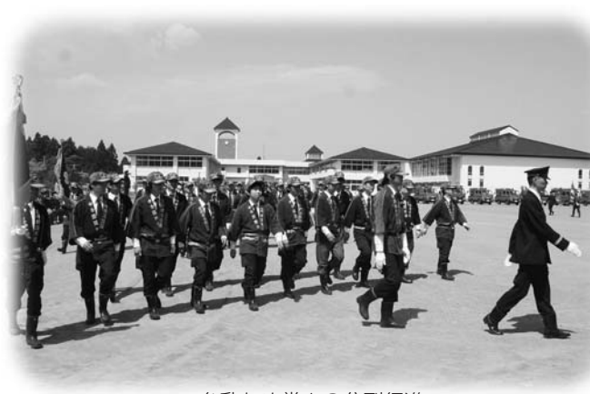
一糸乱れぬ堂々の分裂行進