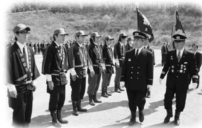
統監による通常点検