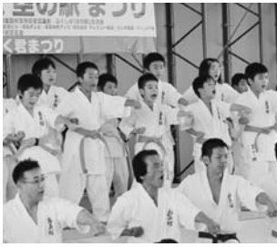
ふくしま復興道の駅・空の駅祭りより(11月12日)