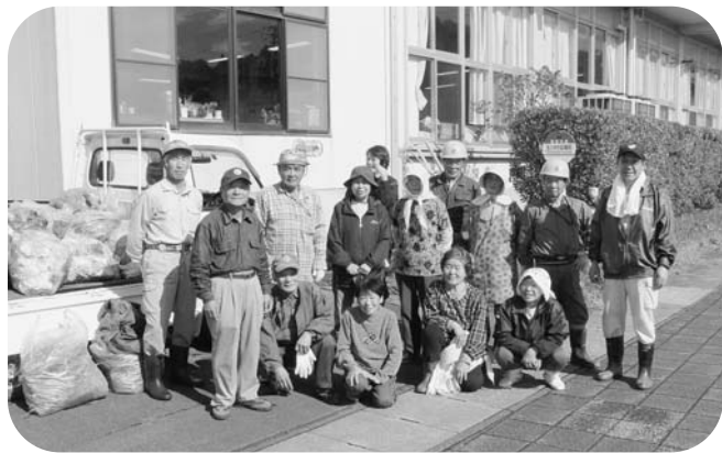
奉仕活動に参加された皆さん