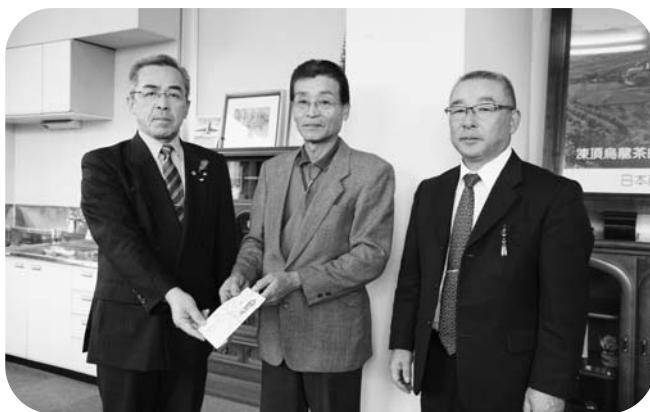
チャリティー募金を贈る我妻会長（中央）

毎年、同コンペの際、チャリティー募金が村社会福祉協議会に寄付され、社会福祉活動に役立てられています。