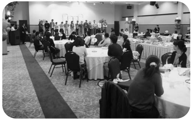
なごやかな雰囲気の中、交流を深めました

今回のイベントによって、7組のカップルが誕生しました。この事業は、12月25日(日)と2月19日(日)にも開催されます。