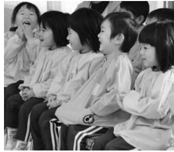
泉保育所人形劇鑑賞より（11月9日）