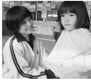
泉中学校職場体験学習(泉保育所にて)