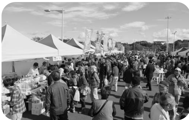
ご当地グルメや産品を求め、賑わう会場