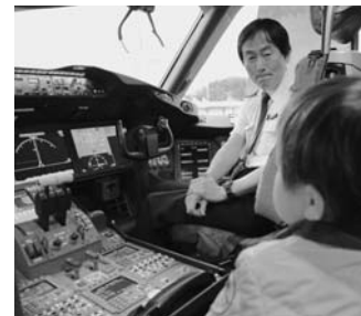
ボーイング787機内見学会より(11月13日)