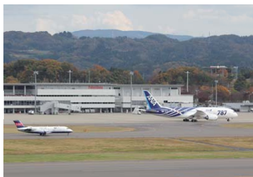
福島空港に飛来したボーイング787(右の機体)