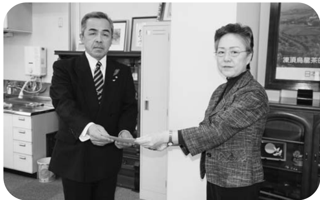
協定書を取り交わす熊谷郡山国道事務所長（右）