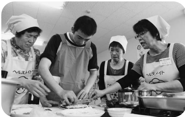
よつばの会員から料理のコツを教わる参加者