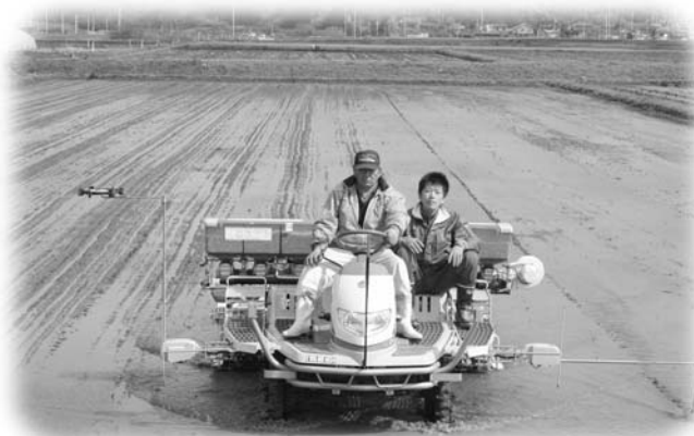
水稻直播田植機による田植え実演会