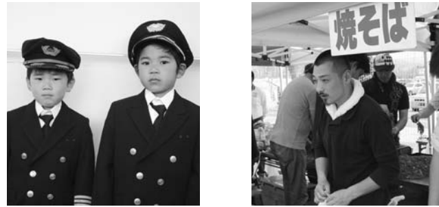
～福島空港YOU・YOURフェスティバルより～