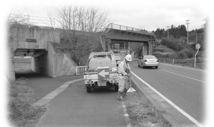
竜崎地内の国道沿いで散布作業を行う会員