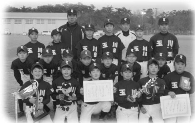
優勝した玉川村ソフトボールスポーツ少年団のメンバー

玉川ソフトスポ少優勝！ 激戦を制し見事2連覇なる 3月20日、いわき市のいわき新舞子ハイツで開かれた第6回いわき舞子浜杯児童ソフトボール大会において、前年度優勝チームとして出場した玉川村ソフトボールスポーツ少年団が、見事優勝し、昨年度に引き続き2連覇を達成しました。大会には、全42チームがエントリーし、3ブロックに分かれてのトーナメント方式により試合が行われました。試合内容も逆転の連続で、今後の活躍が期待できる大会となりました。