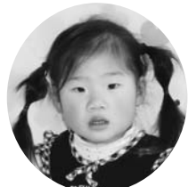
石森ころちゃん (美由紀：山小屋)