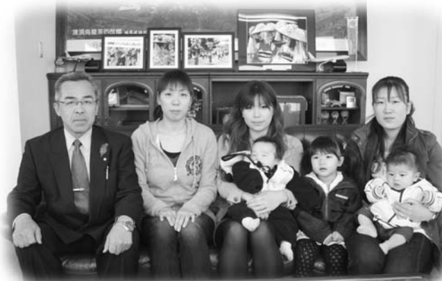
村長から祝い金を交付された3名の皆さん