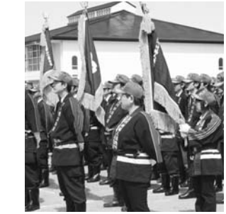
～玉川村消防団春季検閲式より～