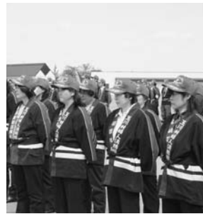
～玉川村消防団春季検閲式より～