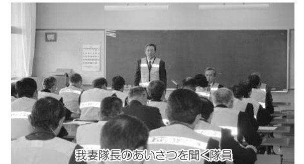
我妻隊長のあいさつを聞く隊員

全体会の中で、石川警察署員から玉川村内における事件や事故の状況について説明があり、隊員たちは真剣な表情で聞き入っていました。