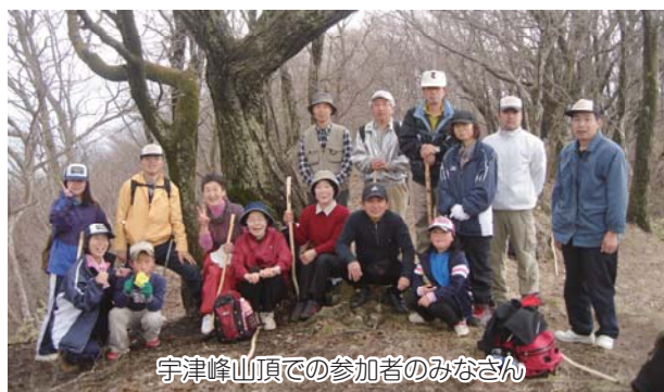
宇津峰山頂での参加者のみなさん