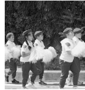
須釜小学校鼓笛パレード(5月14日)