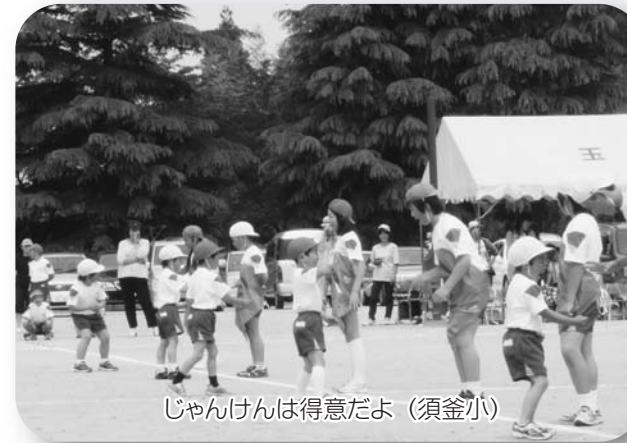
じゃんけんは得意だよ(須釜小)