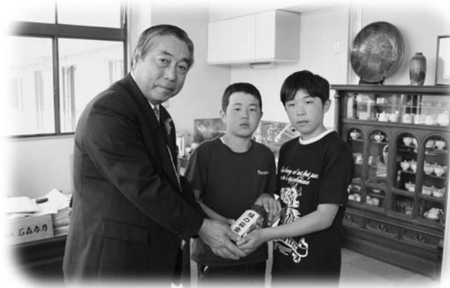
副村長に募金を手渡す須釜小児童