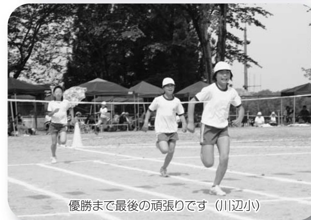
優勝まで最後の頑張りです(川辺小)