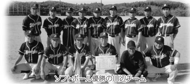
ソフトボール優勝の川辺チーム

行政区対抗による村民球技大会が6月6日、村民グラウンドや文化体育館などで行われました。 【男子ソフトボール】 ◆優勝：川 辺 ◆準優勝：岩法寺 ◆第3位：北須釜・中 【女子バレーボール】 ◆優勝：川 辺 ◆準優勝：竜 崎 ◆第3位：北須釜