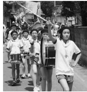
川辺小学校鼓笛パレード(5月18日)