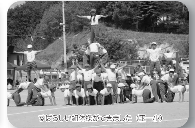
すばらしい組体操ができました(玉一小)