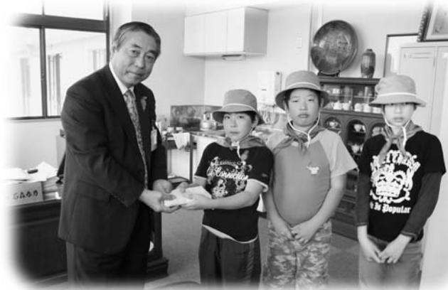
副村長に募金を渡す玉一小児童

募金は、県緑化推進委員会に集められてから、村内各学校の緑化活動に役立てられます。