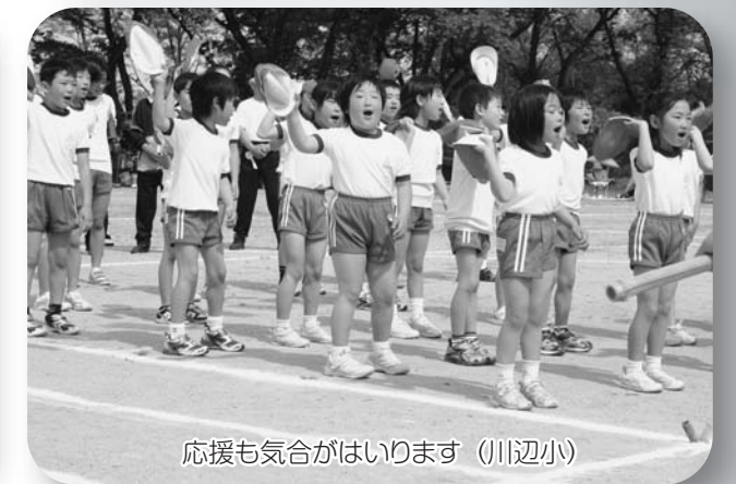
応援も気合がはいります(川辺小)