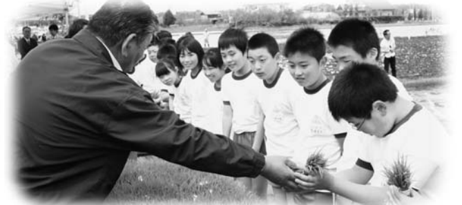
御田植に使用する苗を献穀者から受取る川辺小児童