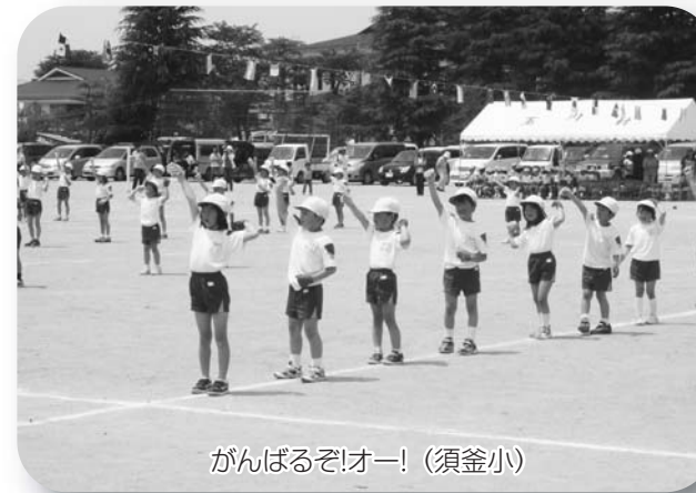
がんばるぞー!(須釜小)