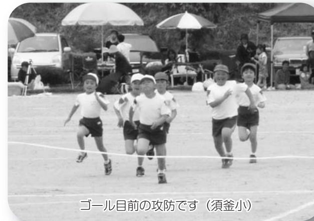
ゴール目の攻防です(須釜小)