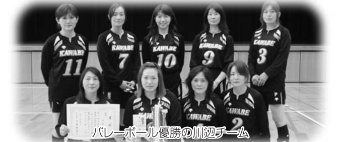
バレーボール優勝の川辺チーム