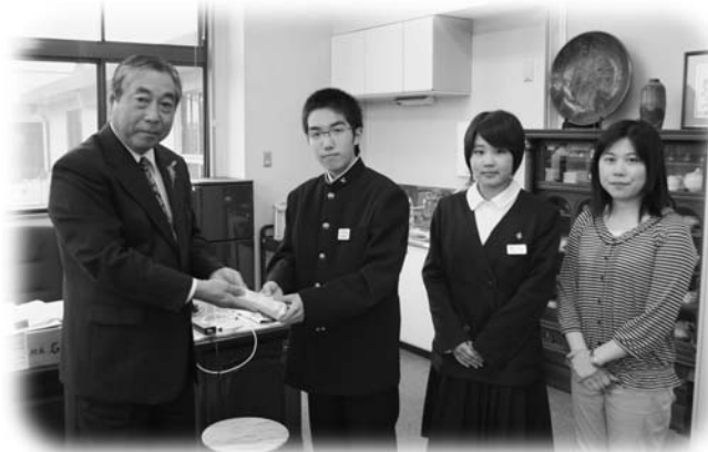
副村長に募金を手渡す須釜中生徒