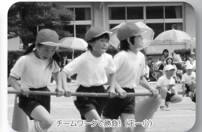
チームワークで勝負!(玉一小)