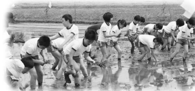
御田植の儀に参加した川辺小児童