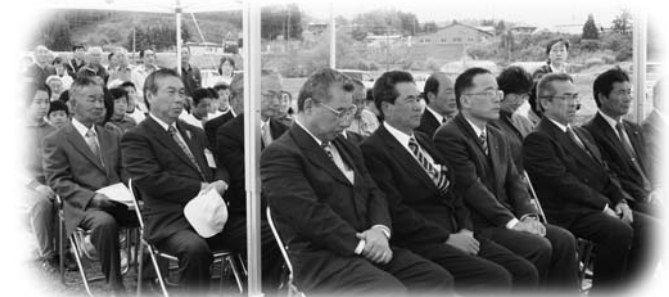
御田植祭に列席した関係者の皆さん