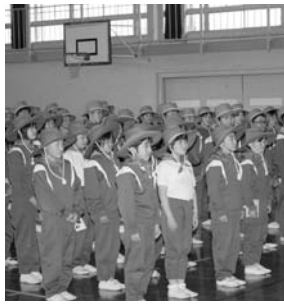
玉川第一小学校緑の少年団結団式(5月12日)