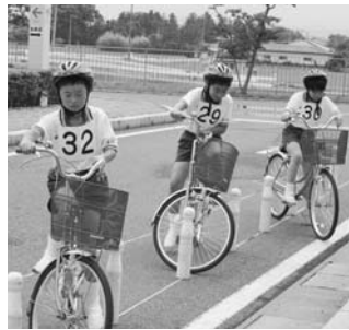
子供自転車大会より