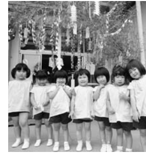
泉保育所七夕会より