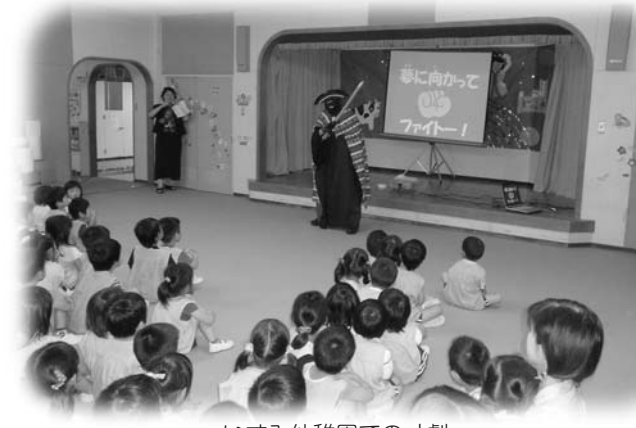
いずみ幼稚園での寸劇

玉川村食育推進委員会並びに学校保健部会の教職員が中心となり、幼・小・中連携事業「子どもの家庭生活や基本的な生活習慣の育成」のため、「生活リズムモンスター攻略ブック」を作成し、村内の各幼稚園や小学校・中学校へ配布しました。 また、冊子だけでは浸透しにくいことから、内容を脚本化し、各幼稚園・小学校で寸劇を通して子どもたちに生活習慣の大切さを伝えました。