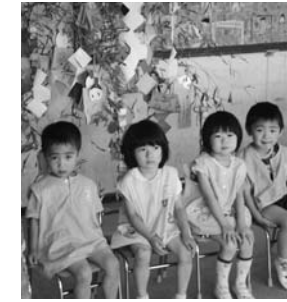
すがま幼稚園七夕会より