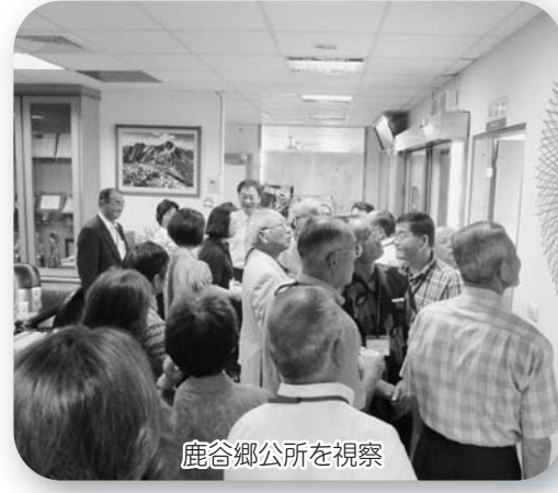
鹿谷郷公所を視察