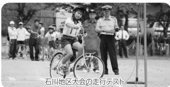
石川地区大会の走行テスト

7月3日に福島市の福島運転免許センターで、第44回交通安全子供自転車大会が行われ、県南代表の玉川第一小学校は5位入賞を果たし、すばらしい競技内容に大きな拍手が送られました。