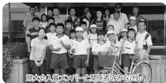
県大会入賞メンバーと関係者のみなさん