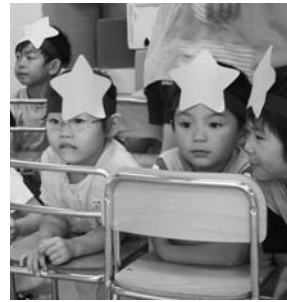
いずみ幼稚園七夕会より

福島空港の駐車場は、毎日午後8時30分から翌日午前6時30分まで封鎖しておりますが、毎年、夏場にカブトムシ捕りなどでの無断侵入ケースが増えています。空港駐車場の封鎖時間帯に侵入があった場合は、福島空港の安全管理上、やむをえず警察署に通報することになりますので、ご注意ください