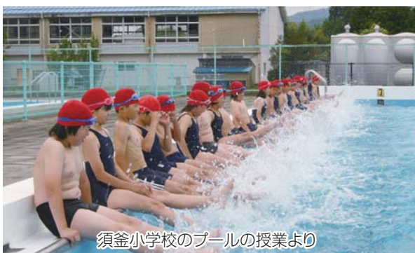
須釜小学校のプールの授業より