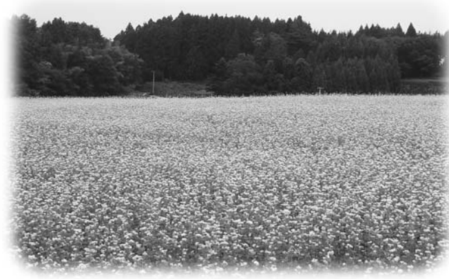
最盛期を迎えた夏ソバの開花（蒜生字細田地内）

耕作放棄地を有効活用 「夏ソバ」の作付けを実施 玉川村耕作放棄地対策協議会では、秋ソバの前作として4月から7月の間に作付け、収穫が可能である「夏ソバを実証ほ」として取り組んでいます。不作付け期間を無くし、農地の有効活用を図ることを目的としており、今年は5月6日に播種し、収穫は7月下旬の予定です。 耕作放棄地の解消を予定されている方又は興味のある方は役場企画産業課（☎57・4629）までお問い合わせください。