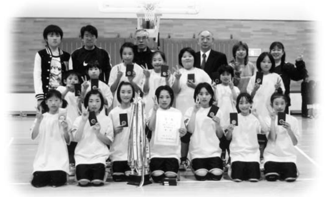
県大会へ出場する玉川ミニバスケットボールスポーツ少年団

ミニバスポ少県大会へ 激戦を勝ち抜き県大会出場 玉川ミニバスケットボールスポーツ少年団は、5月29、30日に行われた第13回石川ミニバスケットボール選手権大会で優勝し、さらに6月5、6、13日に行われた第63回福島県総合体育大会スポーツ少年団体育大会ミニバスケットボール競技県南地区予選会において、各地区の強豪28チームが出場し県大会出場を賭けて熱戦が繰り広げられましたが、その大会でも強豪チームがひしめく中、順当に勝ち抜いて、見事4位入賞を果たし、県大会出場権を勝ち取りました。