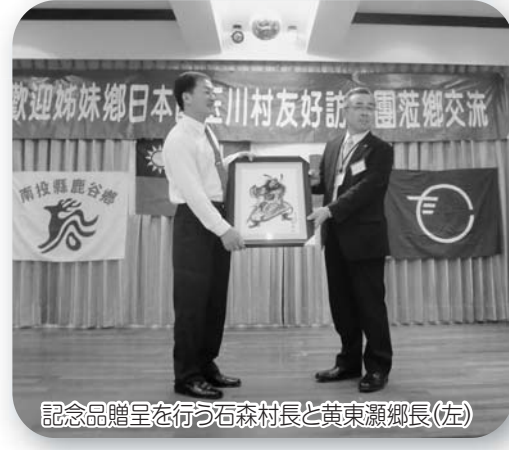
記念品贈呈を行う石森村長と黄東瀨郷長(左)