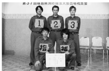
敢闘賞を受賞した選手の皆さん