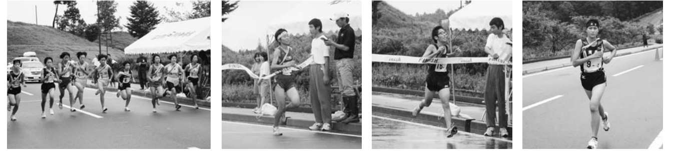
～中体連駅伝競走大会より～