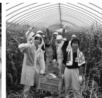
とうもろこしの収穫より

りました。そこには、玉川村では見られない程大きな農機があり驚きました。毎日の農作業により土で汚れていたのが、それを班のみんなでふくことになりました。きれいにふき終わると 「ありがとつ。とうもろこし塩ゆでしたから食べてね。」 と言われ自分たちが収穫したとうもろこしにかぶりつくと、みんな 「甘い」「おいしい」と言って笑顔で頂きました。 農家の方が愛情をこめて作物を育てていることを実感することができました。