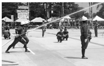
小型ポンプ操法競技の様子