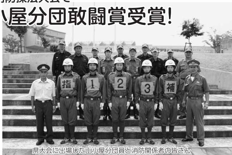
県大会に出場した山小屋分団員と消防関係者の皆さん

8月22日、福島市の福島県消防学校で行なわれた第37回福島県消防操法大会に石川支部代表として、山小屋分団が小型ポンプの部に出場しました。大会には、ポンプ車操法の部と小型ポンプの部に県内各地区からそれぞれ15チームが出場して白熱した競技が展開されました。 山小屋分団は、10番目に出場し、応援団の声援を受けて、練習の成果を十分発揮して競技を終了しました。 審査の結果、惜しくも入賞は逃しましたが、敢闘賞を受賞し、選手たちの堂々とした姿に会場から惜しみない拍手が送られ、山小屋分団の熱く長い夏は人々に感動を残して、幕を閉じました。