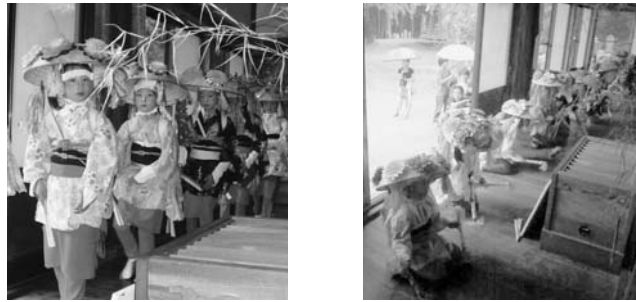
南須釜の念仏踊りより