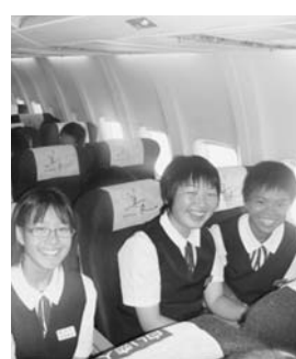
北海道へ向かう機内にて

ていた時間は、あっという間に過ぎました。飛行機内にいるのが分かるくらいに大きな圧力がかかりました。外の景色の都市がだんだん近付いたころ機内アナウンスが流れて、着陸体勢に入ったと放送されました。その日の北海道は曇っていて下りていくと同時に雲がどんどん多くなって行きました。着陸して滑走路から見た新千歳空港は福島空港の何倍もの大きさでもとても驚きました。自分達が乗っている飛行機よりも大きなものが周りにたくさんありました。空港はとても広くてビルがたくさんくっついたような作りになっていました。初めてのことだらけの飛行機体験は、今までに感じたことのない経験となりました。