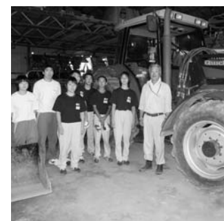
大きな農機と一緒に

研修旅行「二日目、広い北海道の大地を見ながらバスで移動し、私たちの班がお世話になる農家さんに到着しました。 あいにくの雨でしたが、温かくもかえて下さったおかげで、農業体験に対する不安がとんでいきました。準備を整えようもこの収穫を行うことになり、収穫の仕方を教えてもらうことになりました。 「とうもろこしの上の方を強く押しながら解っていくと段々になっていて、それはそこまでとうもろこしの身が入っているというところだから、気をつけながら穫ってね。」 と、言葉を実際にやってみると、本当に段々になっていて、おもしろいほど、とうもろこしを収穫することができました。 しかし、雨が強くなると作業を中断するしかなくなりました。農家の方に相談し、大きな倉庫を開けてもらったことにな