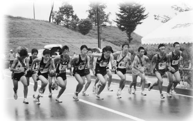
石川支部駅伝大会男子のスタートのようす

男子第46回、女子第23回となる中体連石川支部駅伝競走大会が9月8日、たまかわ文化体育館をスタート・ゴールとするコースで行われました。雨の中、男子は16チーム出場して6区間19.2km、女子は10チーム出場して5区間12.3kmでそれぞれ健脚が競われた結果、泉中が男子と女子でともに2位となり、10月6日に南相馬市で開催される県大会の出場権を獲得しました。また、須釜中の男子も地元の大声援の中、3位入賞を果たしました。