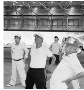
村長杯ゲートボール大会より