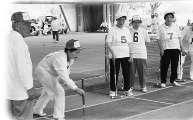
暑さに負けず元気よくプレーする選手