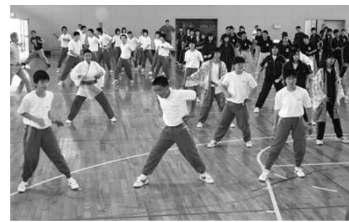
よさこい踊りのようす

が、とても楽しかったです。学校紹介では、中富良野中学校の特徴を知ることができました。須釜中の発表も真剣に聞いてもらえたのでよかったです。 一緒に昼食もとりました。はじめは何を話せばいいのか戸惑いました。でも、中富良野中学校の皆さんに話しかけられました。とてもうれしかったです。 また、他のグループもとてもにぎやかでした。 ここでのよさこいや交流会は忘れられない思い出となりました。本当に短い時間でしたが、その中でまた友情を深めたりすることができました。とても大きな意味があった交流会だったと思います。