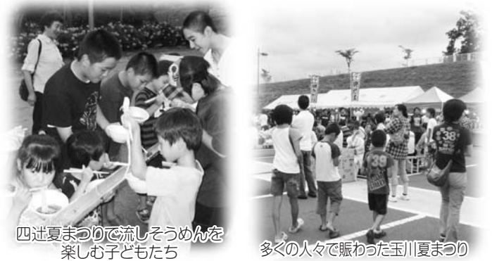
四辻夏まつりで流しそうめんを楽しむ子どもたち

玉川村の夏の風物詩、恒例の第22回玉川夏まつりが、8月13日にたまかわ文化体育館駐車場を会場に盛大に開催され、会場では、歌謡ショーや泉中と須釜中による合唱などの多彩なイベントや、夜の火花など多くの人々で賑わいました。 また、四辻新田地区でも8月14日に第4回四辻夏まつりが旧四辻分校で開催され、スイカ割りや流しそうめん、清流太鼓演奏が披露され、四辻の夏を満喫しました。