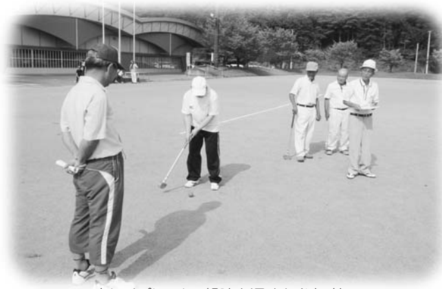
楽しくプレーし、親睦を深めた参加者

スポーツで親睦を深める 村役職員親善スポーツ大会 8月29日、第3回玉川村役職員親善スポーツ大会が村民グラウンドで開かれ、村内の役員らが一堂に会し、グラウンドゴルフで相互の親善と交流を図りました。参加は村議会議員・農業委員・教育・商工会役員・区長会・消防団・役場三役課長・体育指導委員の全8チームで行われました。 主な結果は次のとおりです。 優勝…教育チーム 準優勝…役場三役課長チーム 第3位…消防団幹部チーム