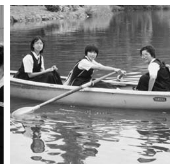
札幌市内自主研修より

音を聞くことができたこともとても良い思い出になりました。 最後に私は札幌の町を実際に歩いてみて、町並みが整然と区画整理されていて、とても歩きやすく感じました。北の大会札幌は私たちの村とは大きく異なる環境で魅力的な町でした。しかし玉川村に帰ってきたときは、ホッとしました。 私は今回の研修を通して毎日住んでいるあたり前だった玉川村の良さを再確認することができました。また友だちのよさにも気付くことができ、本当に忘れられない旅になりました。