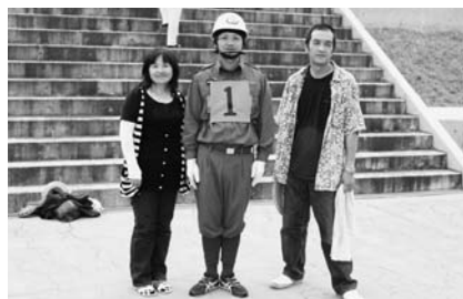
家族の応援が力になりました