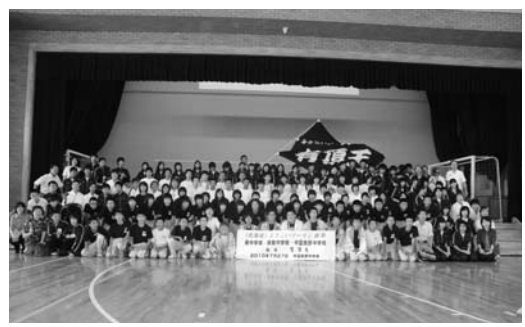
中富良野中学校にて

最初は、とても難しそうでしたが、「果たして自分にできるだろうか。」と心配になりました。でも、丁寧に教えていただいたおかげで最終的に全員が踊れるようになっていました。最後にステージの上でも踊りました