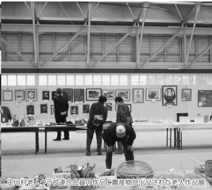
玉川村老人クラブ連合会員の作品と農産物が出品された老人作品展