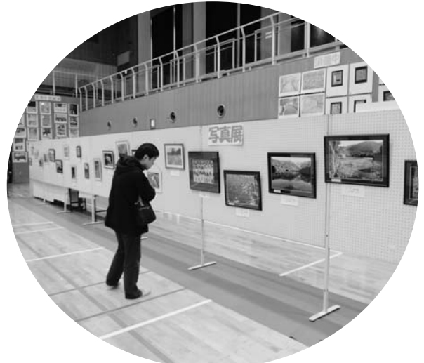
写真愛好者による写真展