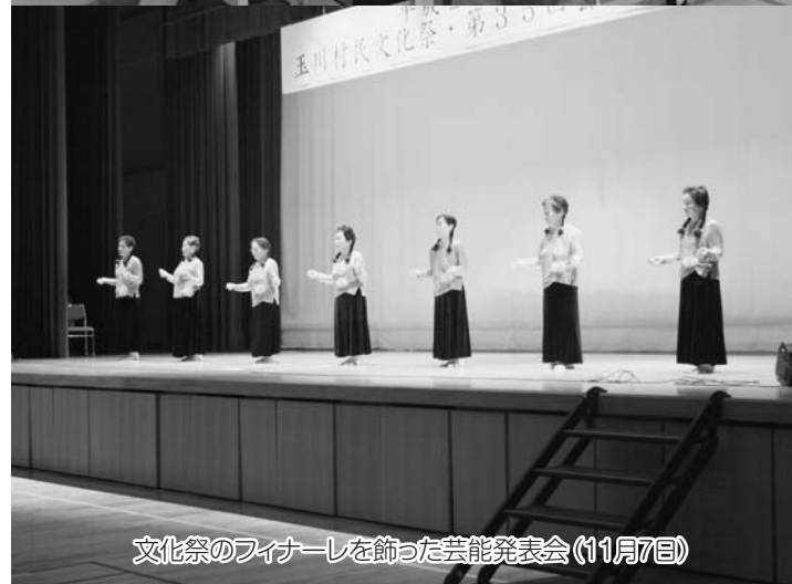
文化祭のフィナーレを飾った芸能発表会(11月7日)