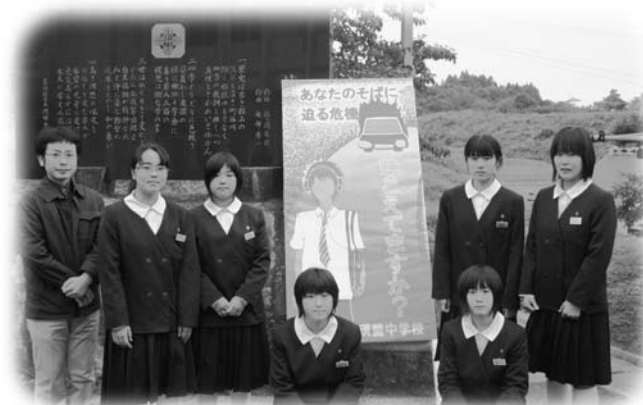
最優秀賞に選ばれた立看板と製作した須釜中の皆さん

子どもの成長を支援します 新生児誕生祝い金支給式 平成22年度上半期分の新生児誕生祝い金の支給式が10月13日、玉川村役場で行われ、10名の該当者に村長から祝い金が支給されました。 村では、第3子以降のお子さん誕生から出生を祝福し、出生児の健全な成長を願い祝い金を支給しています。 祝い金は第3子に10万円、第4子からは20万円が支給されます。 今回の該当者は、第3子が8人、第4子が2人でした。