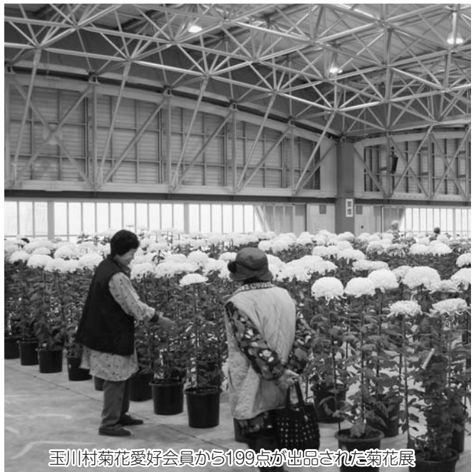
玉川村菊花愛好会から199点が出品された菊花展