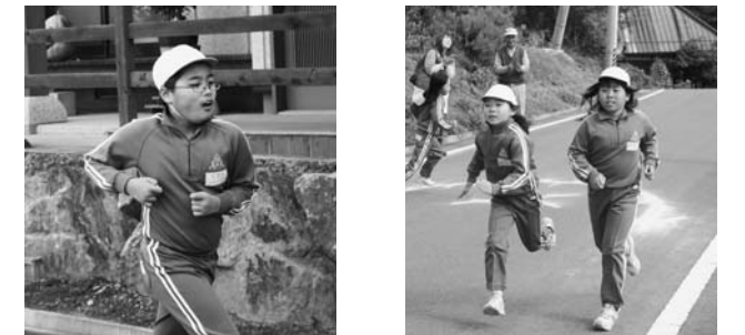
～川辺小学校マラソン大会より～