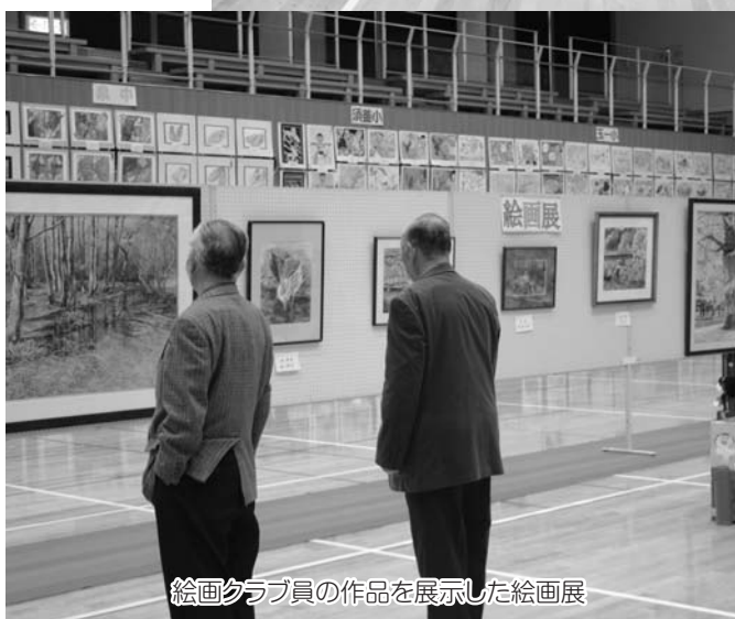
絵画クラブ員の作品を展示した絵画展