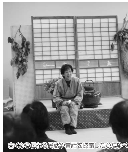
古くから伝わる民話や昔話を披露したかたろべ