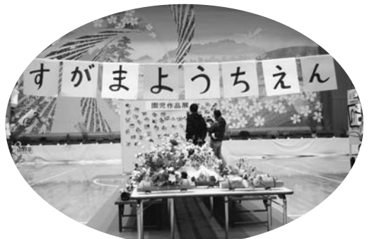
保育所・各幼稚園児の作品を展示した園児作品展