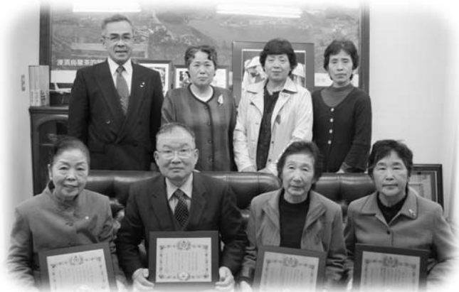
有功章を受賞した玉川村赤十字奉仕団の皆さん