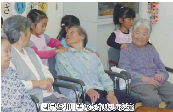
園児と利用者のふれあい交流