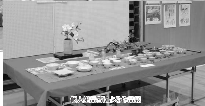
個人出品者による作品展