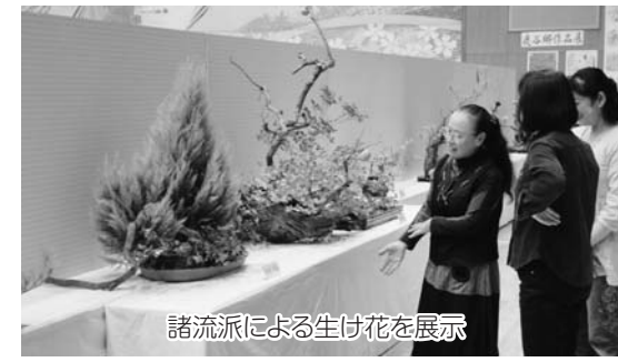
諸流派による生け花を展示