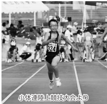
小体連陸上競技大会より