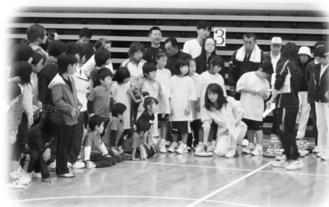
カローリングを楽しむ参加者

この催しは、スポーツを通して村民の交流を深めることを目的に開催しており、当日はティーボール、グラウンドゴルフ、カローリング、ワンバウンドふらばーの4種目の競技に村民約350人が参加し、一日を通して気持ちの良い汗を流しました。