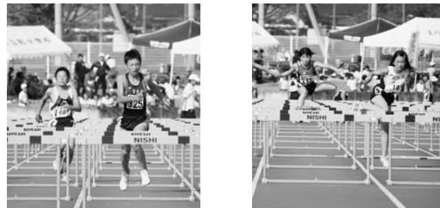
小体連陸上競技大会より