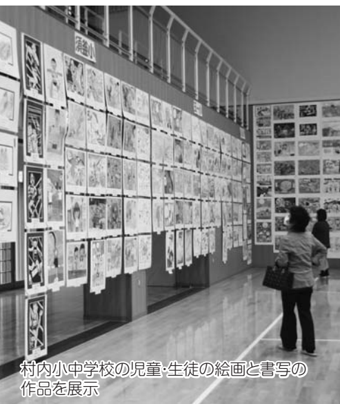
村内小中学校の児童・生徒の絵画と書写の作品を展示

村の文化、芸術の祭典「平成22年度玉川村民文化祭」は、10月23日の山野草展で開幕し、11月7日の芸能発表会まで、たまかわ文化体育館をメイン会場に開催されました。