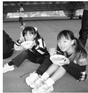
～たまかわスポーツフェスタより～