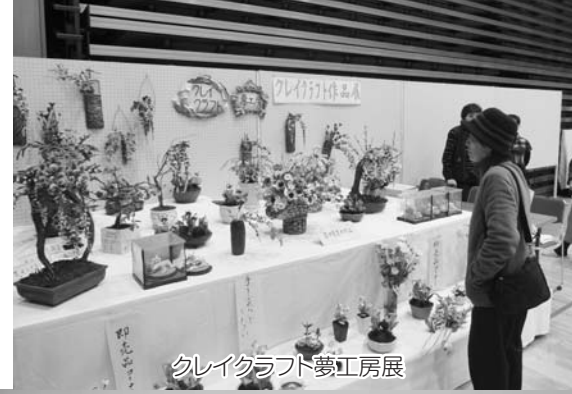
クレイクラブ夢工房展