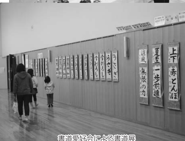
書道愛好会による書道展