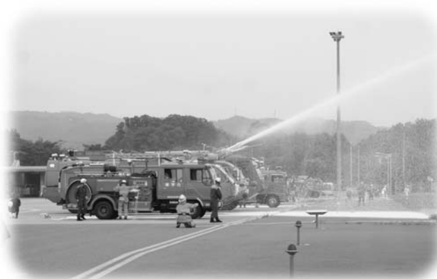
空港消防車による一斉放水のようす

安全で安心な空港のために 福島空港消防救難総合訓練 平成22年度福島空港消防救難総合訓練が10月20日、福島空港で行なわれました。 この訓練は、福島空港で航空機事故が発生した場合に備え、消火・救難等の一連の応急対策を迅速かつ確実にできるよう毎年実施しています。 今年度は、消防や警察、空港関係者ら36機関約200名が参加し、消防車やパトカー、防災ヘリコプターなどによる実践さながらの消防救難訓練が行われ、玉川村からは川辺分団と小高分団が参加しました。