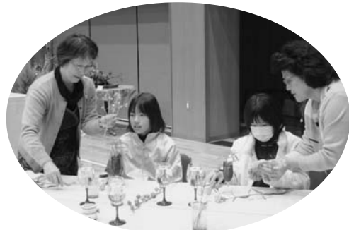
大盛況だった生花体験コーナー