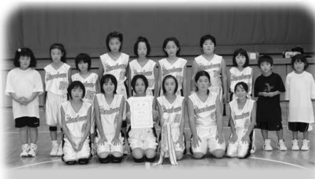
頂点に輝いた玉川ミニバスケットボールスポーツ少年団

ミニバススポ少見事頂点へ 玉川村体育協会長杯大会 石川バスケットボールフェスティバル2010玉川村体育協会長杯ミニバスケットボール大会が、10月2、3日の2日間にわたり、たまか文化体育館などで開催され、昨年の同大会で3位の玉川ミニバスケットスポーツ少年団は、雪辱を果たし見事優勝しました。 この大会には、石川地区の各町村より全10チームが参加しましたが、玉川ミニバスケットボールスポーツ少年団は、予選リーグから決勝戦まで、すべての試合をダブルスコア以上の大差をつけて、圧勝でした。