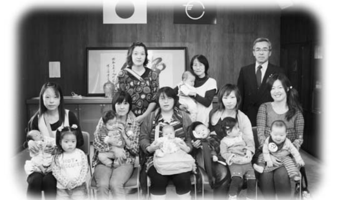
誕生祝い金を贈られた皆さん

子どもの成長を支援します 新生児誕生祝い金支給式 平成22年度上半期分の新生児誕生祝い金の支給式が10月13日、玉川村役場で行われ、10名の該当者に村長から祝い金が支給されました。 村では、第3子以降のお子さん誕生から出生を祝福し、出生児の健全な成長を願い祝い金を支給しています。 祝い金は第3子に10万円、第4子からは20万円が支給されます。 今回の該当者は、第3子が8人、第4子が2人でした。