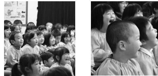
～すがま幼稚園人形劇鑑賞より～