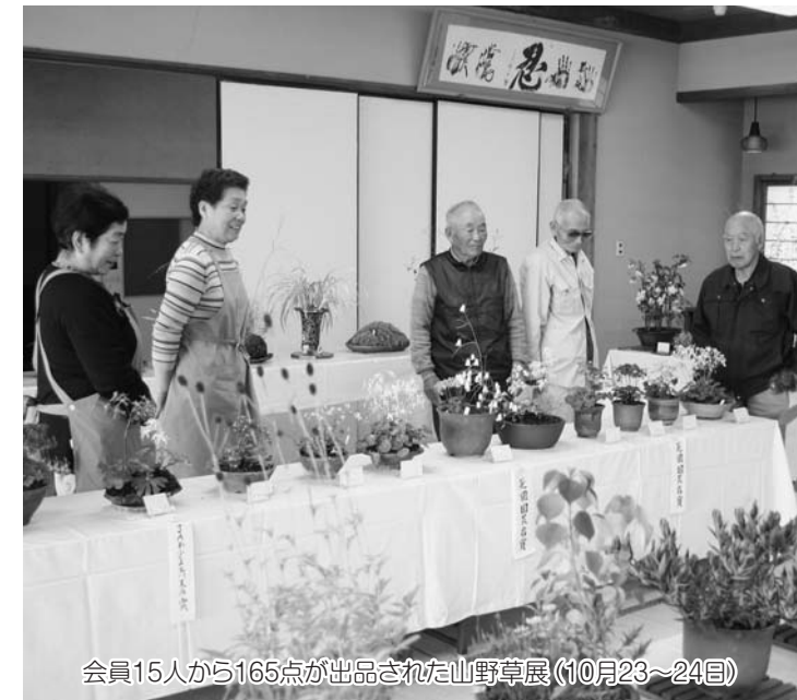
会員15人から165点が出品された山野草展(10月23~24日)