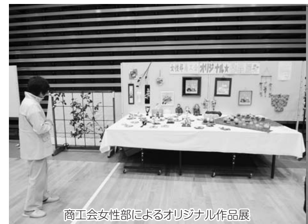
商工会女性部によるオリジナル作品展