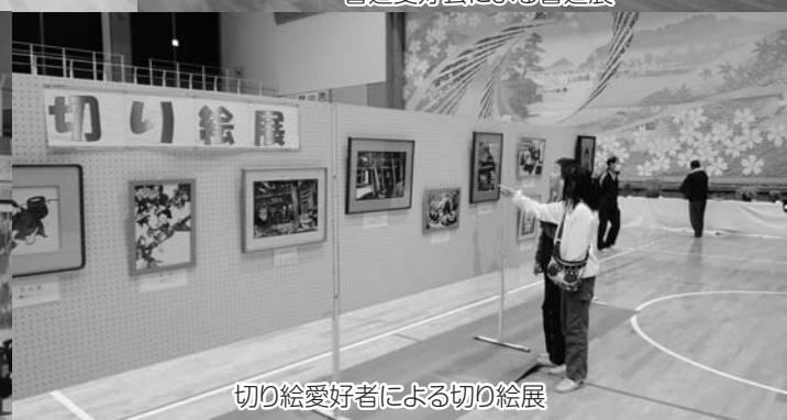
切り絵愛好者による切り絵展