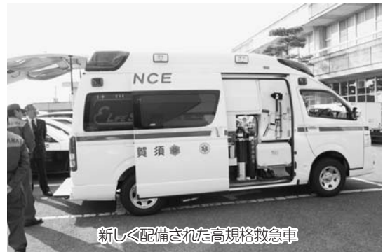
新しく配備された高規格救急車

須賀川消防署玉川派出所に10月14日、新しく高規格救急車が配備されました。この高規格救急車は、従来の救急車と違い、車内で高度な救命処置が可能となるよう考慮された救急車で、乗車する救急救命士が、応急処置よりも高度な救命処置を行えるようになりました。