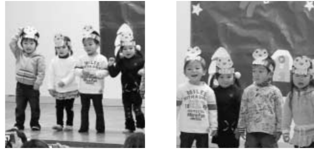
泉保育所おゆうぎ会(12月13日)より

福島県文化振興基金 助成事業の申請受付 対象事業 県内に住所または活動の本拠を有する個人・団体の行う文化活動 対象期間 平成21年4月1日から7月31日までの事業 申込方法 所定の申請書に記入の上村教育委員会まで 申込期限 平成21年2月10日まで 問合せ先 玉川村教育委員会 57-4633