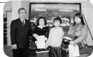
玉川第一小学校の皆さん(12月22日)

福島県文化振興基金 助成事業の申請受付 対象事業 県内に住所または活動の本拠を有する個人・団体の行う文化活動 対象期間 平成21年4月1日から7月31日までの事業 申込方法 所定の申請書に記入の上村教育委員会まで 申込期限 平成21年2月10日まで 問合せ先 玉川村教育委員会 57-4633