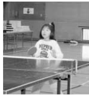
～村民卓球大会(12月14日)より～