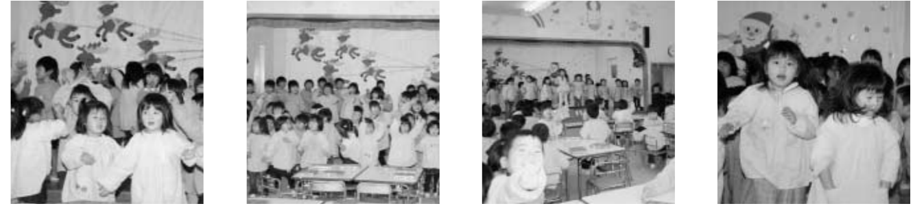
~「すがま幼稚園お楽しみ会」より~