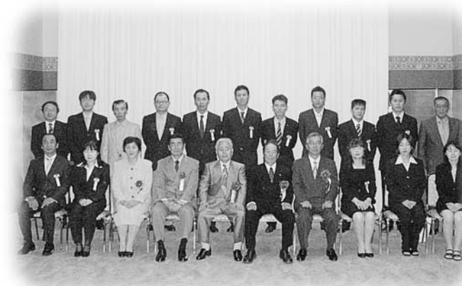
村商工会長より優良従業員の表彰を受けた皆さん