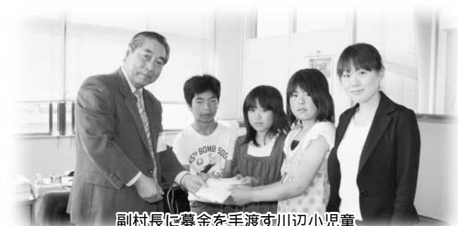
副村長に募金を手渡す川辺小児童