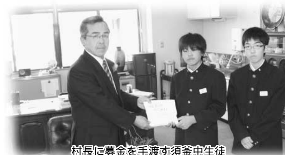
村長に募金を手渡す須釜中生徒

募金は、県緑化推進委員会に集められてから村をとおり、一部村内各学校の緑化活動に役立てられます。