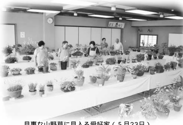
見事な山野草に見入る愛好家（5月23日）