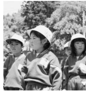
須釜小学校鼓笛隊パレードより(5月15日)