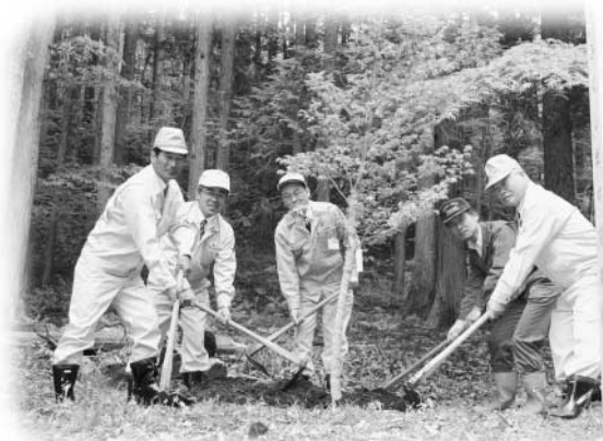
イロハモミジの苗木を記念に植樹する代表者