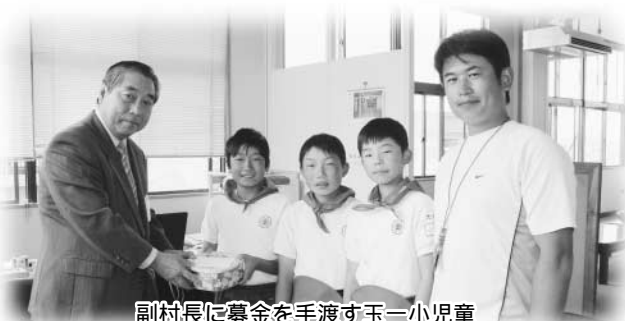
副村長に募金を手渡す玉一小児童