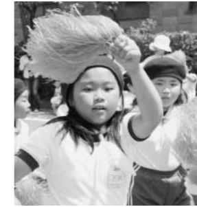
川辺小学校鼓笛隊パレード(5月19日)