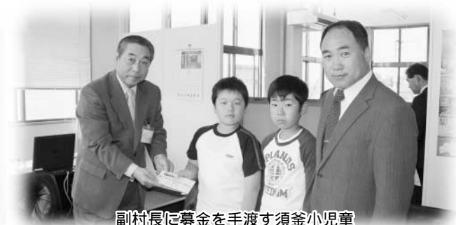
副村長に募金を手渡す須釜小児童