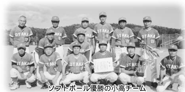
ソフトボール優勝の小高チーム

【男子ソフトボール】 優勝：小 高 準優勝：竜 崎 第3位：岩法寺・川 辺 【女子バレーボール】 優勝：竜 崎 準優勝：南須釜 第3位：川 辺