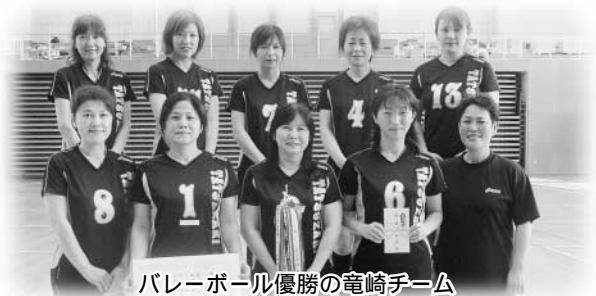
バレーボール優勝の竜崎チーム