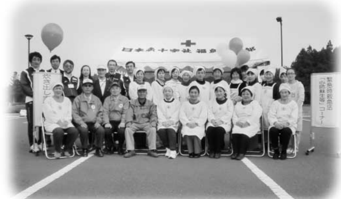
総勢34名を数える玉川村赤十字奉仕団メンバー

訓練は、通常の基礎訓練のほか村民体育館内での普通救命講習会(AED含む)と各分団対抗による放水タイム競技も実施され、小高分団(ポンプ車の部)と北須釜分団(可搬ポンプの部)が、それぞれ優勝しました。