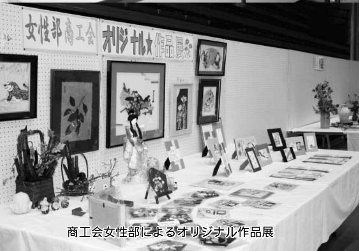
商工会女性部によるオリジナル作品展