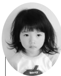
ありが ひめのちゃん 有賀ひめのちゃん 【昇：吉】