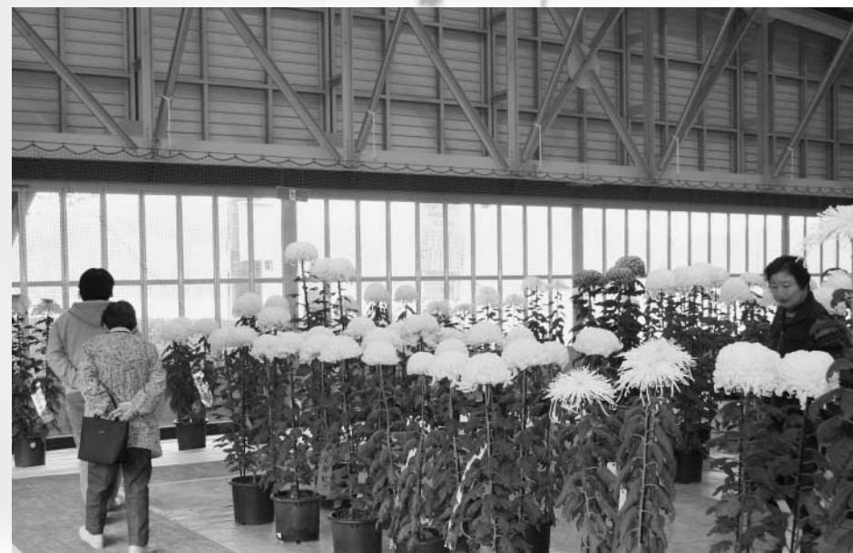
玉川村菊花愛好会会員26人から248点が出品された菊花展