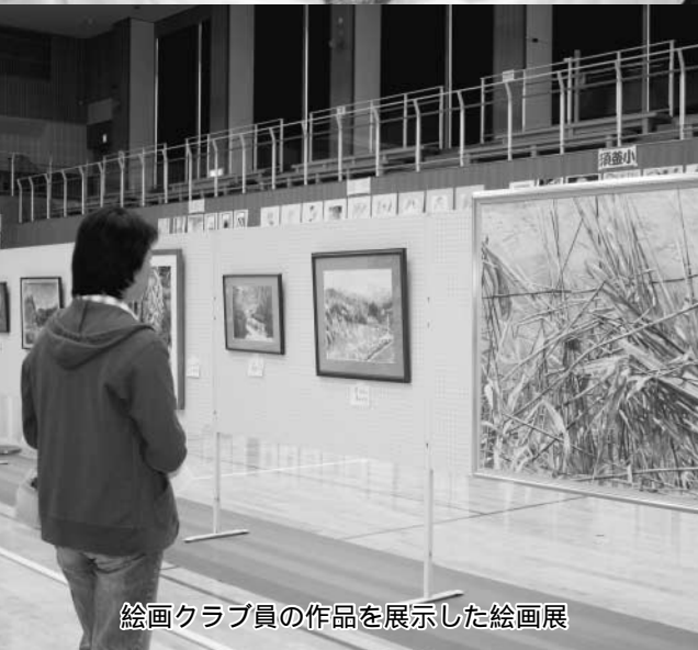
絵画クラブ員の作品を展示した絵画展

平成21年度 玉川村民文化祭 “芸術の秋”今年も村民の創作文化の集大成『玉川村民文化祭』が、10月31日から11月8日にかけ、たまかわ文化体育館を主会場に開催されました。