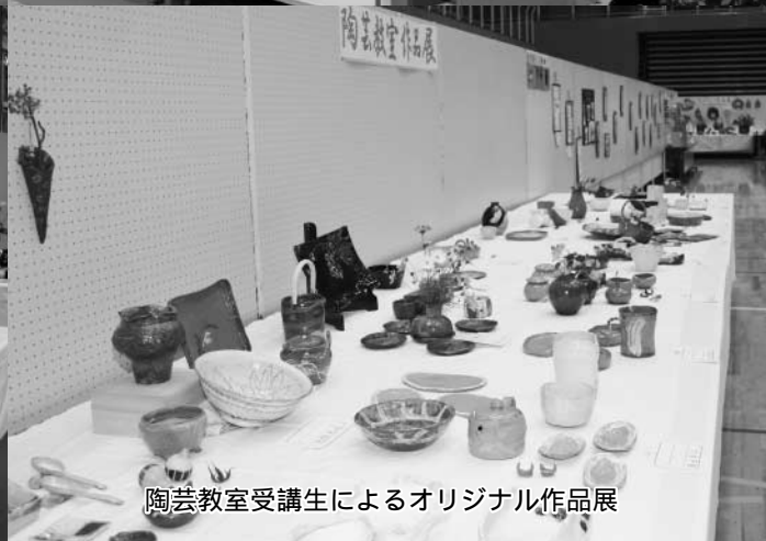
陶芸教室受講生によるオリジナル作品展