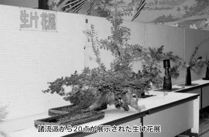
諸流派から20点が展示された生け花展