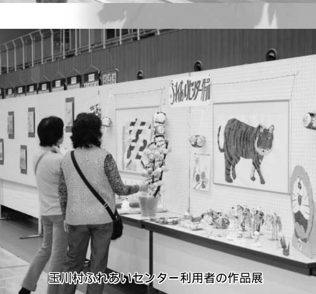
玉川村ふれあいセンター利用者の作品展