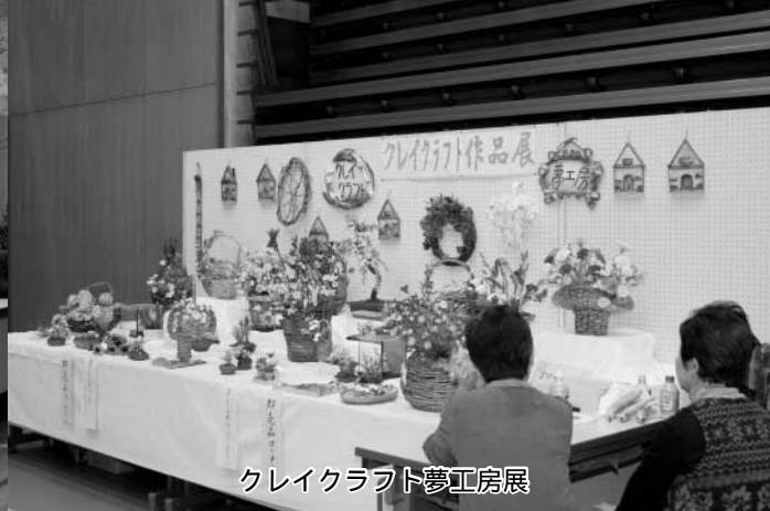
クレイクラフト夢工房展