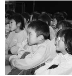
~すがま幼稚園、人形劇鑑賞(10月27日)より~