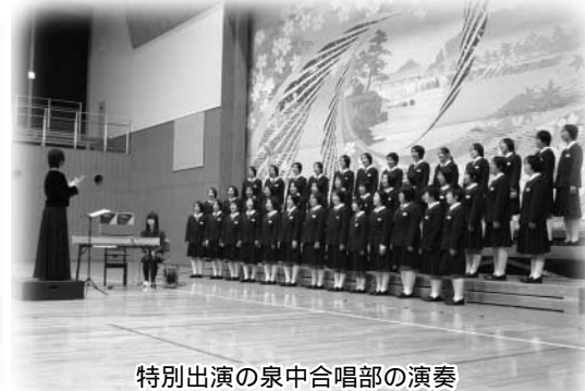
特別出演の泉中合唱部の演奏

村民文化祭のフィナーレを飾る芸能発表会が11月8日、たまかわ文化体育館で開かれ、開演に先立ち全日本合唱コンクールに出場した泉中学校合唱部の演奏が披露されました。