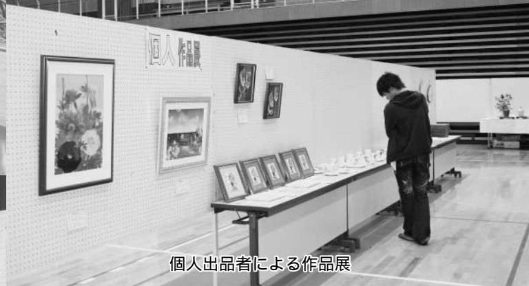
個人出品者による作品展