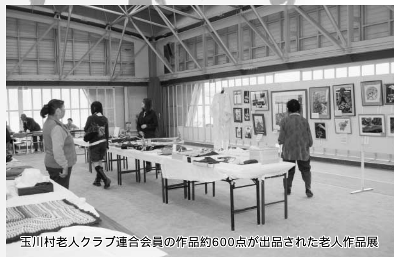
玉川村老人クラブ連合会員の作品約600点が出品された老人作品展

平成21年度 玉川村民文化祭 “芸術の秋”今年も村民の創作文化の集大成『玉川村民文化祭』が、10月31日から11月8日にかけ、たまかわ文化体育館を主会場に開催されました。