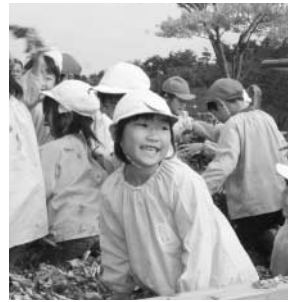
「落ち葉プール開き」より