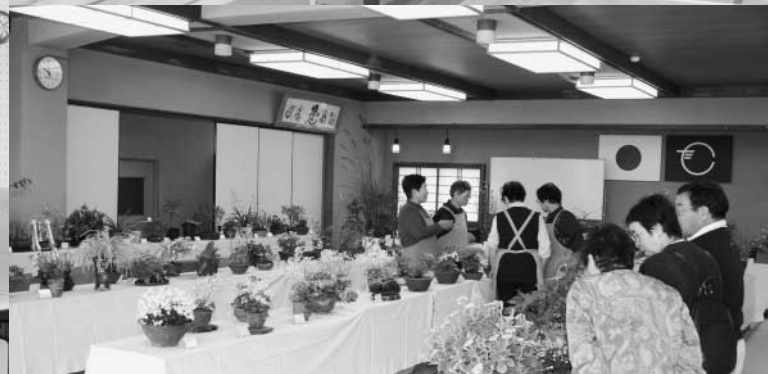
会員15人から165点が出品された山野草展(10月24~25日)