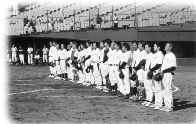
初戦突破を果たした玉川村チーム(10月10日)

9月26日から福島市のあづま球場などで行われた第3回市町村対抗福島県軟式野球大会で、玉川村チームが1対0のサヨナラ勝ちで棚倉町チームを破り、念願の1勝を達成。2回戦に進みました。