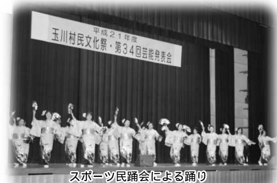
スポーツ民謡会による踊り