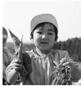
～泉保育所「いも掘り体験」より～