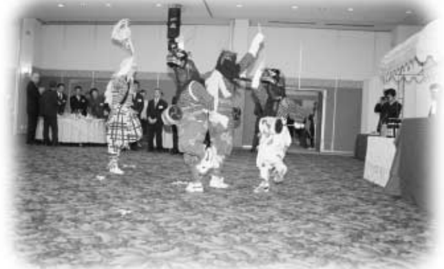
会場を華やかな雰囲気包んだ『獅子舞』