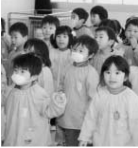
すがま幼稚園の豆まき会(2月1日)より