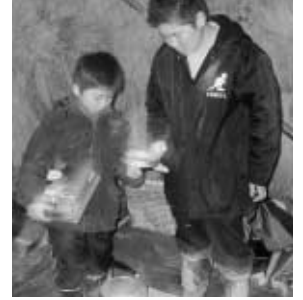
南須釜の「やっちゃ小屋」