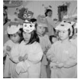
いずみ幼稚園の豆まき会より