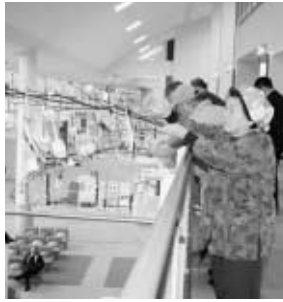
『団子さし飾り』より