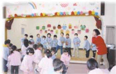
すがま幼稚園 (2月1日)