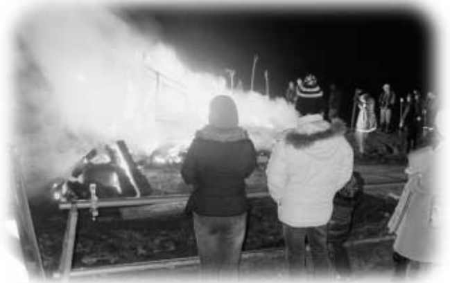
赤々と燃え上がる南須釜の『やっちゃ小屋』

夕方からワラで作った小屋の中で、子どもたちが餅を焼いたりして楽しんだ後、午後7時過ぎ、地元の人が持ち寄った正月飾りやしめ縄といっしょに小屋に火がつけられると、赤い炎が夜空を焦がしていました。