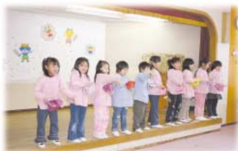
いすみ幼稚園 (2月1日)