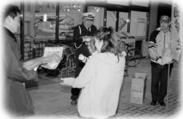
買い物客にチラシを配る参加者