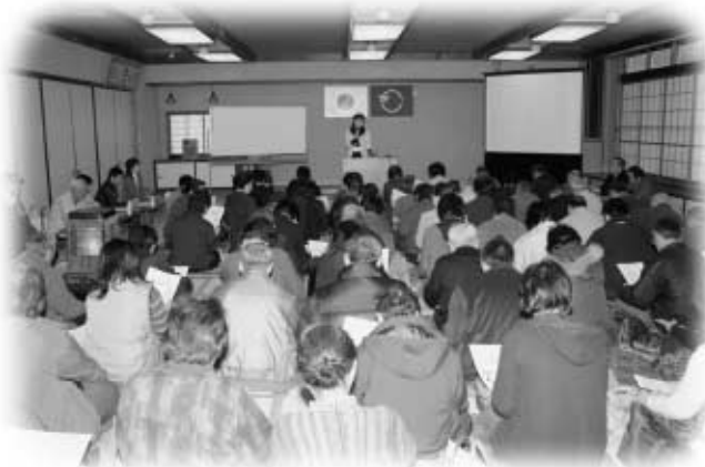
保健師による講義を受ける大勢の参加者

農薬対策や食品衛生など学ぶ こぶしの里出荷者講習会 株式会社こぶしの里主催による、「こぶしの里センター」の出荷者講習会が2月21日、村就業改善センターで開かれ、出荷者ら約100人が出席しました。 講義は、農薬の飛散防止や村内の野菜生産状況と展望、新種野菜の情報や食品知識など野菜生産にかかわることから、メタボリック対策といった食生活関係まで幅広い内容で行われ、参加者らは、生産・出荷に役立つようと、熱心に講師の話に聞入っていました。