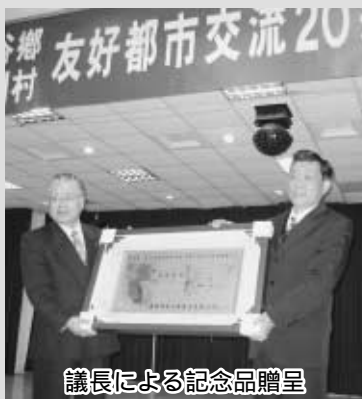
議長による記念品贈呈