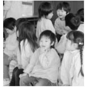
泉保育所『ひなまつり会』(3月3日)より