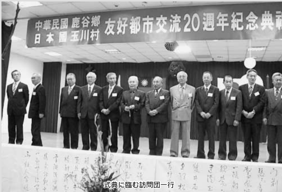
式典に臨む訪問団一行