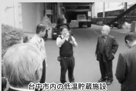
台中市内の低温貯蔵施設