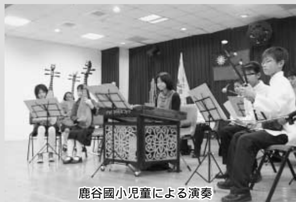
鹿谷國小児童による演奏