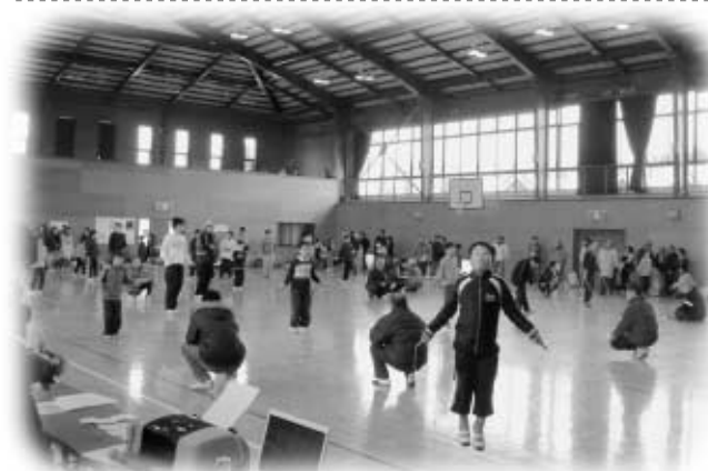
“地域の輪”を広げる縄跳び大会