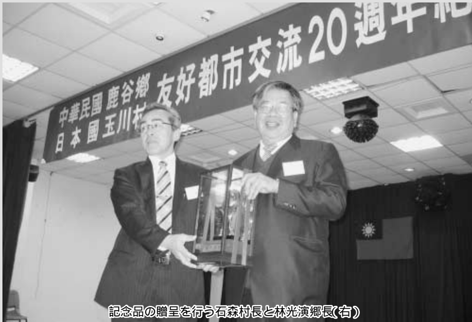
記念品の贈呈を行う石森村長と林光演郷長(右)