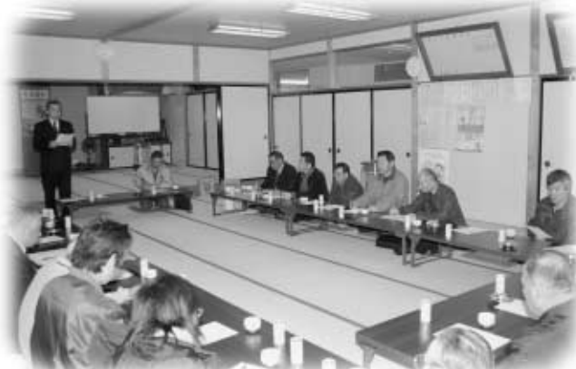
区内での中体連駅伝コースは歓迎であるなどの意見が出た懇談会

阿武隈高原自動車道のインターチェンジがあり、区と東北道が直結され利便性が高まったこと、新しく改築された吉鹿島神社が誇りであるなどの声や、村に対する要望など、活発に意見が交わされました。