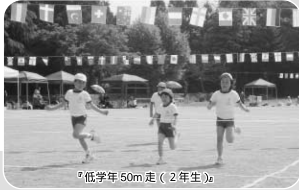
『低学年 50m 走 (2年生)』