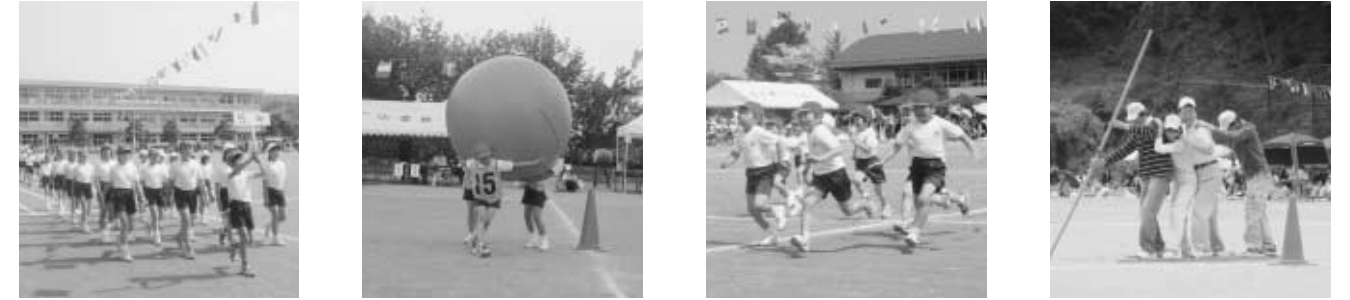
玉川第一小学校運動会