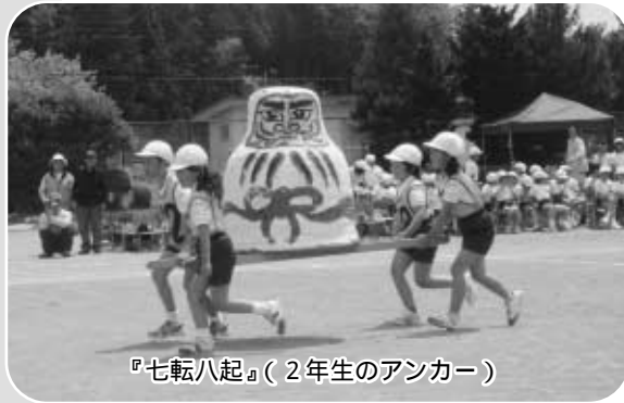
『七転八起』(2年生のアンカー)