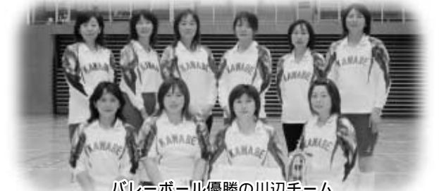
バレーボール優勝の川辺チーム