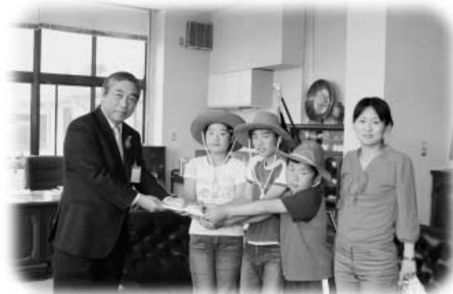
草野副村長に募金を手渡す玉一小のみなさん