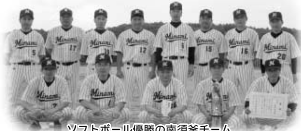
ソフトボール優勝の南須釜チーム