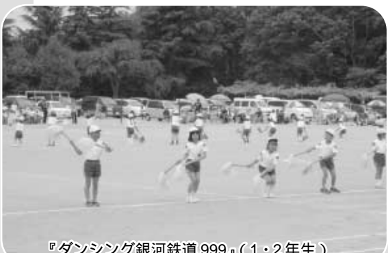
『ダンシング銀河鉄道 999』(1・2年生)