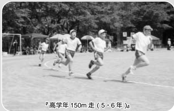
『高学年 150m 走 (5・6年)』