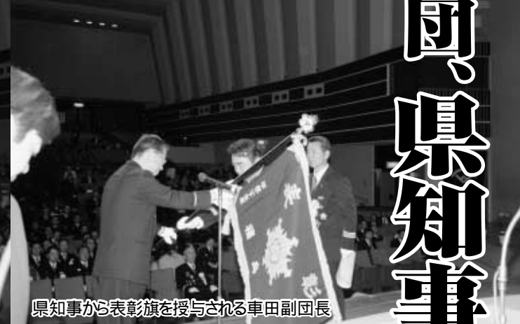
県知事から表彰旗を授与される車田副団長