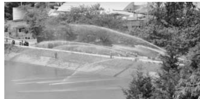
毎年、春季検閲の際行われる放水訓練