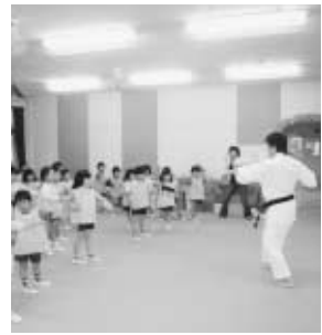
いずみ幼稚園朝の会(6月3日)にて