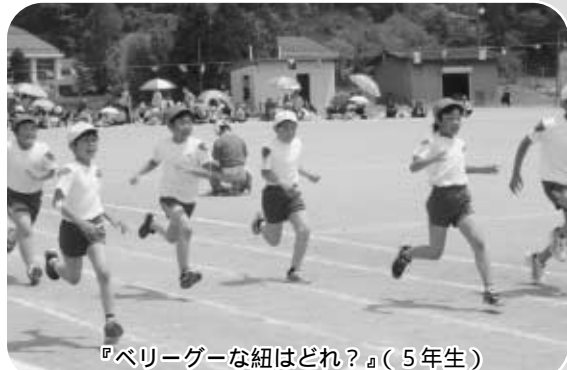
『ペリーゲーな紐はどれ?』(5年生)