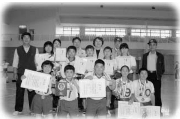
入賞を飾った玉一小チームの皆さん