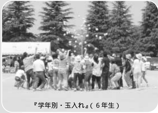
『学年別・玉入れ』(6年生)