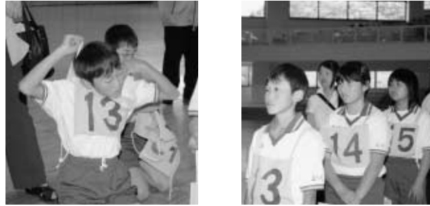
石川地区交通安全子供自転車大会より