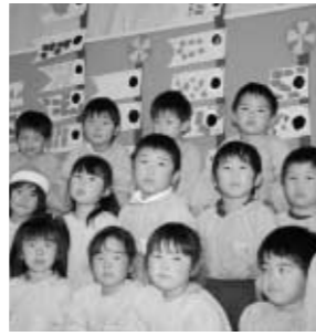
( ~ す が ま 幼 稚 園 ~ )