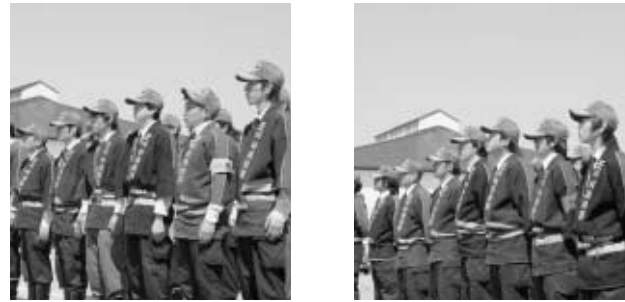
消防団春季検閲より