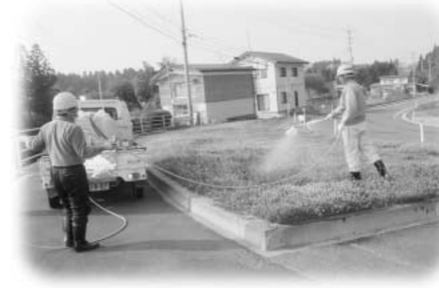
南須釜の館坂地内での作業のようす