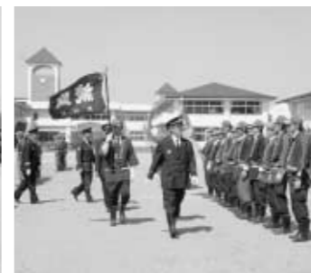
統監の観閲を受ける団員