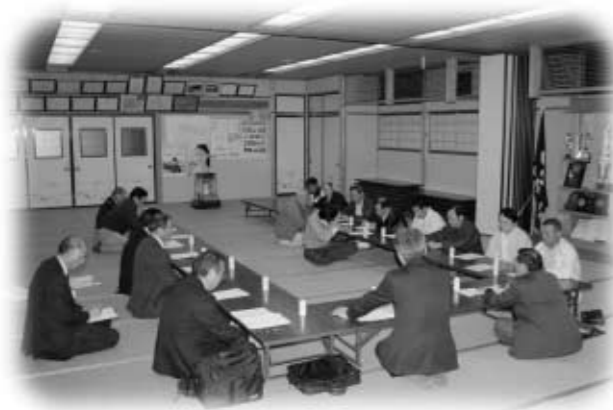
民俗芸能を復活してほしいなどの意見が出た懇談会