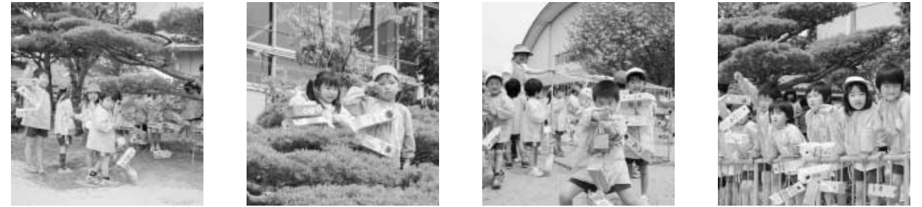
( ~ い ず み 幼 稚 園 ~ )