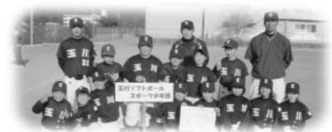
Bチームのメンバー