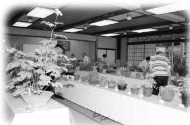
夏の鉢植えに見入る愛好家（6月21日）