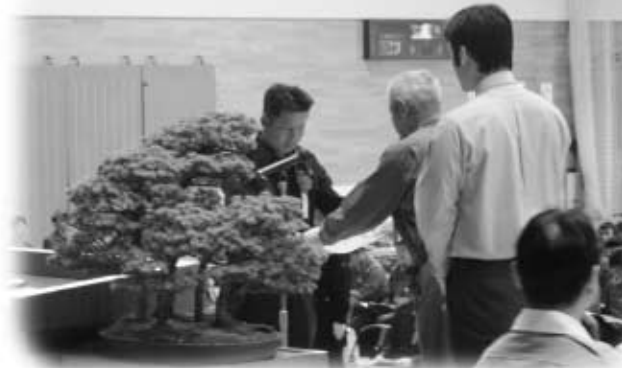
代表で本村分の優良団員表彰を受ける真弓さん（左）