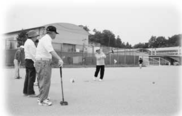
練習の成果を発揮し元気にプレーする出場者