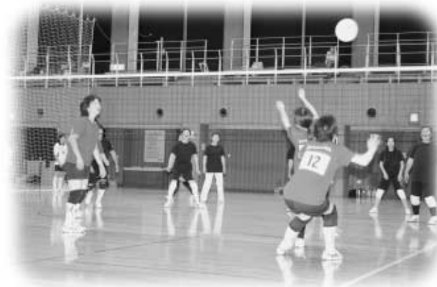
熱戦を展開する玉川村商工会女性部の皆さん

石川郡内各商工会5チームにより、9月の県中地区大会出場をめざし熱戦が繰り広げられた結果、古殿町商工会が優勝、浅川町商工会が準優勝となり、それぞれ県中地区大会出場がまきまりました。