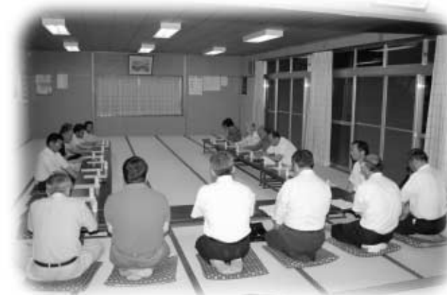
毎月第1日曜の朝集会所の清掃を行っているなどの意見出た懇談会