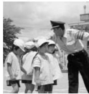
泉保育所交通安全教室(6月24日)

上限額：1団体10万円 団体の人数：5名以上からなる団体 期間：7月1日から来年1月末までの利用 問合せ先：福島県空港交流課 ☎024-521-7127