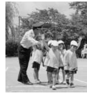
泉保育所交通安全教室(6月24日)