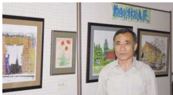
左端が入選作の『おつかれさま』