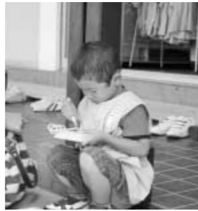
～すがま幼稚園親子工作より～