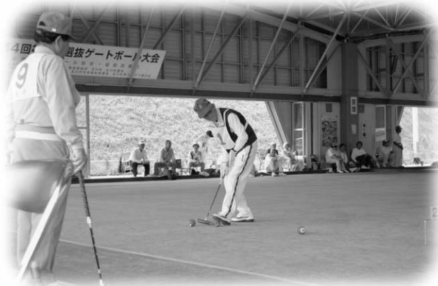
ハツラツと競技する老人クラブ員の方々