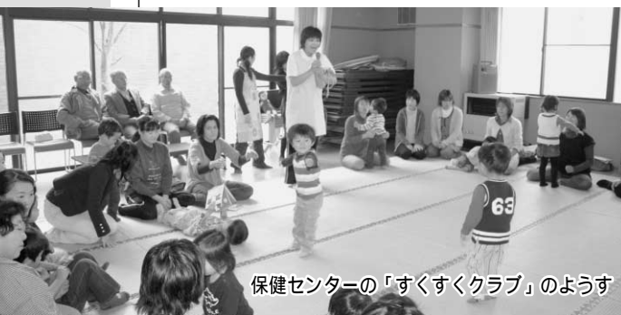
保健センターの「すくすくクラブ」の様子