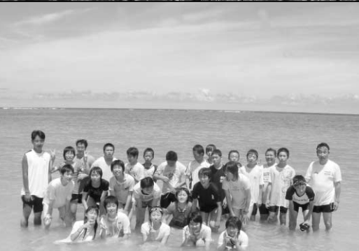
「ウップマ・ビーチ」にて