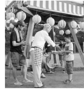
四辻夏まつりより