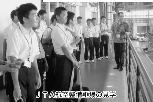
JTA航空整備工場の見学

研修に参加した生徒のうち、6名の皆さんから感想文を寄せていただきましたので、ご紹介します。