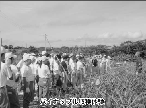
パイナップル収穫体験