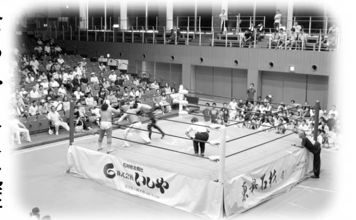
生のプロレスの迫力を味わった玉川夏まつり