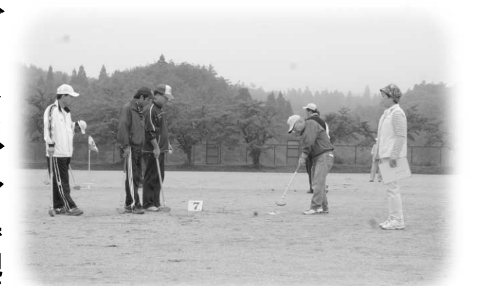
各チーム和気あいあいとプレーする参加者

地区の各種団体による実行委員会と四辻新田集落営農組合が主催。子どもたちによるスイカ割りや種飛ばし、青竹を使った「流しそうめん」などを楽しみ、夜には豊年盆踊りも行われ、お盆で帰省中の方々も踊りの輪に加わり、古里の夏を満喫していました。