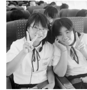
中学生国内研修より