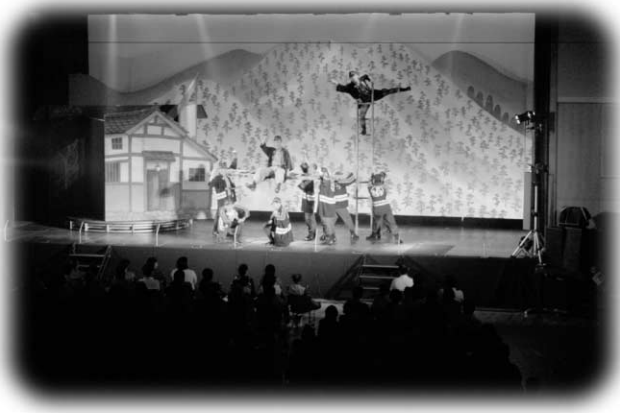
にぎやかに演じられたミュージカルの舞台

公演は、今の災害列島ニッポンの町や村にある消防団員の姿を、音楽の演奏や踊りを交えてにぎやかに演じられたミュージカルで、訪れた500人以上の村民が、身近な題材の舞台を楽しみました。