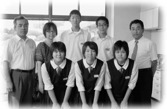
音楽祭で県大会出場の泉中の皆さん