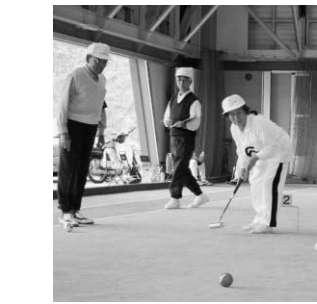
村長杯ゲートボール大会より