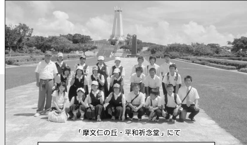
『摩文仁の丘・平和祈念堂』にて