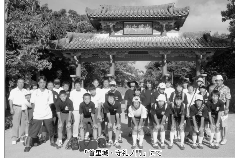
『首里城・守礼ノ門』にて

この研修で学んだことや、体験したことを忘れず、これからの生活に活かしていきたいです。