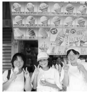
中学生国内研修より