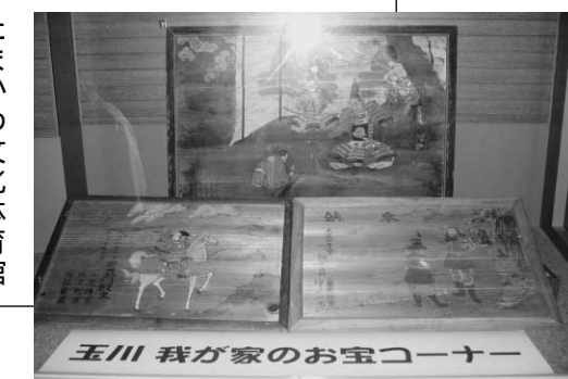
玉川 我が家のお宝コーナー

たまかわ文化体育館の玉川ふるさと館企画展では、現在、都々古別神社の貴重な「絵馬」を展示しています。絵馬展は来年3月まで開催中です。