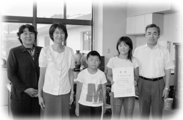
音楽祭で県大会出場の玉一小の皆さん