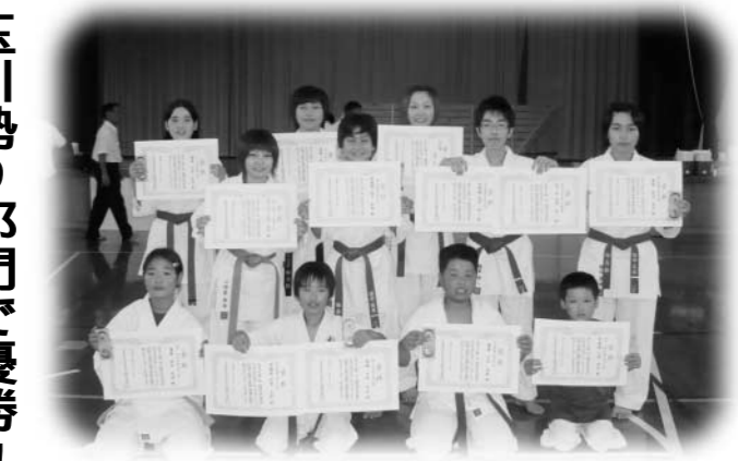
入賞を果たした玉川支部の皆さん