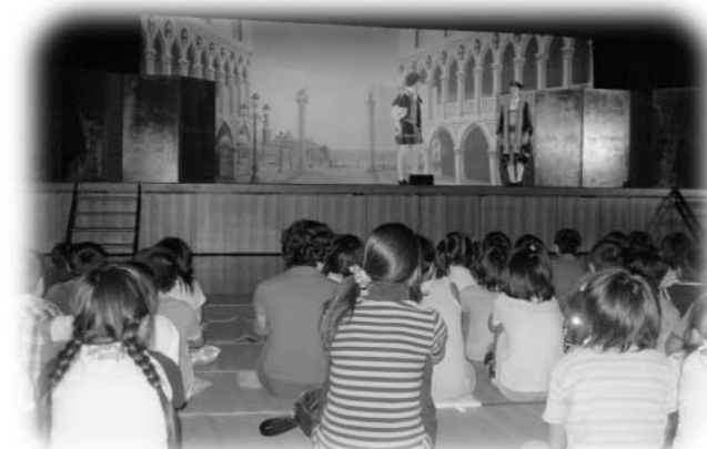
『ペニスの商人』の演劇に見入る子どもたち

演劇は低学年向けの『あおとり』と高学年向けに『ペニスの商人』の2演目が上演され目の前で見る本物の演劇に、子どもたちは身を乗り出して大きな歓声をあげ、保護者の方たちにも楽しい鑑賞となりました。