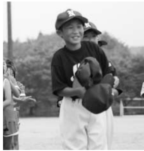
玉川村少年球技大会より