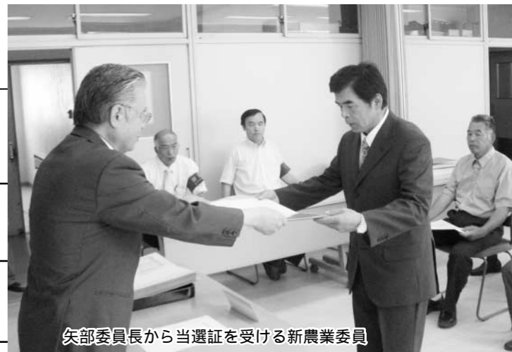
矢部委員長から当選証を受ける新農業委員