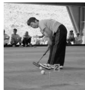
村長杯ゲートボール大会より