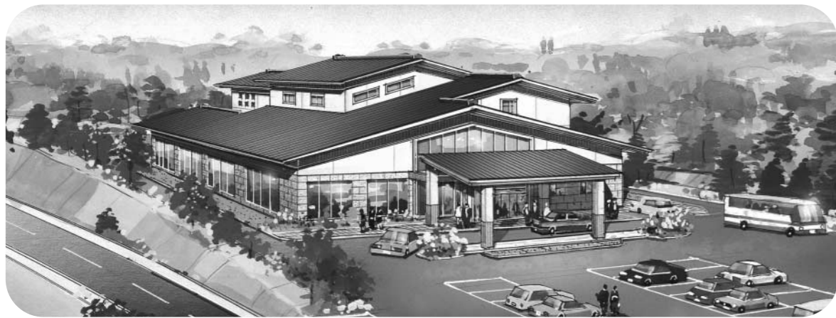
石川地方生活環境施設組合 新火葬場完成予想図

< お問い合わせは、石川地方生活環境施設組合 ☎0247-26-2784まで。>