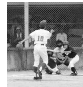
玉川村少年球技大会より