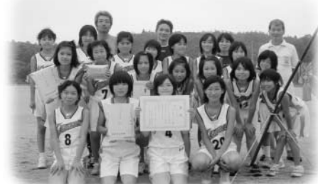
ミニバスケットボール優勝の川辺チーム

第37回玉川村少年球技大会が雨で順延となった7月27日(日)、村民グラウンドなどで開かれ、男子のソフトボールは竜崎、女子のミニバスケットボールは川辺が優勝しました。主な成績は下記のとおりです。