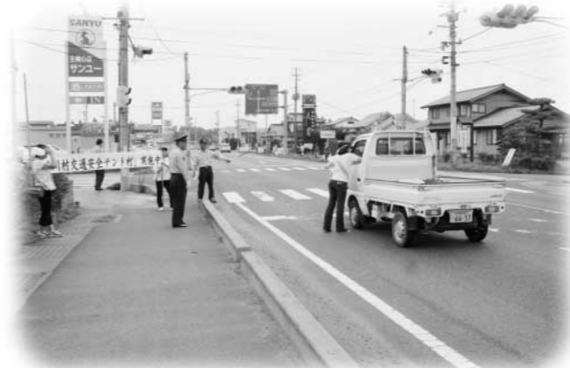
ドライバーに交通安全を呼びかける参加者

村交通安全協会や交通安全母の会、石川警察署長など約30人が参加し、交差点で信号待ちの車を待ち受けてチラシやうちわ、特産のさるなしジュースなどを配りながら、ドライバーに安全運転を呼びかけました。