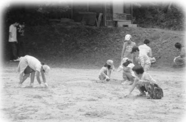
都々古別神社境内の除草作業を行う小学生

小学生や消防団員、老人クラブ員、協議会役員など総勢80名で除草作業などに汗を流し、終了後には大寺城址公園で食事会が行われました。