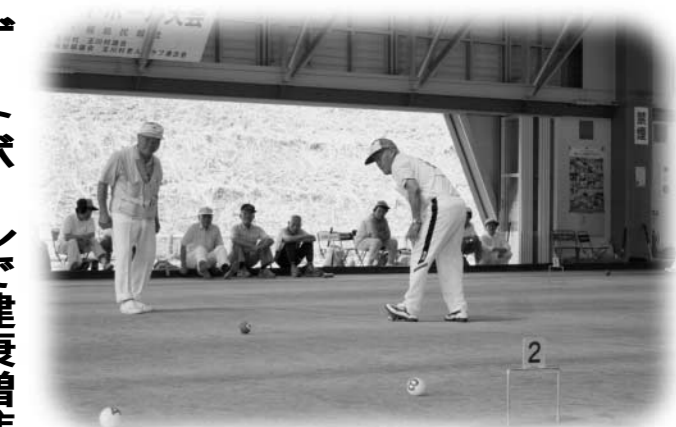
優勝を目指しプレーする選手