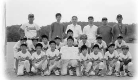
ソフトボール優勝の竜崎チーム