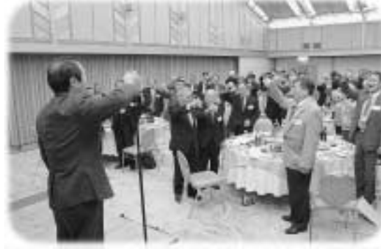
鹿谷郷からの訪問団を迎えて開催された歓迎会