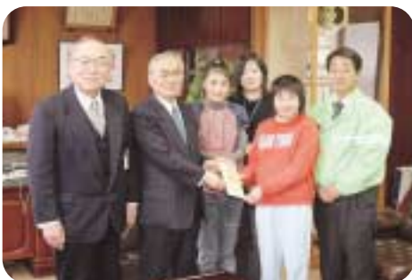
須釜小学校の皆さんより