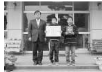
特選の川辺小(上)と玉一小(下)の皆さん