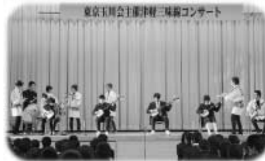
生徒や先生も飛び入りで参加しました

津軽三味線コンサートが11月20日、泉中学校で開 催され、泉、須釜の両中学生が本場の三味線演奏を楽 しみました。同コンサートは東京玉川会の主催による もので、出演者は浅草の「民謡酒場追分」のレギュラ ー出演者。メンバーには津軽三味線の全日本チャンピ オンもいて、両中学生は、目の前で日本一のバチさば きを堪能しました。