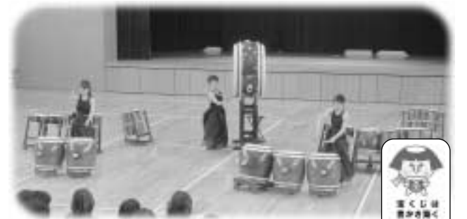
焔太鼓による迫力の太鼓演奏

11月23日に、親子や家族で太鼓作りや演奏を楽しむ 親子どんどこプログラムが開催されました。コミュニ ティ助成事業(宝くじ普及広報事業の一環で行われる 助成事業)の補助を受けて開催されたもので、35名が 参加。午前中に太鼓作り、午後からは女性太鼓奏者グ ループ「焔太鼓(ほのおだいこ)の演奏を楽しみました。