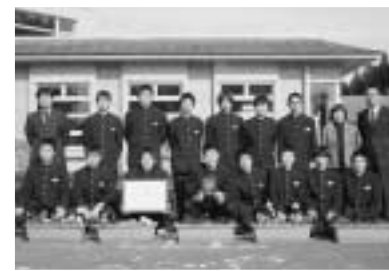
優秀賞の須釜中の皆さん