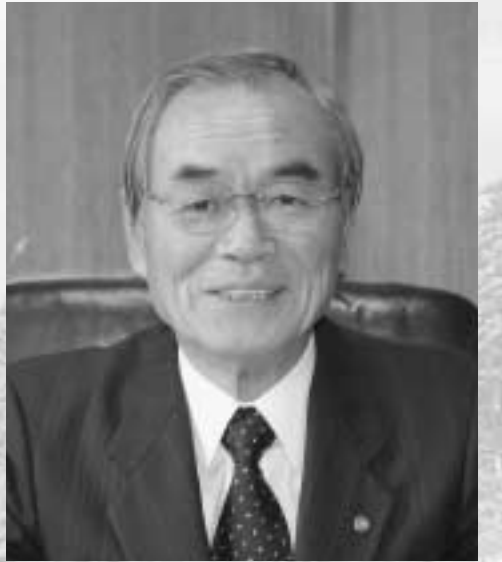
玉川村長 車田次夫