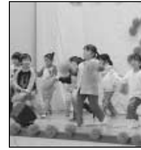
—南須釜区芸能祭から—