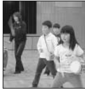
—親子どんどこプログラムから—