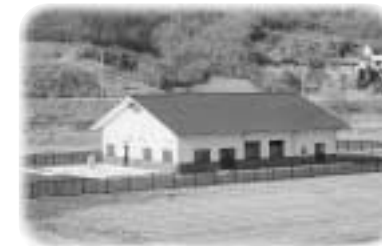
完成した処理施設

年金の受給手続など、お気軽にご相談ください。 年金手帳、基礎年金番号通知書をご持参ください。