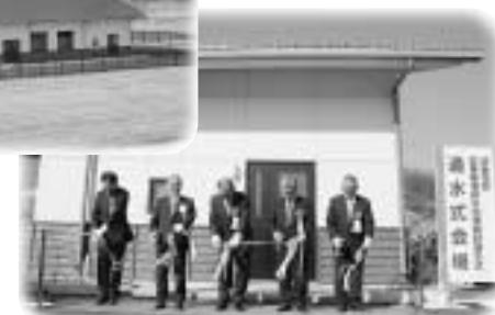
テープカットで完成を祝う関係者

本村3地区目の処理施設完成 須釜地区農業集落排水処理施設 本村では、川辺、竜崎地区に続いて3地区目となる、須釜地区の下水処理施設、農業集落排水処理施設がこのほど完成し、1月30日に通水式が行われました。 同処理施設については、平成17年度より、また管路工事については平成13年度より工事が進められていました。処理対象人口は1,210人となっており、南須釜、北須釜の一部の地域を対象地区とします。