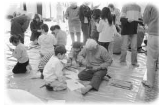
お年寄りに横笛の作り方を教えてもらう参加者

3世代が事業を通してふれ合う 世代間交流事業開催 村内の各地域で、子供育成会などが主催する世代間交流事業が行われ、3世代がいろいろな事業を通してふれ合いました。 南須釜子供育成会主催の同事業は、1月28日に須釜公民館で行われました。約150人が参加し、とん汁を作るグループと横笛を作るグループに別れ、最後まで力を合わせて作業し、交流を深めました。