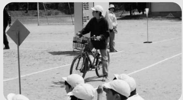
川辺小学校では自転車の乗り方について学びました