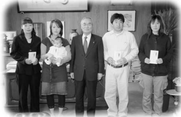
車田村長(当時)から祝い金を贈られた皆さん