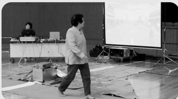
横断歩道の渡り方を学んだ老人クラブの交通安全教室