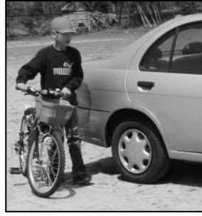
～川辺小 交通安全教室から～