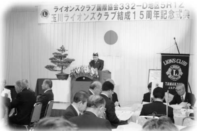
15周年を盛大に祝った記念式典

同クラブは平成4年6月に結成。これまでの間、村社会福祉協議会へ自動車を寄贈するなど数々の奉仕活動を続けてきました。