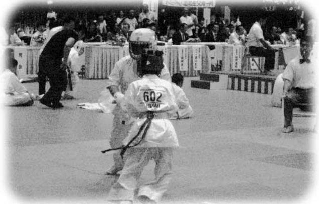
気合いのこもった戦いが繰り上げられた組手の試合

大会には、組手と型の競技の各部門に全国各地から845人が出場し、熱い戦いを繰り上げました。