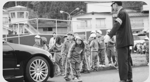
恒例となったいわき石川青年会議所主催の交通安全教室

老人クラブを対象とした交通安全教室は、4回にわたり行われました。教室では横断歩道の渡り方について、シミュレーションの機械を使い、歩く速度と車の速度の違いによる危険性などについて学びました。