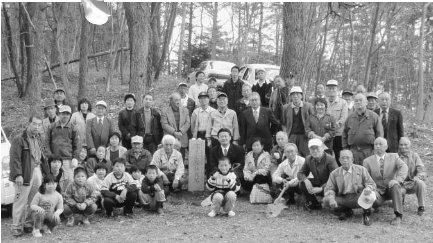
植樹を終えて全員そろって記念撮影

同愛好会では、昨年からの権現山までの遊 歩道の整備を進めてきており、あわせて遊 歩道沿いに、大山桜やシダレ桜などの苗木 を植えました。使用した桜の苗木は、宝く じ桜配布事業により日本桜の会から支給さ れたもので、全部で約300本を植えまし た。