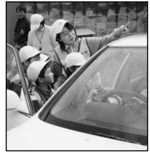
～石川青年会議所交通安全教室から～