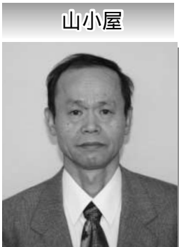
区長 石森 昌興