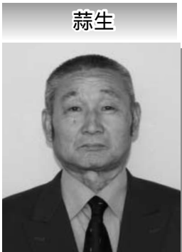
区長 曲山 武二