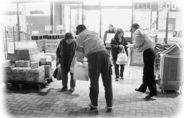
スーパーの買い物客にチラシを配る参加者

また、消防団の各分団では、それぞれの地区で消防自動車による一斉夜警を行い、防火を呼びかけました。