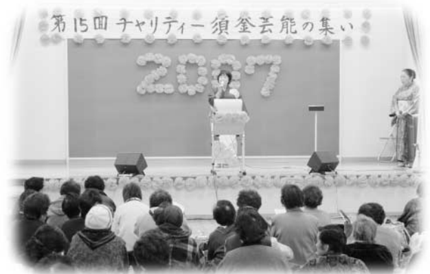
自慢ののどを披露する出演者