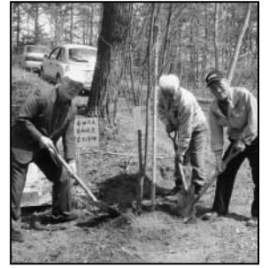
～権現山の桜植樹祭から～