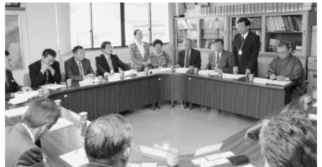
本村と鹿谷郷の議員による懇談会