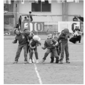
~ 小学校運動会より ~