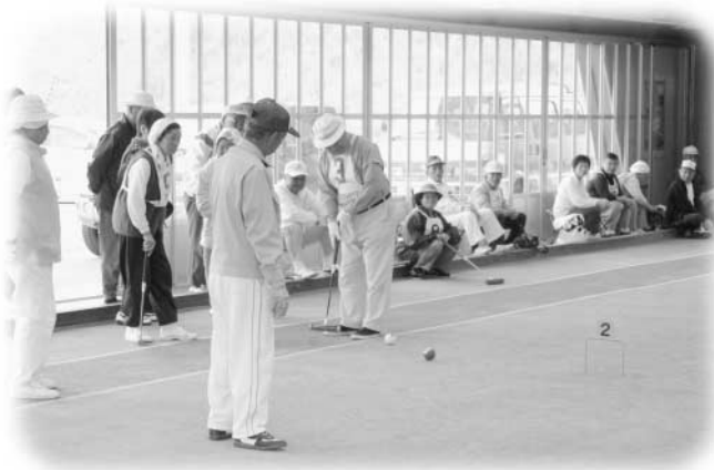
真剣な表情でプレーする参加者