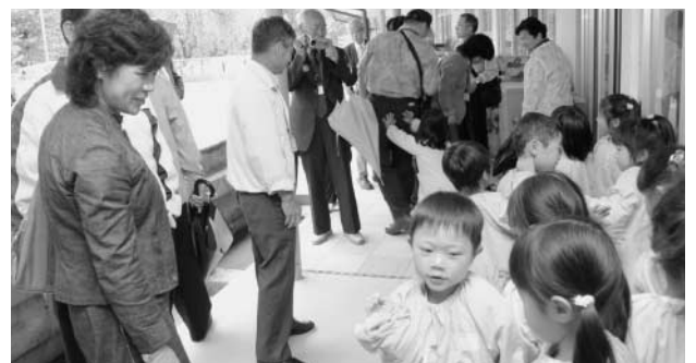
いずみ幼稚園を訪れた訪問団の皆さん

台湾にも少子高齢化の波は押し寄せているようで、たまかわ荘では、利用状況、費用などについて熱心に質問していました。