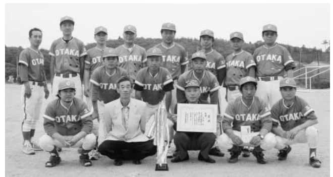
ソフトボール優勝の小高チーム