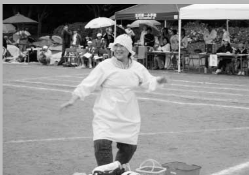
おっとこの人は...もしかして...（玉一小）