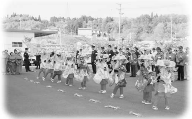
交通安全運動の出動式で披露された南須釜の念仏踊り

運動期間中には、小学校児童による交通安全鼓笛パレードも行われました。5月15日に須釜小学校、16日には川辺小学校の児童が、校歌やドラムマーチなどを演奏しながらパレードし、地域の方々に交通安全を呼びかけました。