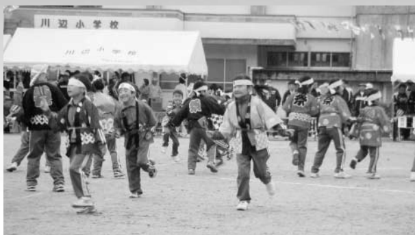
そろいのハッピーがりりしいです（川辺小）