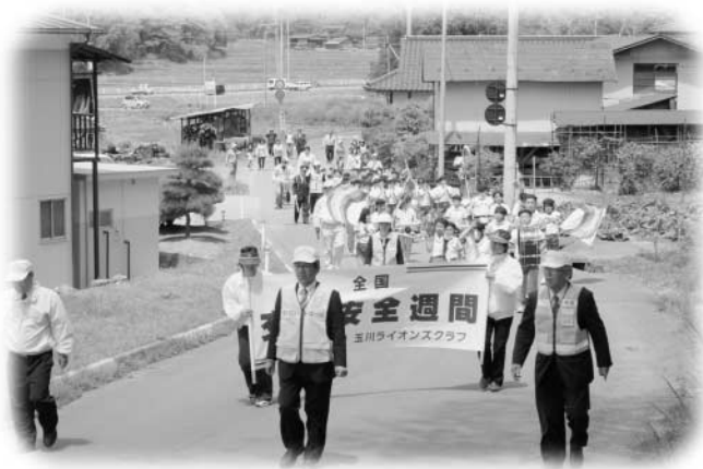
川辺小の皆さんによる交通安全鼓笛パレード