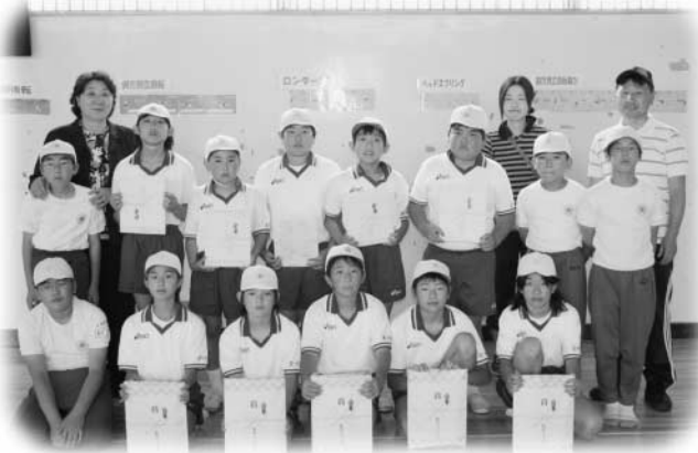
堂々の入賞を飾った玉一小の皆さん

玉川村からは玉川第一小学校が出場し、Aチームが4位、Bチームが6位に入賞しました。