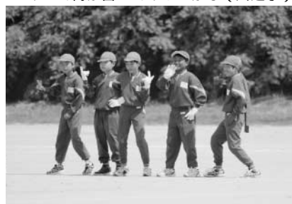
昨年はUFO、今年はペッパー警部でした（須釜小）