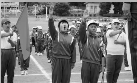
開会式での堂々の誓いのことば（玉一小）

会場に詰めかけた多くの保護者なども、子どもたちのがんばりに最後まで盛んな拍手を送っていました。