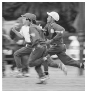
～小学校運動会より～