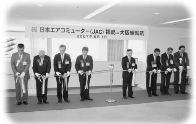
テープカットで就航を祝う関係者

使用される飛行機はボンバルディア社のプロペラ機で74人乗り。午後1時10分福島空港発、2時30分伊丹空港着で運行されます。