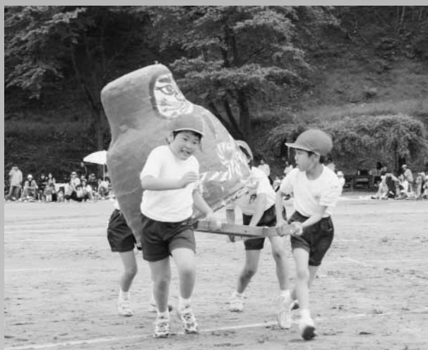
あぶない...ダルマが落ちそう（玉一小）