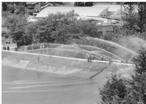
中村池で行われた一斉放水