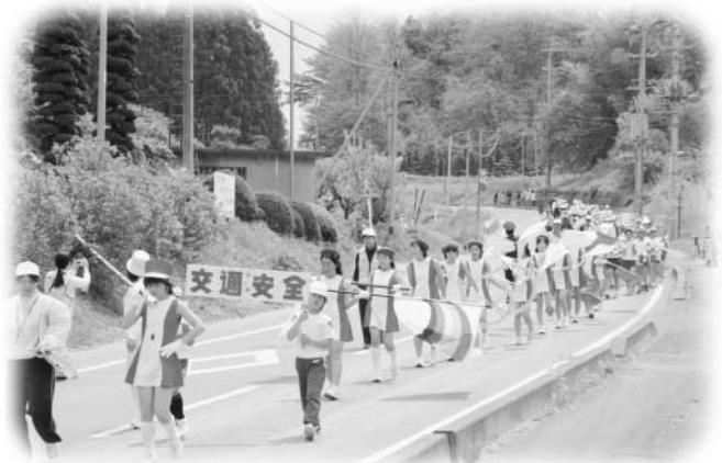
須釜小の皆さんによる交通安全鼓笛パレード