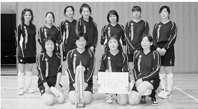
バレーボール優勝の南須釜チーム