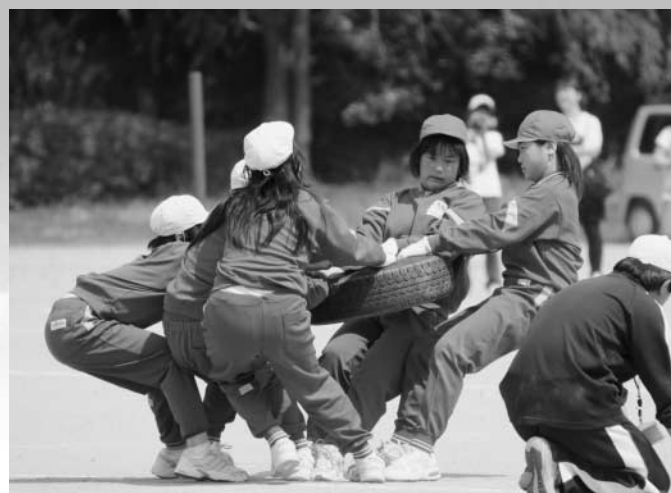
すごい迫力です。2人対3人ですけど勝ったのは...（須釜小）