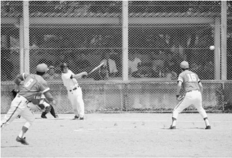
熱戦が繰り広げられたソフトボールの試合

大会には、ソフトボールに10チーム、家庭バレーボールには9チームがそれぞれ出場しました。結果は、ソフトボールは小高、家庭バレーボールは南須釜が優勝を飾りました。南須釜は平成13年度から優勝しており、今年度で7連覇となりました。その他の結果は次のとおりです。