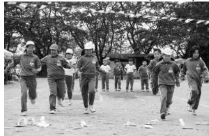
さあ～何が書いてあるのかな（川辺小）