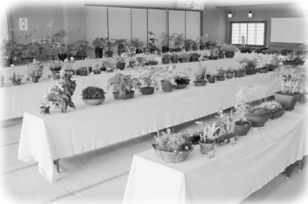
会場に展示されたすばらしい山野草の数々

すばらしい作品の数々に、会場を訪れた人々は、興味深げにじっくりと見入っていました。