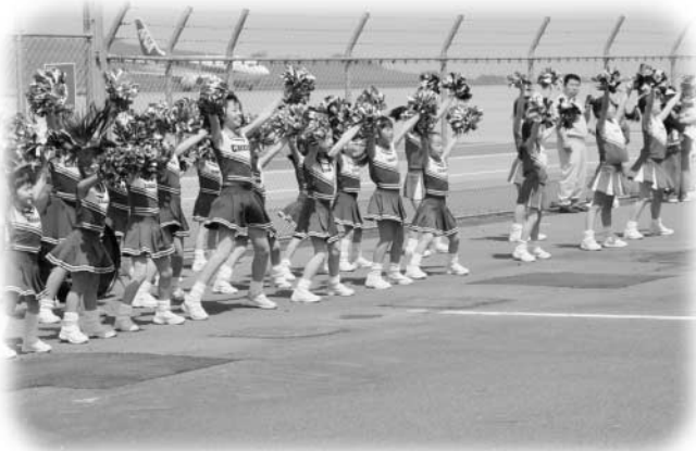
クラブスチアリーダーズの皆さんによるかわいいステージ