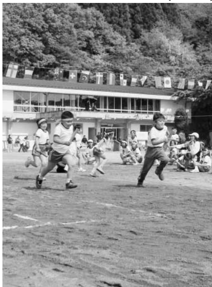
1年生から6年生まで最後までバトンをつないでがんばった紅白リレー （左は川辺小、右は須釜小）