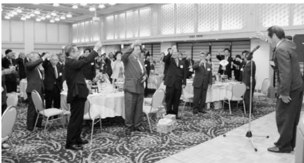
盛大に開かれた歓迎レセプション

玉川村と友好都市提携を結んでいる、台湾鹿谷郷の訪問団が、5月30日、31日の両日、本村を訪問し、各施設などを視察しました。 訪問団一行は、林光演郷長、葉瑞鐘郷民代表会主席（議長）、陳錫梧前郷長など約40名で、30日の午後に玉川村に到着し、たまかわ文化体育