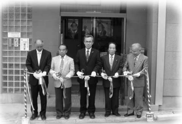
販売を記念してテープカットする関係者