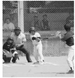
～少年球技大会から～