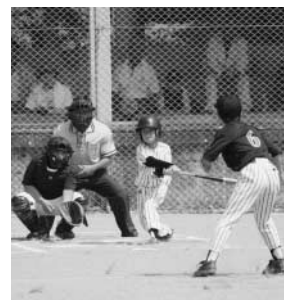
～少年球技大会から～