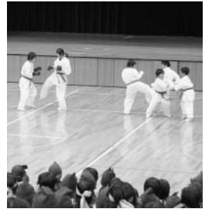
～浦添市少年の船交流から～