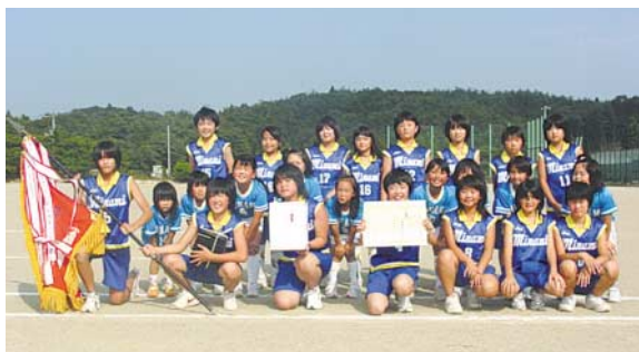
ミニバスケットボール優勝 南須釜チーム