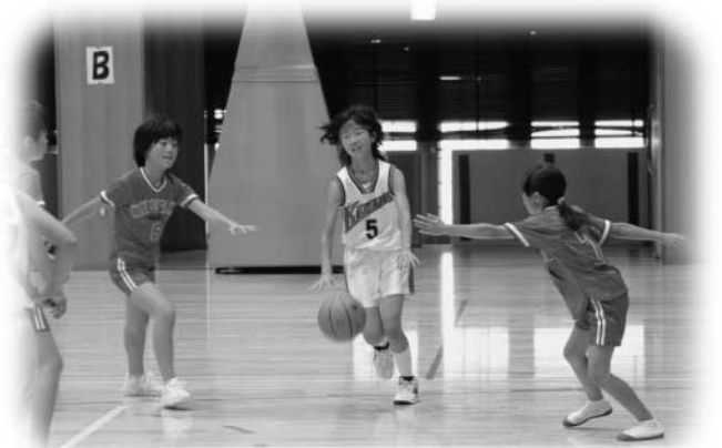
元気いっぱいプレーする選手たち（ミニバスケットボール）