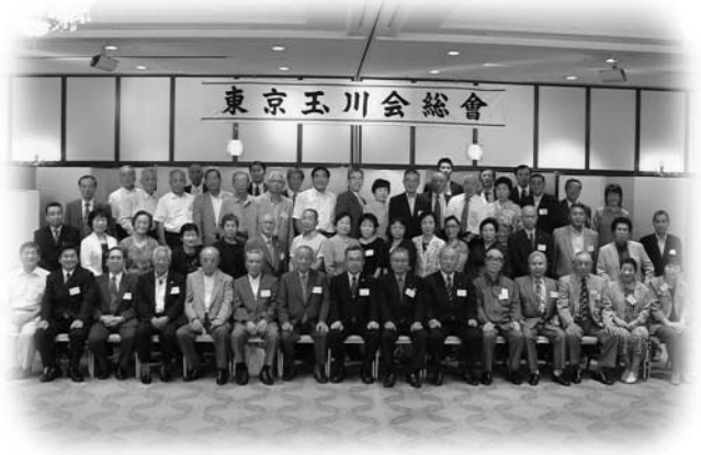
盛大に開催された東京玉川会総会の出席者

総会には、会員や村からの関係者など多数が出席し、事業計画などについて話し合いました。総会終了後には、お待ちかねの懇親会が開かれ、酒を酌み交わしながら、昔話に花を咲かせたりと、1年ぶりの再会に大いに盛り上がりました。また、毎年恒例となったお楽しみ抽選会も行われました。