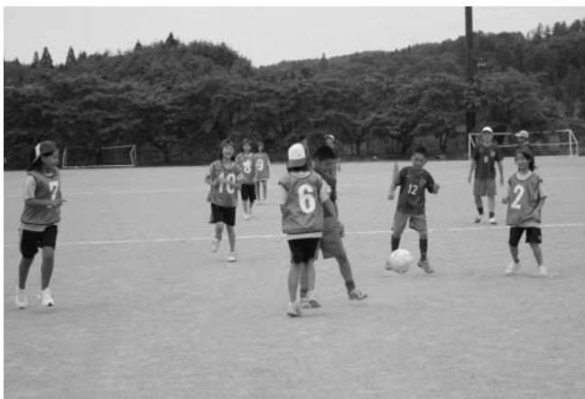
サッカーで交流を深める参加者

午後からは、スポーツを通して交流を深めるスポーツ交流会が行われました。参加者は、お互いに友情交歓カードを交換したあと、ソフトボール、ミニバスケットボール、サッカーなどに汗を流し、短い時間ではありましたが楽しいひと時を過ごしました。