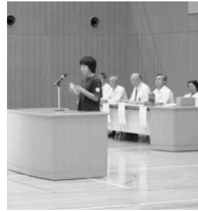
～浦添市少年の船交流から～