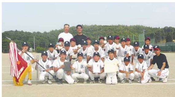
ソフトボール優勝 川辺チーム