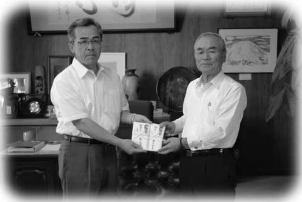
石森村長に寄付金を手渡す車田前村長（右）