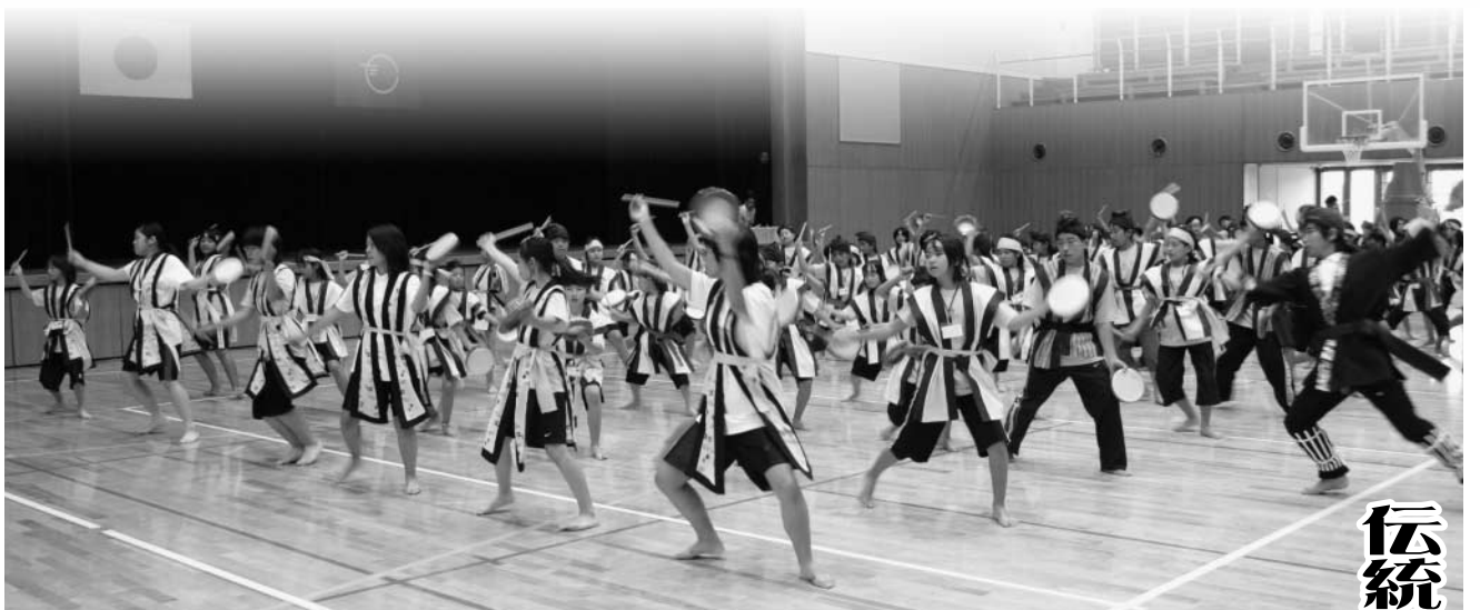
元気よくエイサーを披露した浦添市の皆さん