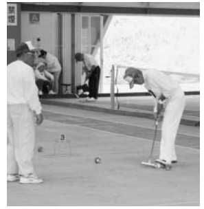
～村長杯ゲートボール大会から～