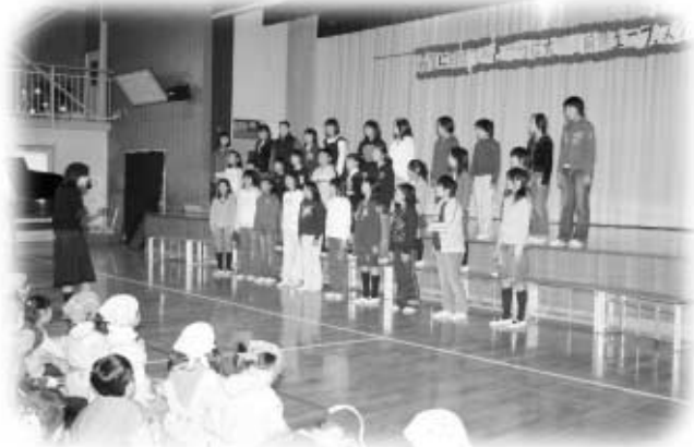
玉一小合唱部による美しい歌声

須釜小学校では、10月28日に『すがまっ子オープンフェスティバル』。11月10日には、川辺小学校の『川辺っ子祭り』と玉川第一小学校の『玉一フェスティバル』がそれぞれ行われ、児童らが大勢の参観者を前に、少し緊張しながらも、一生懸命がんばってきた成果を発表していました。