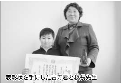
表彰状を手にした古寺君と校長先生

これからは、若い世代が年老いた世代を支えなければならぬので、しっかり納税する社会人になりたい。