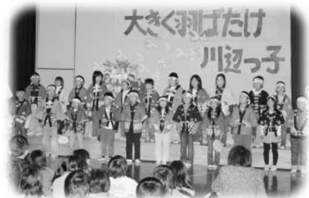
川辺小1・2年生による「おまつりワッショイ！」