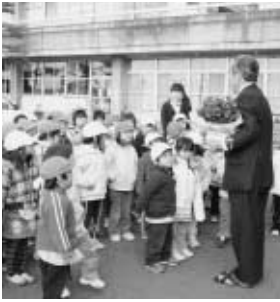
村長に勤労感謝の花を贈る泉保育所園児