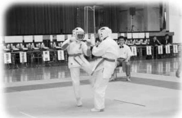
熱戦を繰り広げる道場生