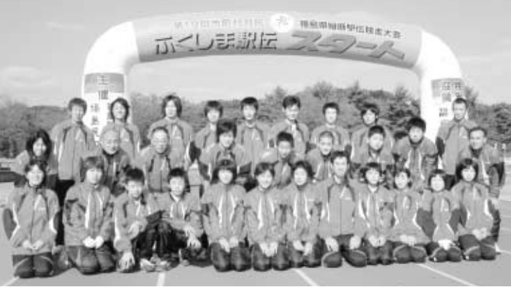
スタート地点に勢揃いした玉川村チーム・メンバー