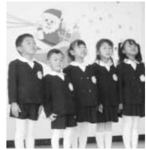
すがま幼稚園の生活発表会より