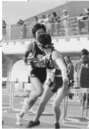
4区から5区へリレー (鏡石:鳥見山陸上競技場にて)