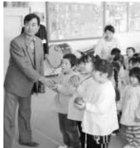
JAあぶくま石川からリンゴをプレゼントされるすがま幼稚園児