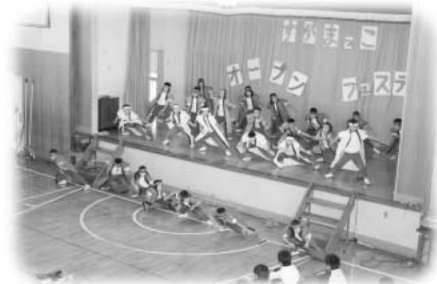
須釜小5年生による「よさこいソーラン」