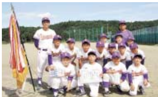
ソフトボール優勝の竜崎チーム