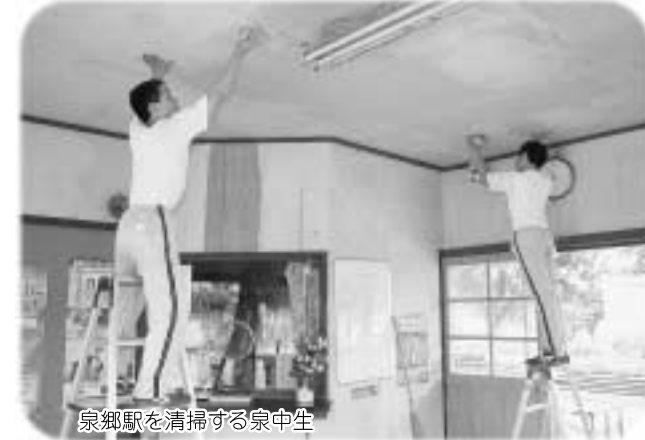
泉郷駅を清掃する泉中生

役場にも3人の生徒が訪れました。パソコンを使って書類を作ったり、高齢者の交通安全教室に参加したり、また泉郷駅の清掃も行いました。おかげで泉郷駅はとてもきれいになりました。