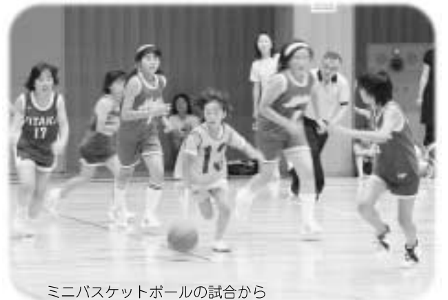
ミニバスケットボールの試合から