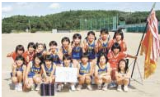
ミニバスケットボール優勝の小高チーム