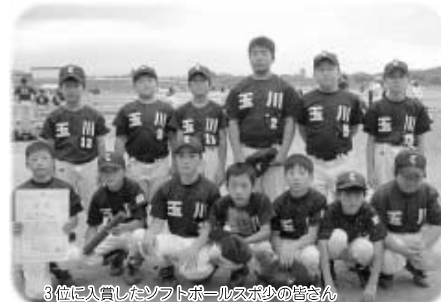
3位に入賞したソフトボールスポ少の皆さん

また、ソフトボールの大会、白獅子杯県南大会が7月8日、9日の両日開催され、こちらも玉川ソフトボールスポ少がブロンズで3位に入賞しました。