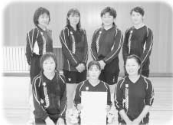
賞状を手にする南須釜クラブの皆さん