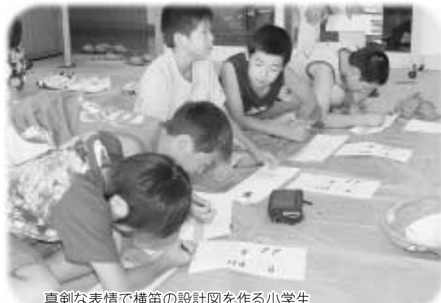
真剣な表情で横笛の設計図を作る小学生

教室には、村内の小学生20人が参加。県立博物館の森専門学芸員らの指導のもと、刃の部分の三又になっているネズミ歯キリといわれるキリで穴をあけたり、紙ヤスリで磨いたりしていいいに仕上げました。