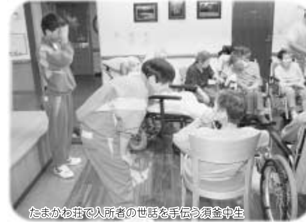
たまかわ荘で入所者の世話を手伝う須釜中生

特別養護老人ホームたまかわ荘には8人の生徒が訪れ、車いすを押してあげたり、一緒にゲームを楽しんだりと入所者の世話を手伝いました。生徒の一人は「思ったより大変だけど楽しいです」と笑顔で接していました。