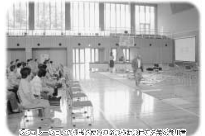
シミュレーションの機械を使い道路の横断の仕方を学ぶ参加者