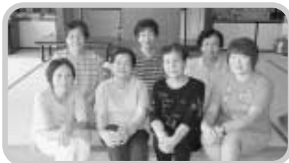
吉健康クラブの皆さん