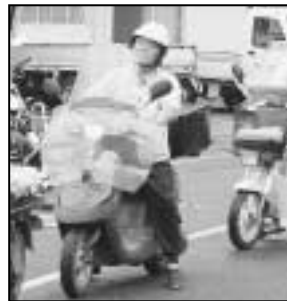
～高齢者交通安全教室から～