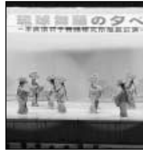
～琉球舞踊の夕べから～