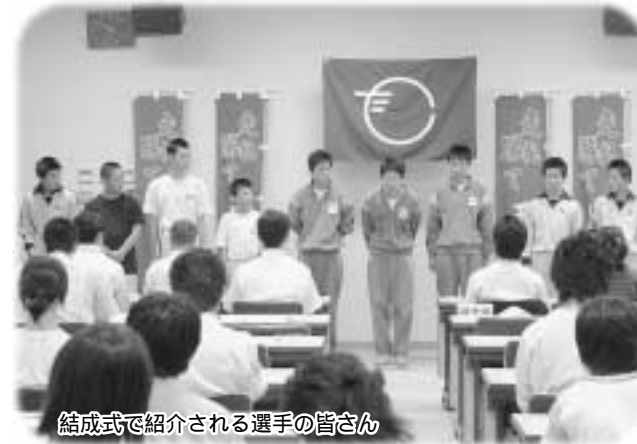
結成式で紹介される選手の皆さん

1回目の教室は石川自動車教習所で開かれ、原付バイクの正しい乗り方について、警察署員などの指導を受けました。2回目、3回目は道路の渡り方について行われ、歩く速度と走って来る車の速度の違いによる危険性などについて学びました。