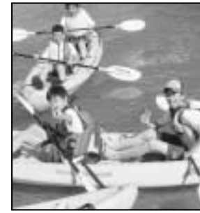
～中学生沖縄研修から～