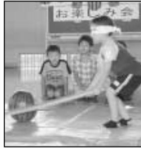
～いづみクックちゃんクラブのすいか割り大会から～