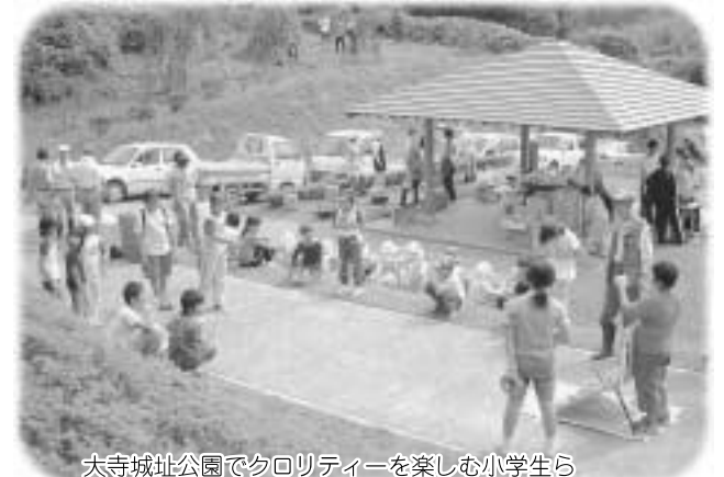
大寺城址公園でクオリティーを楽しむ小学生ら

同活動は今年で22回目で、地区の小、中学生から老人クラブまで約100人が参加し、草むしりや草刈りを行いました。作業終了後には、大寺城址公園でゲームをしたり、かき氷やトン汁を食べたりと楽しい一日を過ごしました。