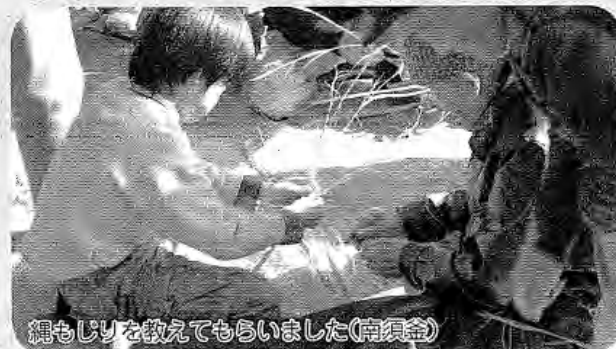
縄もじりを教えてもらいました(南須益)