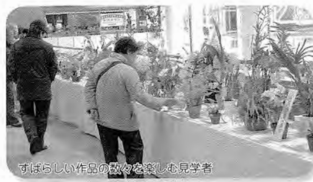
すばらしい作品の数々を楽しむ見学者

福島空港では、恒例となった洋らん展が年末、年始にかけて開催されました。 福島エアポート洋らんクラブの主催によるもので、毎年この時期と5月の、年2回開催されています。 空港のロビーには、同クラブの会員が丹精込めて育てた洋らんが多数展示され、甘い香りをなびかせながら、訪れた方の目を楽しませていました。