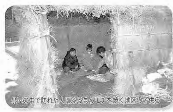
小屋の中で訪れた人にもふるまうモチを焼く地区の子供ら

1月14日に、南須釜地区と山小屋地区で、古くから伝わる伝統行事、やっちゃん小屋が行われました。 やっちゃん小屋は、ワラや竹で作った小屋に、正月のしめ飾りや門松などを入れて燃やし、今年一年間の無病息災を願うというもの。 午後7時過ぎに火が放たれると、暗闇に勢いよく炎が立ち上がり、詰め掛けた観衆から歓声が上がりました。