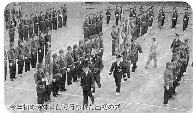
今年初めて体育館で行われた出初め式