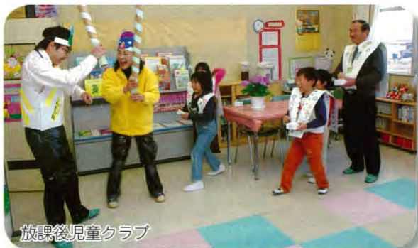
放課後児童クラブ