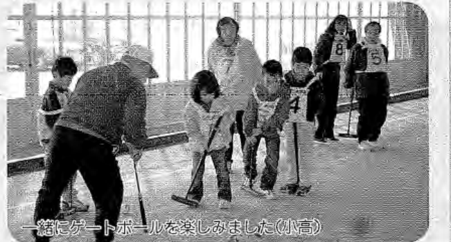
一緒にゲートボールを楽しみました(小高)