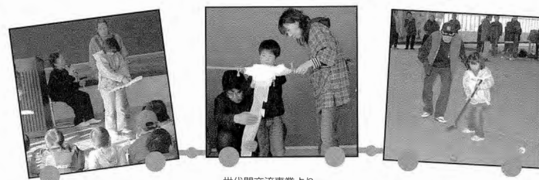
～世代間交流事業より～