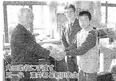
倉田助役に手渡す 玉一小 滝井君と新田先生