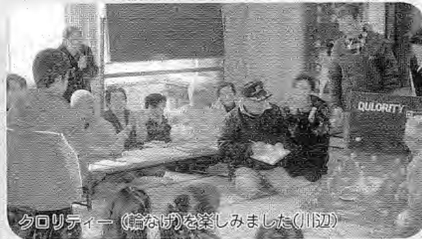
タロリティー(論なげ)を楽しみました(川辺)

村内の各地で、子ども達と父母、祖父母らが参加して、ゲームや食事などを通して交流を深める、世代間交流事業が行われました。 近年、世代間の交流が少なくなっていることから、各地の子供育成会などが中心となり実施したもので、一緒に縄もじりをしたり、ゲートボールをしたりと楽しいひと時を過ごしました。