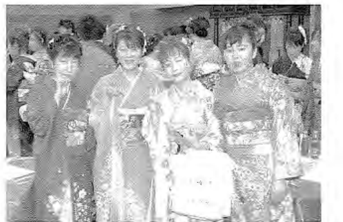
20歳の記念パーティーにて