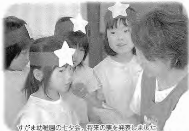
すがま幼稚園の七夕会、将来の夢を発表しました