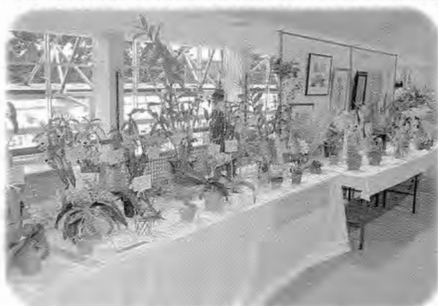
2階出発ロビーに展示された作品の数々

毎年恒例となった福島空港洋らん展が、今年も5月22日から29日まで開催されました。福島エアポート洋らんクラブなどの主催、玉川村などの後援によるもので、同クラブの会員が丹精込めて育てた洋らんが、出発ロビーなどを会場に多数展示されました。会場では、空港の利用客などが甘い香りに誘われて足を止め、熱心に見入っていました。