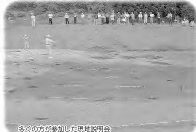
多くの方が参加した現地説明会

湯神前遺跡は、昭和63年の発掘調査に続いて、5月9日から30日まで2回目の調査を行い、中世の建物跡や井戸の跡などを発見。当時の家としては比較的大きいことから、有力民の家だったのではないかと考えられています。