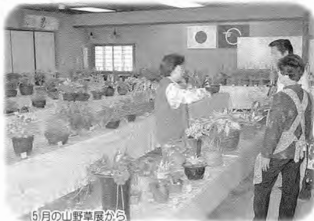
5月の山野草展から