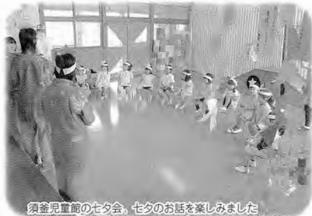
須釜児童館の七夕会、七夕のお話を楽しみました