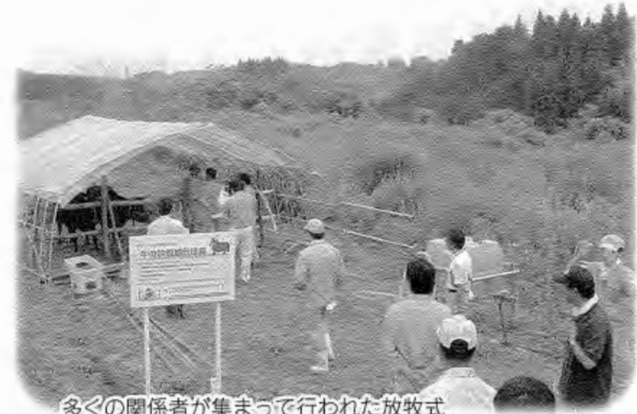
多くの関係者が集まって行われた放牧式

6月29日に行われた放牧開始式では、関係者など多数参加し、57アールの農地に2頭の牛を放牧しました。