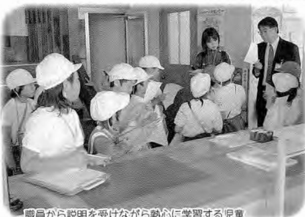
職員から説明を受けながら熱心に学習する児童

児童たちは各職場をまわり、仕事の内容などについて職員から説明を受けると、メモを取ったり、時には質問したりと熱心に学習していました。