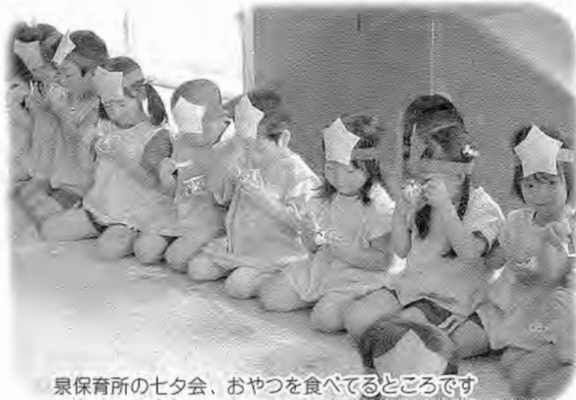
泉保育所の七夕会、おやつを食べてるところです