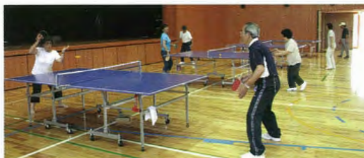
ラージボール卓球より