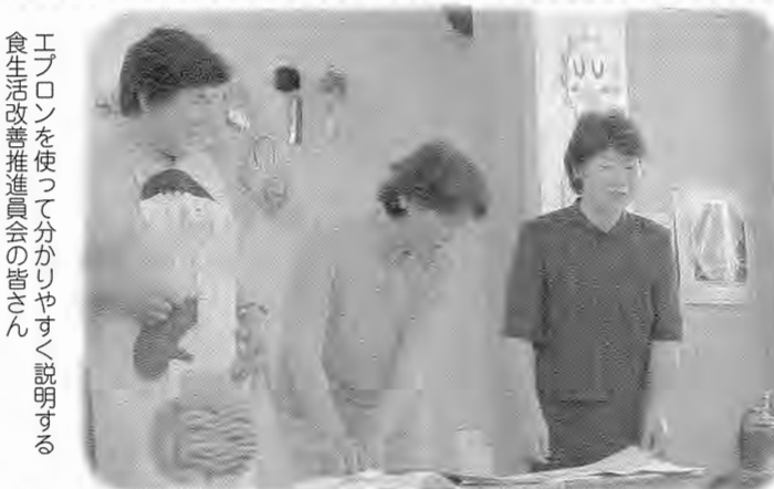
エプロンを使って分かりやすく説明する食生活改善推進委員会の皆さん

いずみ幼稚園で6月24日、食と体について学ぶ学習会が開かれました。講師は食生活改善推進委員会の方々。胃や腸などお腹の中のようなすが分かるように作られたエプロンを使って、食べたものがどこを通過して行くかなど体のしくみについて、分かりやすく説明しました。 当日はちよつと保育参観の日で、子ども達はお母さん達と一緒に楽しみながら学んでいました。