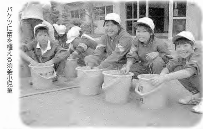
バケツに苗を植える須釜小児童