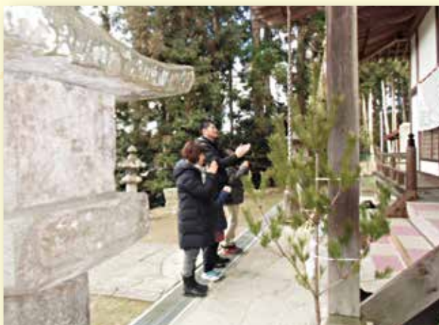
南須釜 都々古別神社