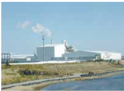
稼働中の廃棄物減容化施設(浪江町)

されています。 最後に案内された防災備蓄倉庫には、1万人が3日間過せる分量が保管可能で、電動シャッターは停電時にも消防車からの送水により開閉できるなど、随所に災害の教訓が生かされており、大変参考となる研修でした。