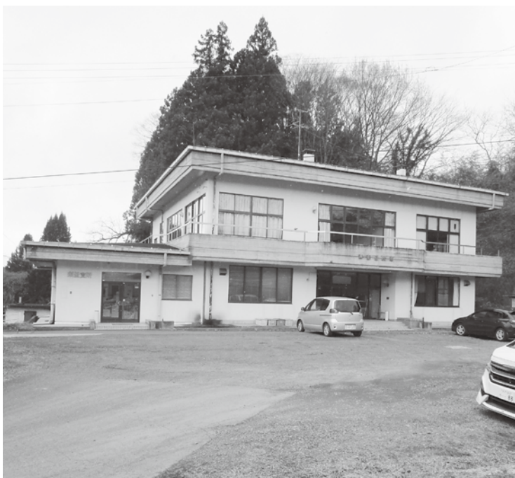
改修が待たれる須釜公民館

応えるべきと思う。身体障害者への対応は。 答 指定救急避難所等に指定したが耐震基準を満たしていないことから、耐震補強にあわせ使いやすいよう改修を検討したい。 また、身体障害者への対応については、スロープのほか多目的トイレの設置について検討する。