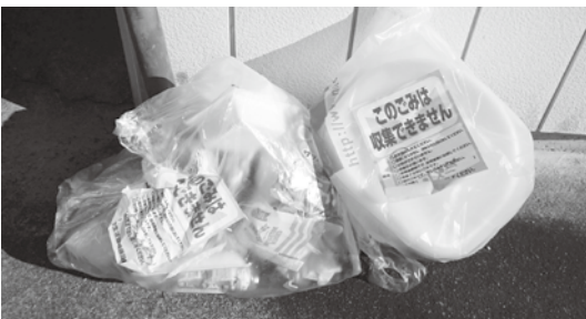
ルールを守って皆できれいに

頼され、11月29日に設置した。 問 中区以外の設置の考えはあるか。 答 行政区長からの要望があれば相談する。