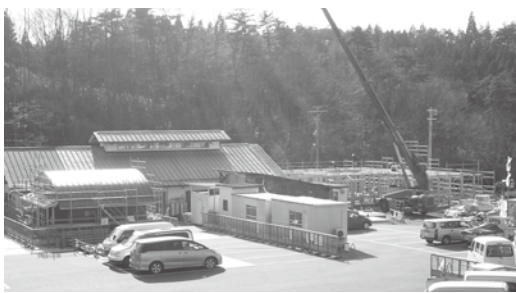
拡張工事中の道の駅

答 施設の条例、備品の利用規則等を整備し、その後に利用者への説明や利用者の募集を行い運営に備えたい。