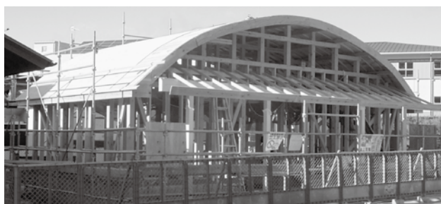
工事が進む道の駅の新しいトイレ