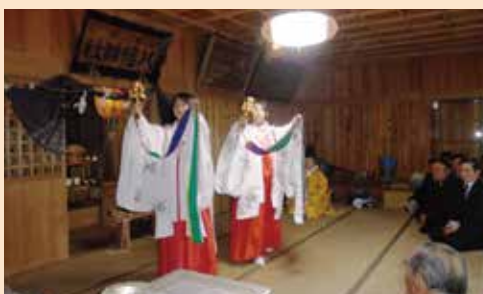
浦安の舞 (竜崎八幡神社での元旦祭)