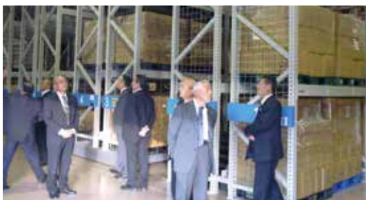
多種多様な物品が保管されている備蓄倉庫(相馬市)

9日は相馬市を訪れ、市観光協会の復興案内人の方から、市内を巡りながら説明をいただきました。 市は東日本大震災による大津波により、約29㎢(市全体面積の約15%)が浸水するなどの甚大な被害をこうむりました。 案内された松川浦大橋