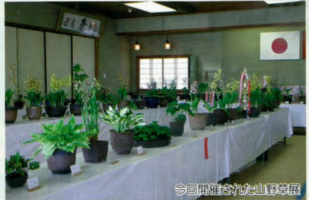
今回開催された山野草展

朝食時の野菜について、食べていない子どもが44%と非常に多いです。朝食時に食べないが昼食時、夕食時には野菜を食べているようですが、2食で1日に必要な野菜の目安量(緑黄色野菜60g、その他の野菜100g)をとることは難しくなります。野菜には体の調子を整えてくれる栄養素「ビタミン類、ミネラル類」が豊富に含まれ、免疫力を高め、風邪や色々な病気にかかりにくくしたり、丈夫な骨や体を作るために大切な役割を果たすものです。朝食時から、できるだけ野菜を食べるように工夫することが大切になります。野菜の摂取状況としては、おかずからとるより、みそ汁の具としてとる子どもの割合がやや多いようです。朝食時に具沢山のみそ汁や野菜スープを一品加えることで、野菜不足を解消し、食品数が増え、栄養のバランスがとれますので、みそ汁を見直してはいかがでしょうか。ただ、塩分は控えめに!