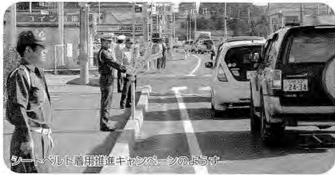
シートベルト着用推進キャンペーンの様子

国道118号線では、交通安全協会の会員らが多数参加し、通行する車一台一台にシートベルトの着用を呼びかけました。