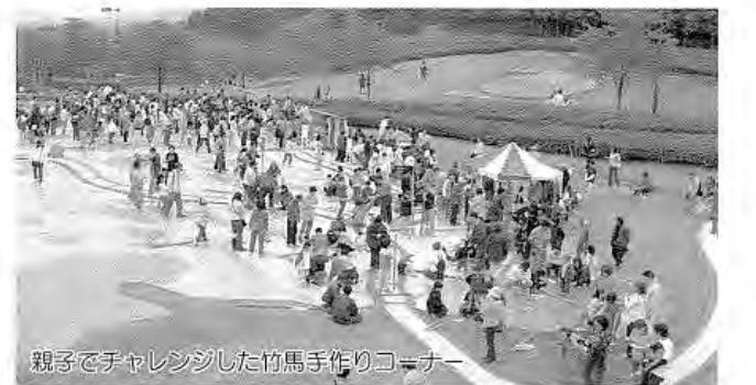
親子でチャレンジした竹馬手作りコーナー