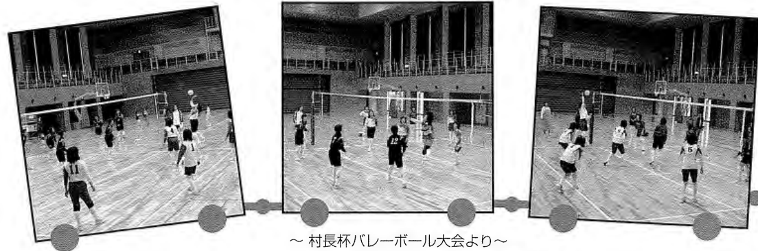
～ 村長杯バレーボール大会より～