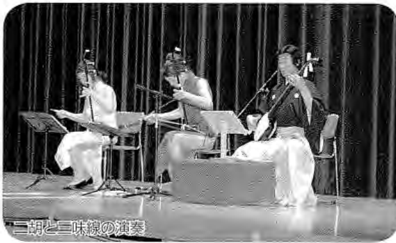
胡と三味線の演奏