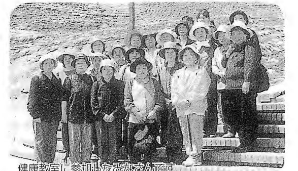
健康教室に参加したみなさんです

今年度から始まった、保健センター健康教室の第1回目の教室が、4月30日に開催されました。 内容は「ウォーキング」で、平田村のジュピアランドを会場に行われ、美しく咲き始めた芝桜を眺めながら、それぞれのペースで心地よい汗を流しました。 保健センター健康教室は毎月開催され、2回目は5月28日(金)に開催されます。