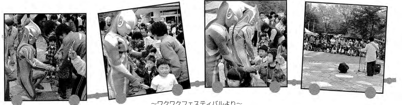
～ワクワクフェスティバルより～