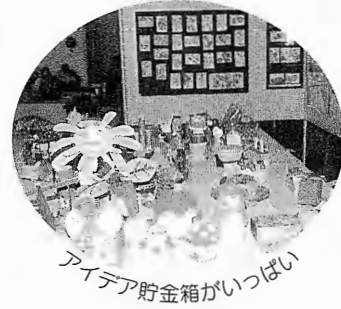
アイデア貯金箱がいっぱい

児童・生徒作品展・菊花展、山野草展・老人作品展などでは、出品作品を審査して各賞を決定いたしました。