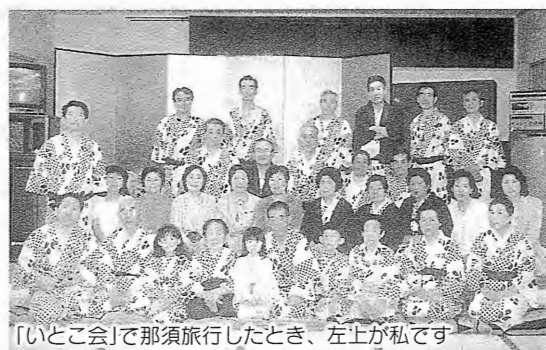
「いとこ会」で那須旅行したとき、左上が私です

日本選手の活躍に沸いたシンドニー五輪も終わりましたが、私も東京五輪の年に上京し、早いもので36年の年月が経ちました。当時を思い出すとき、どちらかというとモノクロの印象の強い中で、仕事に窓から見えた東京五輪の開会式で、秋空に描かれた色鮮やかな五輪の飛行雲は今でも総天然色で蘇ってきます。 子供の頃で印象に残ることと言えば、中学2年の夏休み、滝根町にある入水鍾乳洞に行ったときの事です。入水鍾乳洞が一般に余知られてなかった頃で、入口も非常に狭く、新聞紙を濡らして巻いた蠟燭を頼りに、素足に藁草履、全身ズブ濡れで洞内の見学をしたのを懐かしく思い出します。当時は道路事情も良くなく、車は村の有志