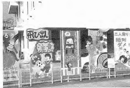
玉川村各小中学校の作品

秋の交通安全運動の一環として、石川警察署・石川地区交通安全協会が交通安全立看板コンクールの審査が行われました。 立看板は、石川管内の各小中学校及び各事業所等に作成の案内をしたところ、小学校の部で18枚、中学校の部では10枚、事業所等の部では7枚の立看板が集まり、部門ごとに審査をし小学校の部で川辺小が金賞、玉川第一小が銅賞となり、中学校の部では、泉中学校が金賞となりました。村内の各小中学校から出品された立看板は役場前旧道沿いに掲示してあります。 「この季節の夕暮れ時は、車の運転手からは姿が見えにくくなります。お出掛けの際は、明るく目立つ服装にしましょう。」