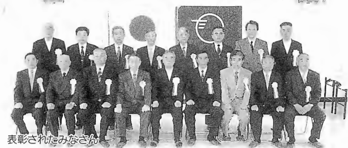
表彰されたみなさん