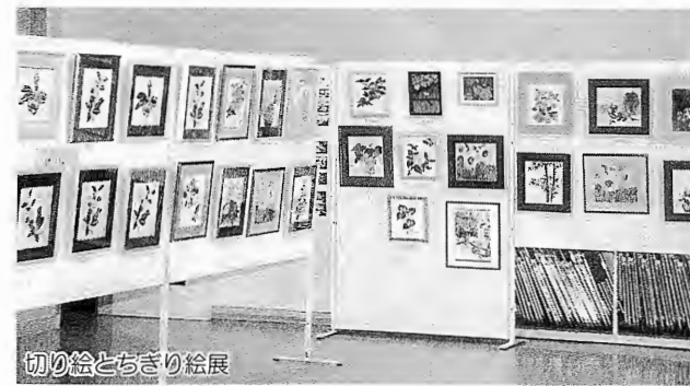
切り絵とちぎり絵展