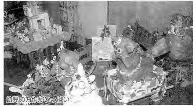
幼児の方作がいっぱい