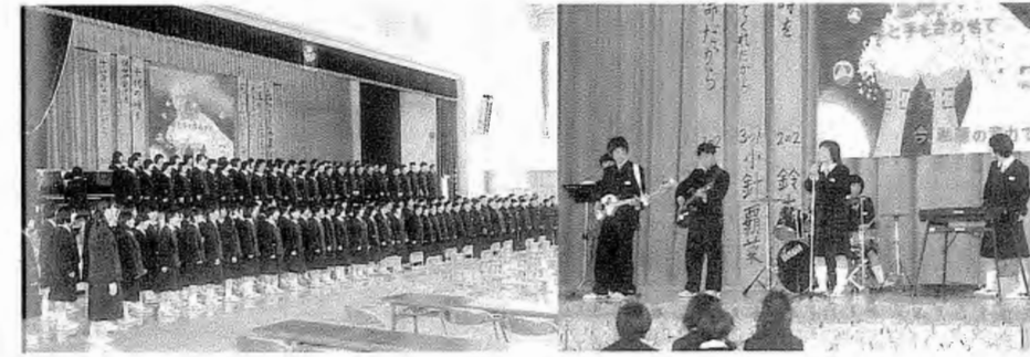
泉中学校生徒全員による合唱と生徒によるバンド演奏の様子

須釜中学校や泉中学校では、10月22日(日)に、館山祭(須釜中)、いずみ祭(泉中)と題して、学校祭が行われました。館山祭は、「Let's go 21 century 夢と希望の世界へ」をテーマに行われ、体育館には絵画や書写、技術・家庭科作品などが展示され、ステージでは弁論大会・特設合唱部の発表や3年生によるアンサンブル、英語弁論発表などがありました。午後には合唱コンクールなどが行われ、訪れた方々は発表が終わる度に温かい拍手を贈っていました。PTAの皆さんもバザーなどで学校祭の盛り上げに一役かっています。 いずみ祭では、「今、君が思うこと 今、私が思うこと」と手を合わせて、今、私たちの意力で、「」をテーマに、弁論大会・合唱コンクールがあり、中でも先生方による合唱には、大きな拍手がありました。合唱の最後には、生徒