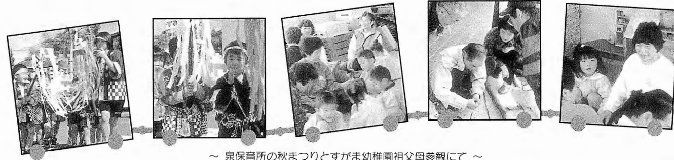
～ 泉保育所の秋まつりとすがま幼稚園祖父母参観にて～