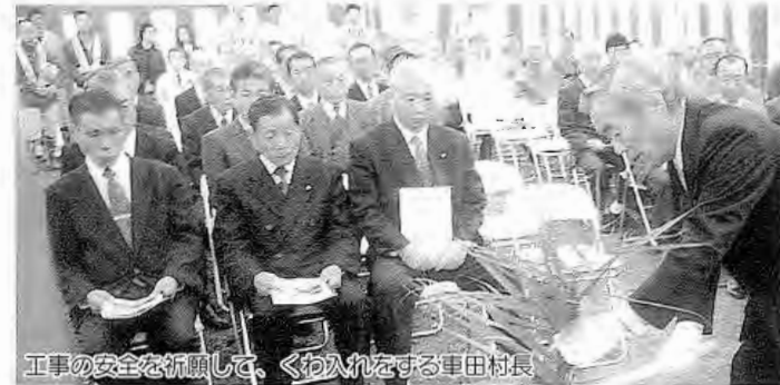
工事の安全を祈願して、くわ入れをする車田村長