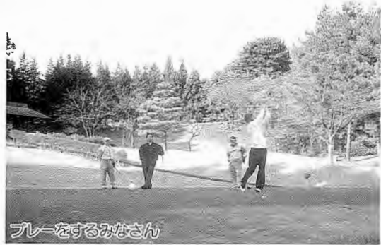
プレーをするみなさん

表彰式には、チャリティー募金も行われ、今回の収益金96,407円は社会福祉協議会へ寄付されました。