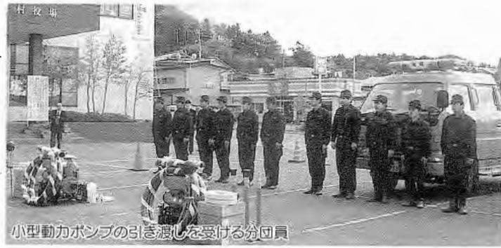
小型動力ポンプの引き渡しを受ける分団員