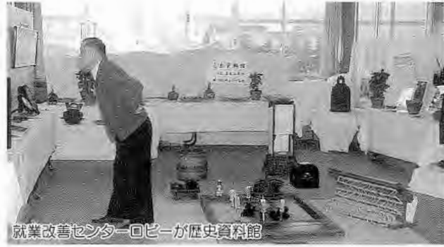
就業改善センターロビーが歴史資料館