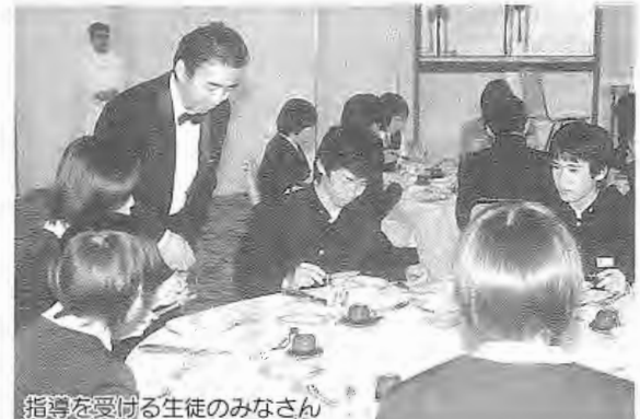
指導を受ける生徒のみなさん

テーブルマナーは、泉中学校の3年生や先生、保護者の皆さんが集まりマーヴェラス末広で行われました。生徒達は、フランス料理を食べるのが初めてとあって、なれない手つきで、ホークとナイフを使い、味を堪能していました。