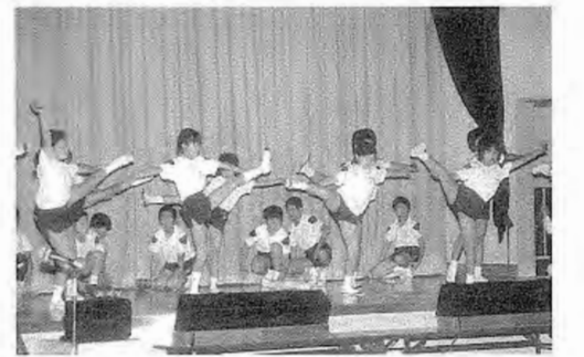
須釜小学校児童の学習発表会の様子

10月8日(日)の須釜小学校四辻分校の学習発表会を皮切りに、22日(日)川辺小学校は川辺っ子祭りが行われ、お神輿担ぎや全体合唱などがあり、大勢の人で賑わっていました。また、11月4日(土)には須釜小学校で学習発表会があり、全校合唱・群読・合奏劇や石川地区音楽祭で金賞を受賞した表現「四辻太鼓」などが披露されるたびに、大きな拍手がありました。 玉川第一小学校では、11月18日(土)に玉川フィステバルが実施されます。