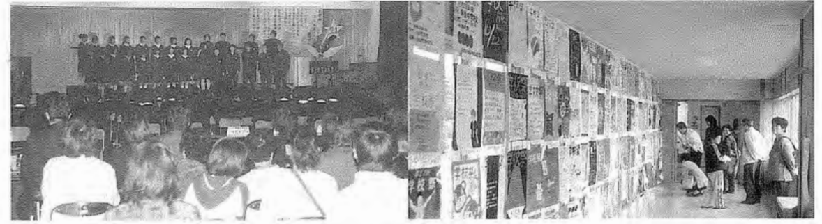
須釜中学校生徒の合唱風景とポスター展示

須釜中学校や泉中学校では、10月22日(日)に、館山祭(須釜中)、いずみ祭(泉中)と題して、学校祭が行われました。館山祭は、「Let's go 21 century 夢と希望の世界へ」をテーマに行われ、体育館には絵画や書写、技術・家庭科作品などが展示され、ステージでは弁論大会・特設合唱部の発表や3年生によるアンサンブル、英語弁論発表などがありました。午後には合唱コンクールなどが行われ、訪れた方々は発表が終わる度に温かい拍手を贈っていました。PTAの皆さんもバザーなどで学校祭の盛り上げに一役かっています。 いずみ祭では、「今、君が思うこと 今、私が思うこと」と手を合わせて、今、私たちの意力で、「」をテーマに、弁論大会・合唱コンクールがあり、中でも先生方による合唱には、大きな拍手がありました。合唱の最後には、生徒