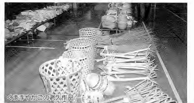
くま手やかこの老人作品

また、屋外駐車場では、村商工会青年部による「そば打ち体験教室」や泉婦人会の「パーが行われ、暖かい陽気に誘われて、村民の方々が多数訪れて賑わいました。