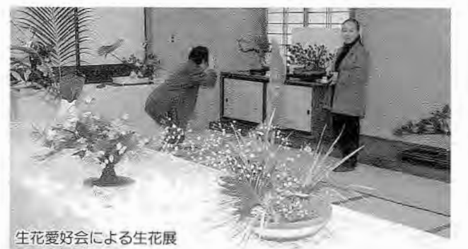
生花愛好会による生花展