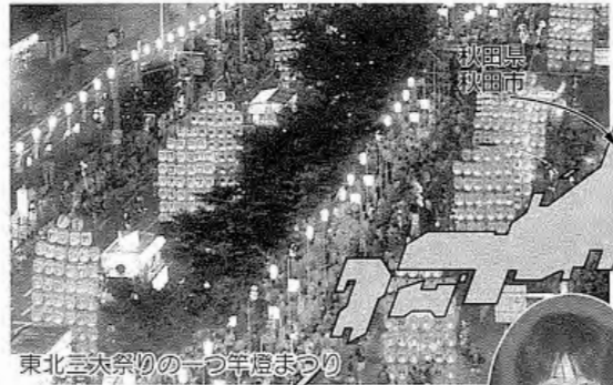
東北三大祭りの一つ竿燈まつり