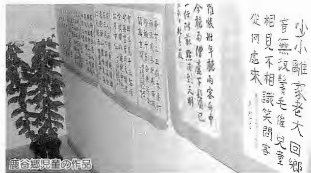
鹿谷郷児童の作品