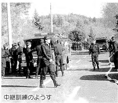
中継訓練のようす

参加して、泉郷川からのホースの中継作業など各分団の巧みな連携でスムーズな実地訓練となりました。