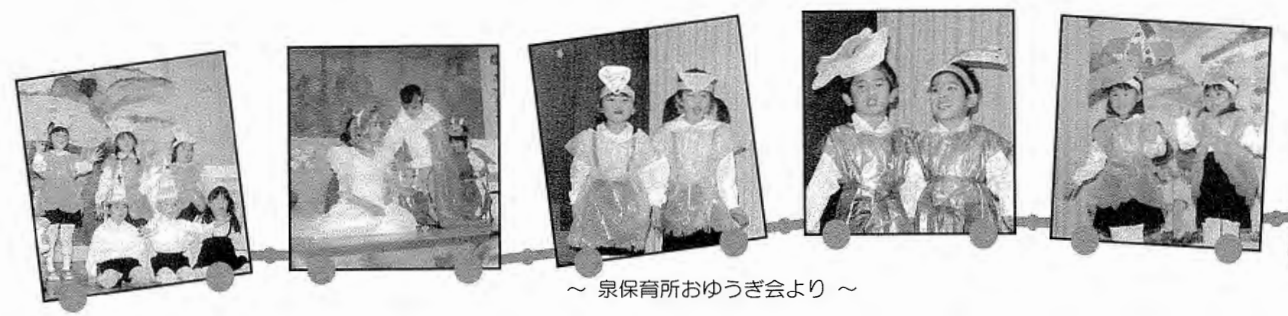
～ 泉保育所おゆうぎ会より ～