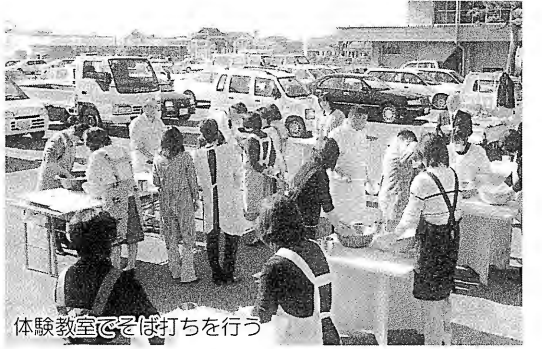
体験教室でそば打ちを行う