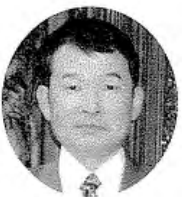
平成5年の日華親善友好都市提携推進協議会鹿谷郷友会鹿谷郷友会

いに郷の皆さんは大感激を受けていました。「とにかく自分の目で確認するとともにお見舞いのことを伝えたいとお見舞いに行きました。郷内の状況は、想像以上にひどかったもので、一刻も早く復旧されることを願っています。」と話していました。 「千羽鶴」「お便り」をコーディネート