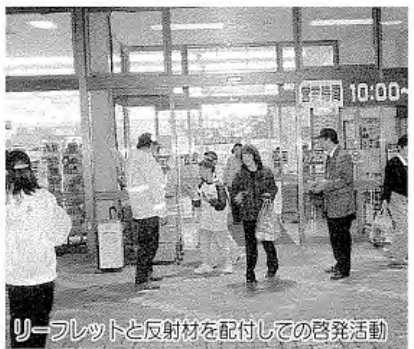
リーフレットと反射材を配付しての啓発活動