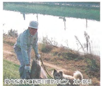
愛犬を連れて新荒川堤防のピン、カン拾い

9月29日というとお祭り、30日は運動会と決まっていたので、お祭りの残り御馳走を持って家族揃って楽しみに行ったものです。お祭りには南須釜の青年達が「平鍬踊り」を神社に奉納するのです。私も63年ほど前に参加した思い出がありますので、玉川会の10周年の際に念仏踊りを見て昔を思い出した感激をいたしました。また、玉川会10周年には村に招待され、村