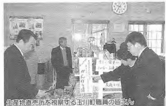
生産物直売所を視察する玉川町職員の方

本村と同名が縁で交流している愛媛県玉川町から行政職員5名が11月25〜26日までの1泊2日の日程で来村しました。本村職員との行政交流会では、本村の福祉、税務、農政、建設などの行政事務の内容について村の各担当者から説明され、質疑応答を通して相互理解を深めました。