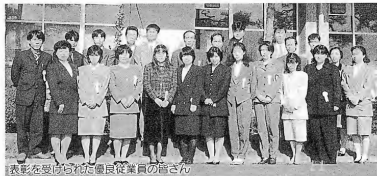
表彰を受けた優良従業員の皆さん