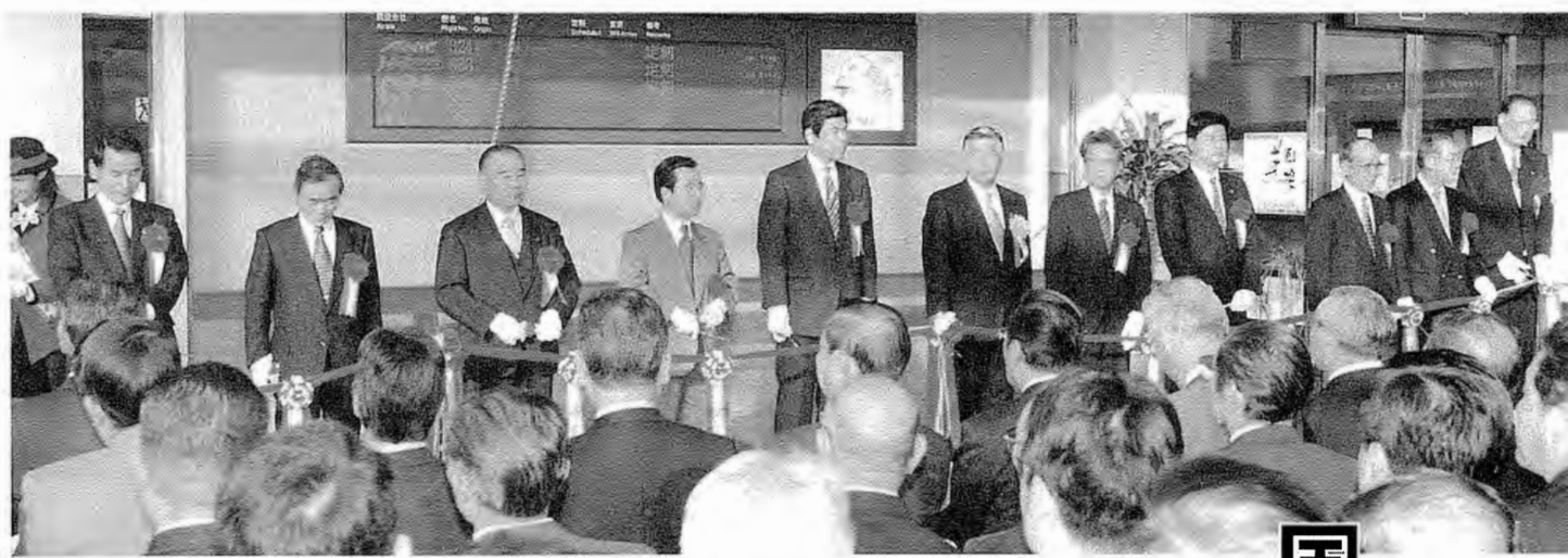
供用開始式でテープカットを行う関係者代表の皆さん(左から2人目が車田村長)