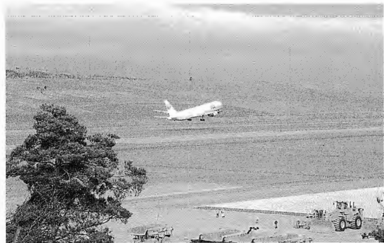
2,500m滑走路から飛び立つJAL大阪便

福島空港の二、五〇〇メートル新滑走路の供用開始式は平成10年12月3日午前8時15分からターミナルビル内1階到着ロビーで行われました。佐藤知事が式辞を述べたあと、知事、国会議員、車田村長など関係機関の代表者による供用開始テープカットやくす玉開披を行って供用開始を祝いました。式典のあと、二、五〇〇メートル新滑走路を使用するの初便となる大阪便と札幌便が飛び立つのを見送りました。