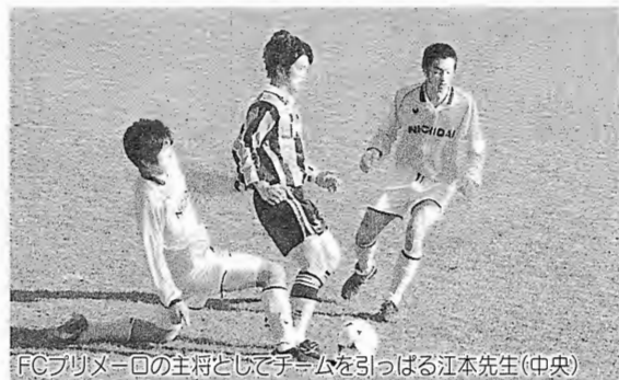
FCブリメーロの主将としてチームを引っ張る江本先生(中央)