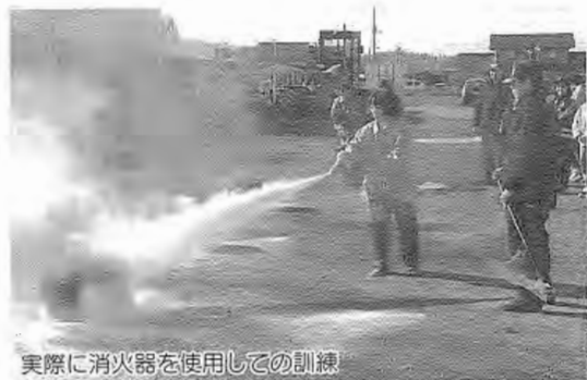
実際に消火器を使用しての訓練