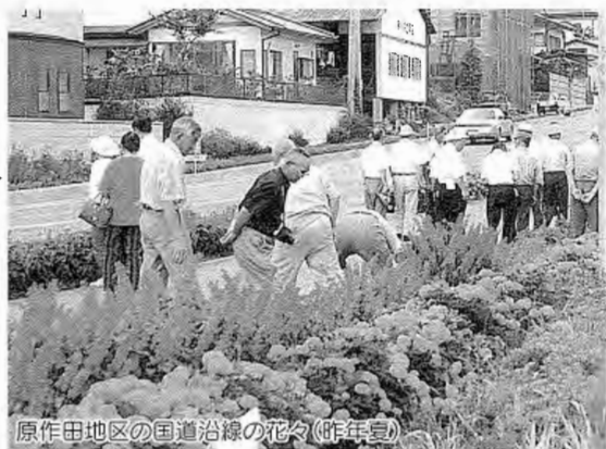
原作田地区の国道沿線の花々(昨年夏)