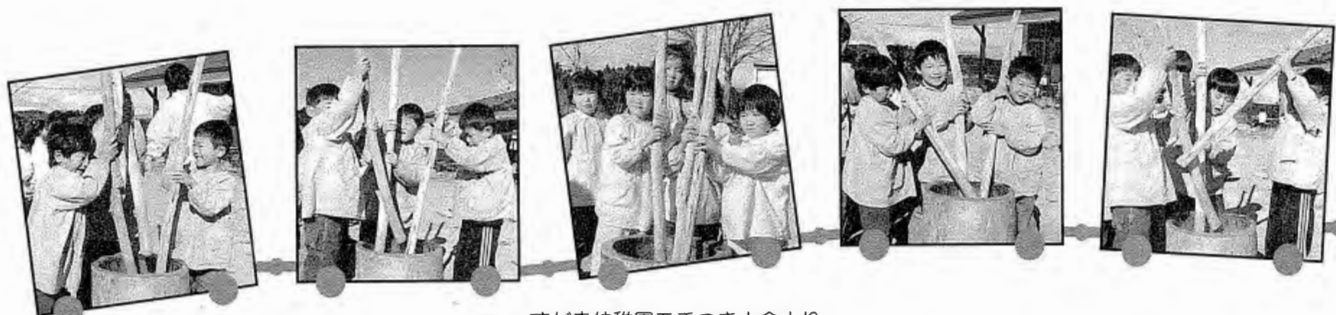
～すがま幼稚園もちつき大会より～