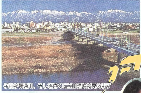
手前が神通川、そして遠くに立山連峰が見えます